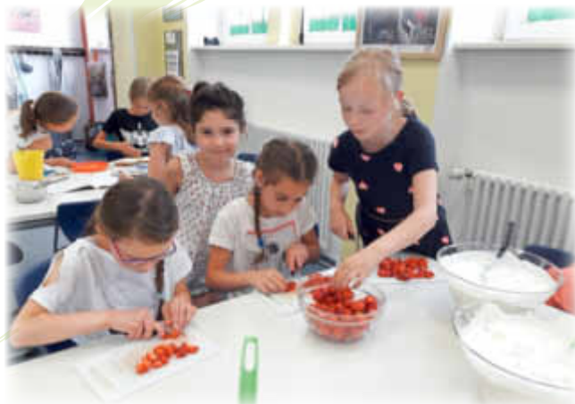
Die Erdbeeren werden für den Früchtequark vorbereitet