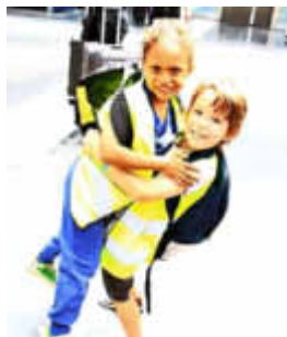
Ausflug der Vorkindkinder nach Freistroff / Sortie à Freistroff

Am 06. Juni machten sich die Vorkindkinder im modernen Reisebus auf den Weg ins benachbarte Frankreich. In Freistroff wurde das „Château St. Sixte“ besichtigt. Ritterspiele, Workshops, eine Schatzsuche sowie das gemeinsame Mittagessen in den kühlen Gemäuern der Burg standen auf dem Programm.