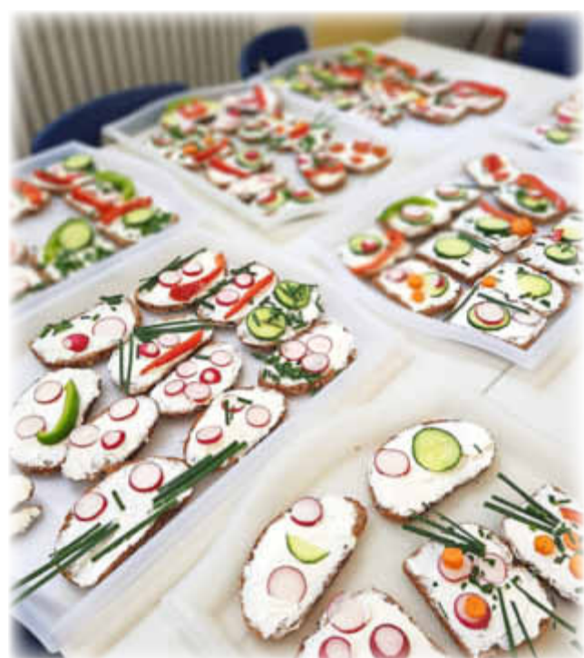
Eine große Vielfalt an Brotgesichtern