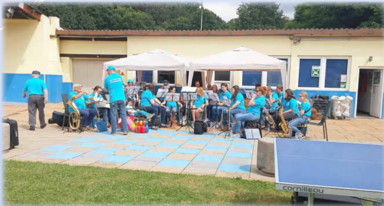
Letzte Absprache vorm Frühschoppenkonzert

Und noch ein neues Angebot: in der Nähe des Dampfbads finden Sie neuerdings ein Bücherregal mit Büchern zum Ausleihen! Hier dürfen Sie auch gebrauchte Bücher einstellen!