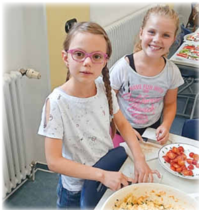
Für den Nudelsalat werden Tomaten kleingeschnitten