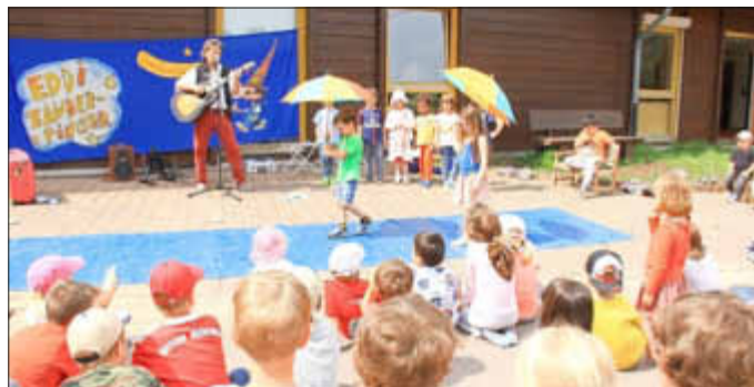
Reise nach Paris / Voyage à Paris

Cette année, notre échange avec nos correspondants de l'AJEFA de Paris était du 22 au 25 mai. 22 enfants et 5 éducateurs ont dormi dans notre jardin d'enfants pour 4 jours. Au programme, il y avait des promenades dans la nature, un barbecue de bienvenue, différents jeux, manger de bonnes pizzas et de bonnes glaces et une mini disco. Tous les enfants se sont bien amusés et cela restera un très bon souvenir inoubliable.