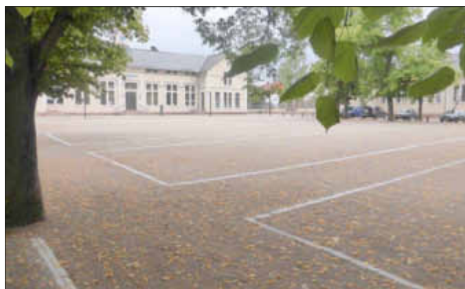
Adolphshöhe mit Markierungen für Händler