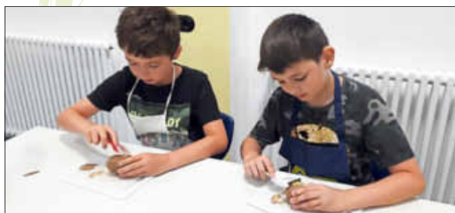
Konzentration beim Kartoffelschälen