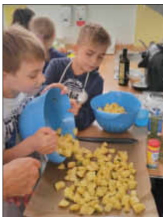
Die Kartoffeln werden in walnuß- große Stücke geschnitten