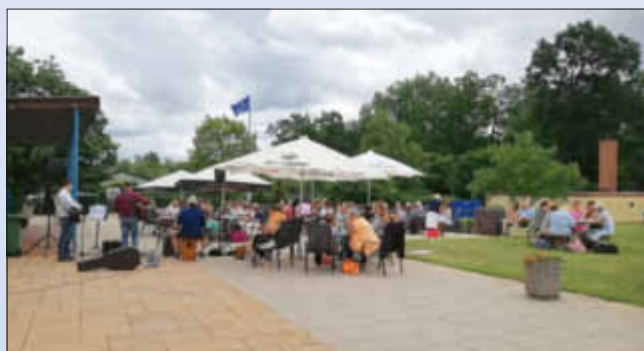
Begeisterte Zuhörer auf der Terrasse und auf der Wiese