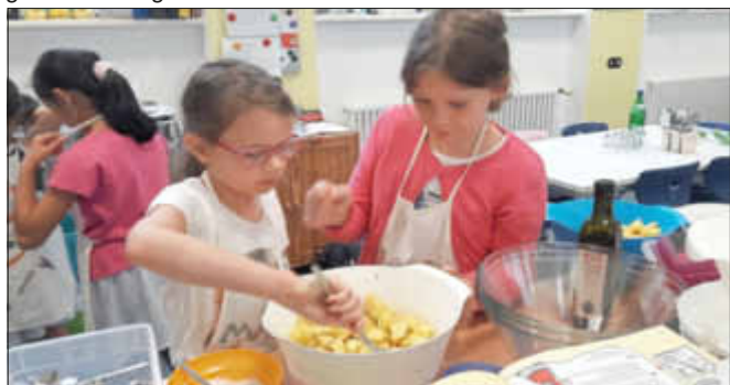
Vorbereitung der Backofenkartoffeln