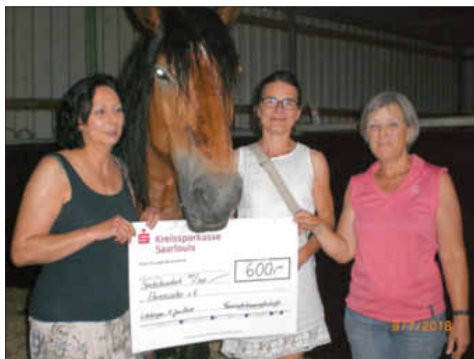
Ihre Feuerwehrkameradschaft Leidingen