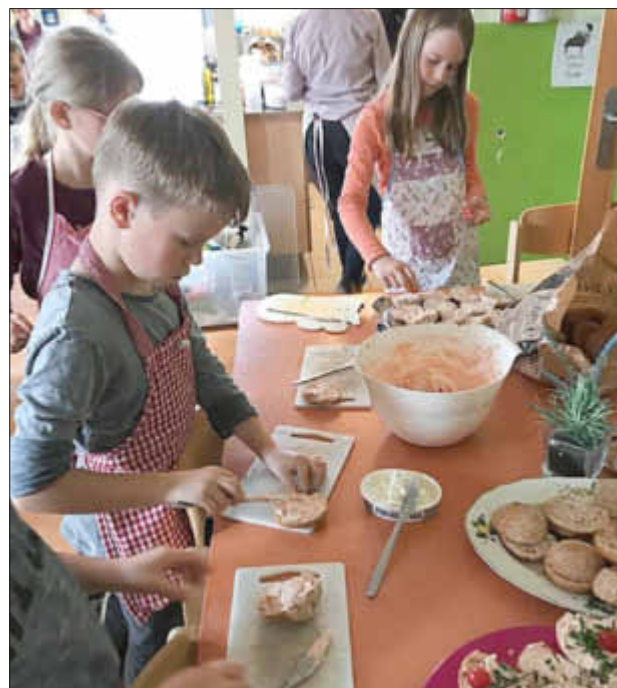
Der vegetarische Brotaufstrich