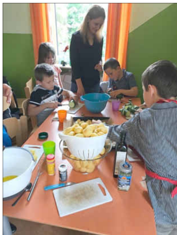
Berge von Kartoffeln wurden geschält