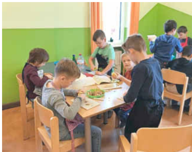
Eifrig bei der Vorbereitung der Kartoffeln