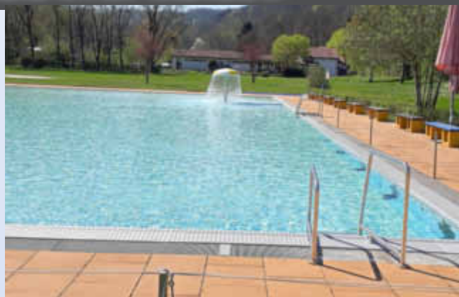
Das Nichtschwimmerbecken sieht schon sehr einladend aus!