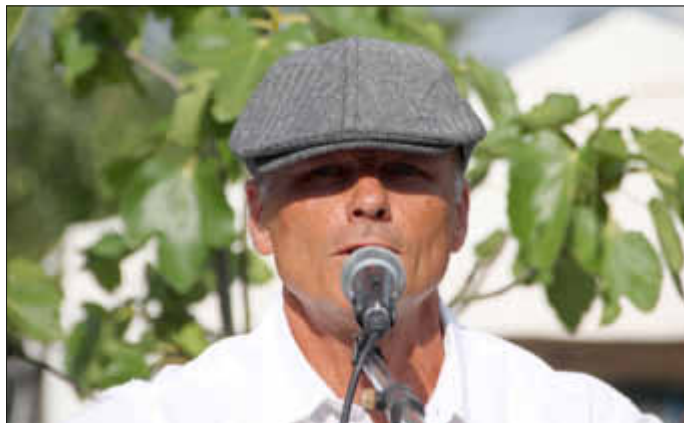
„Was ich noch zu sagen hätte...“ - Reinhard Mey Programm