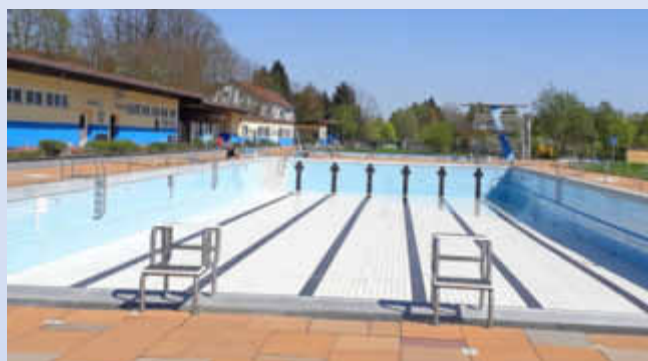
Das Schwimmerbecken kurz vor der Füllung