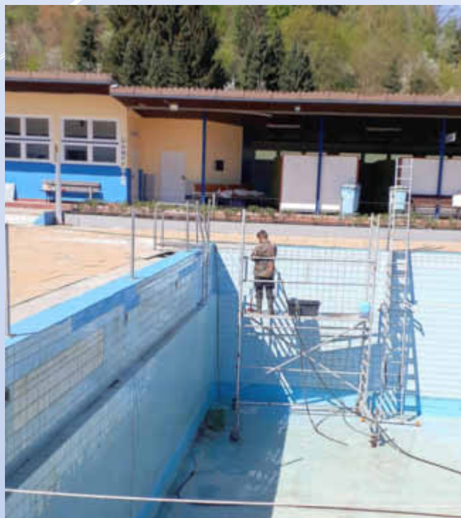
Das Sprungbecken während der Reinigung