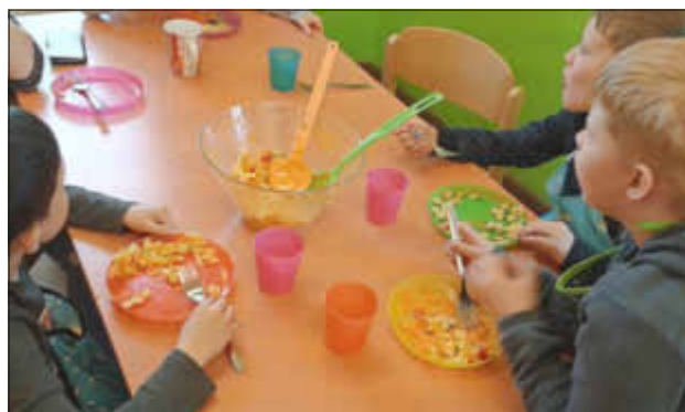
Schüssel und Teller sind schon halbleer