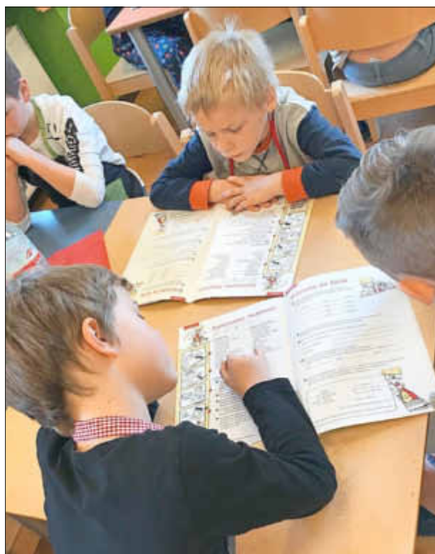
Kritisches Studium des Rezepts