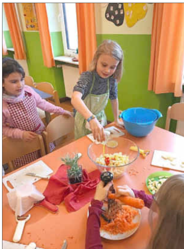
Geraspelte Möhren und geschüttelte Soße