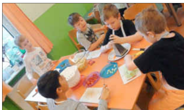
Kritische Beobachter beim Möhrenraspeln