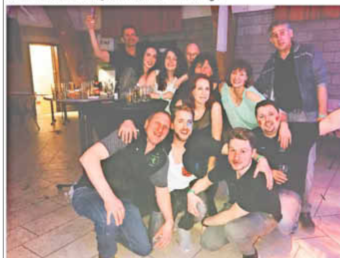
Männerballett des KV „De Neimerder“ Wallerfangen* Nach ihrem Auftritt in Lontzen, Belgien.