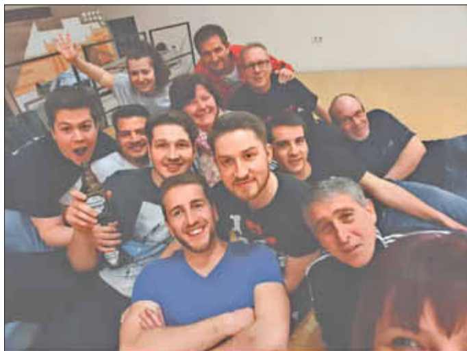
Männerballett des KV „De Neimerder“ Wallerfangen*