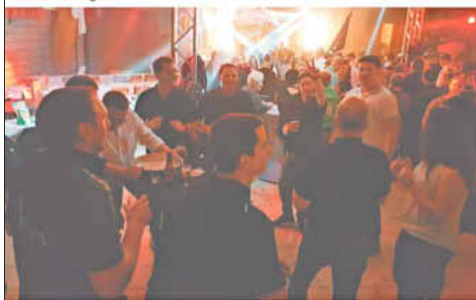
Die Allehhoppers bei der Geburtstagsfeier in Lontzen, Belgien.