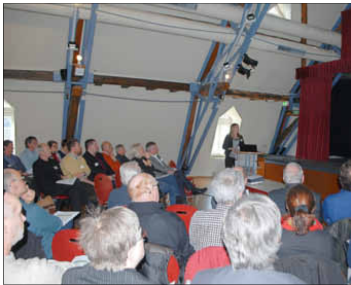
Workshop LAG - Halbzeitbilanz, 21.03.2018