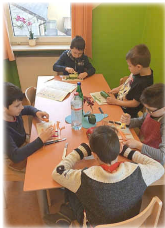
Möhren, Paprika und Gurke werden vorbereitet