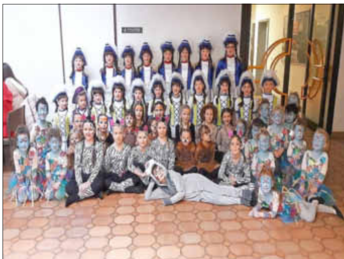
Mitten drin statt nur dabei!

Vielleicht findet auch ihr Kind Freude und Spaß am Tanzen.