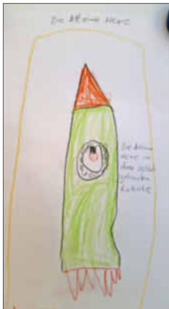
Die kleine Hexe in ihrer Rakete