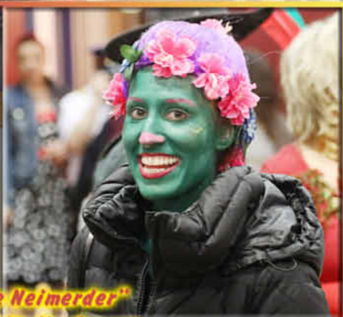
KV "De Neimerder" und TuS Wallerfangen