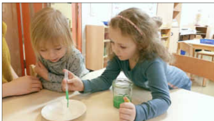
Tröpfchen für Tröpfchen...

Der Würfelzuckerturm war schnell auf dem Teller errichtet und ebenso schnell war das Wasser gefärbt. Dann wurde mit einer Pipette die farbige Flüssigkeit nach und nach auf den Teller gegeben und kurz abgewartet.