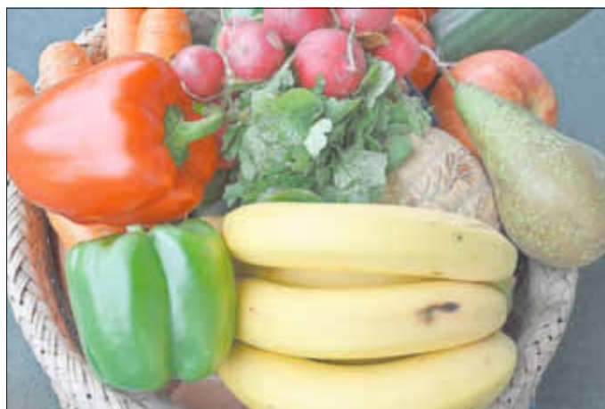
Besonders gesund: Obst und Gemüse

Relativ anschaulich sieht man, was man essen soll und in welchen Mengen an der sogenannten Ernährungspyramide der DGE. Basis der Ernährung sollten Vollkornprodukte, Obst, Gemüse, Hülsenfrüchte und Kartoffeln sein, dazu fettarme Milchprodukte, Fisch, fettarmes Fleisch und Wurst in Maßen und kleine Mengen an Speisefetten (Butter, hochwertige Öle) und Süßigkeiten wie z.B. Kuchen. Allerdings gibt es in den letzten Jahren zunehmend Hinweise, dass gerade im Hinblick auf die Minderung oder Vermeidung von Übergewicht eine Reduktion der Zufuhr schnell wirkender Kohlenhydrate (Brot, Nudeln, Reis, Süßigkeiten, Mehlspeisen, evtl. auch Kartoffeln) sinnvoll ist. Vor allem abends sollten Übergewichtige diese schnell wirkenden Kohlenhydrate meiden. Darüber hinaus ist speziell bei Übergewicht oder auch bei Diabetes eine Beschränkung auf wenige Mahlzeiten pro Tag zu empfehlen.