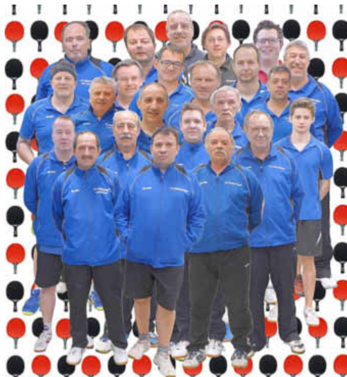
Die aktiven Spieler des TTC Wallerfangen

Mi. 06.12.2017 20:00 TTV Wadgassen 1 - TTC Wallerfangen 2 Sen Mi. 14.12.2017 20:00 TTC Rehlingen 1 - TTC Wallerfangen 2 Sen Mehr über den Verein und seinen Aktivitäten erfahren Sie unter: www.ttc-wallerfangen.de