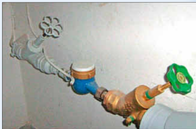
Erdung nach DIN VDE 0100