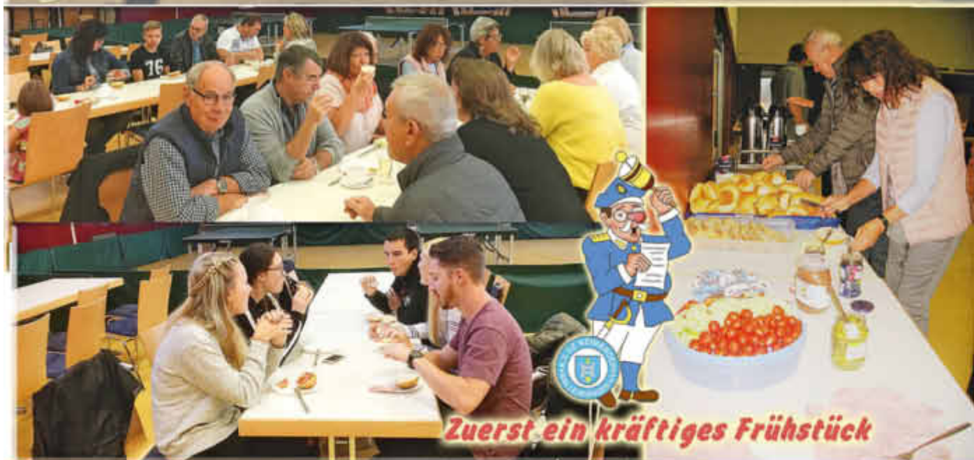
Zuerst ein kräftiges Frühstück