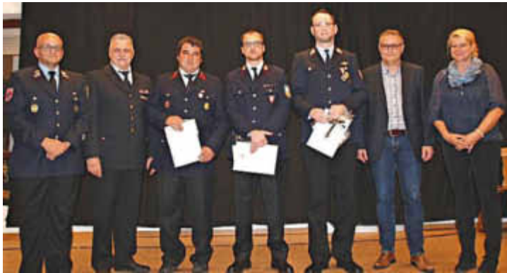
Ehrung für 25 Jahre