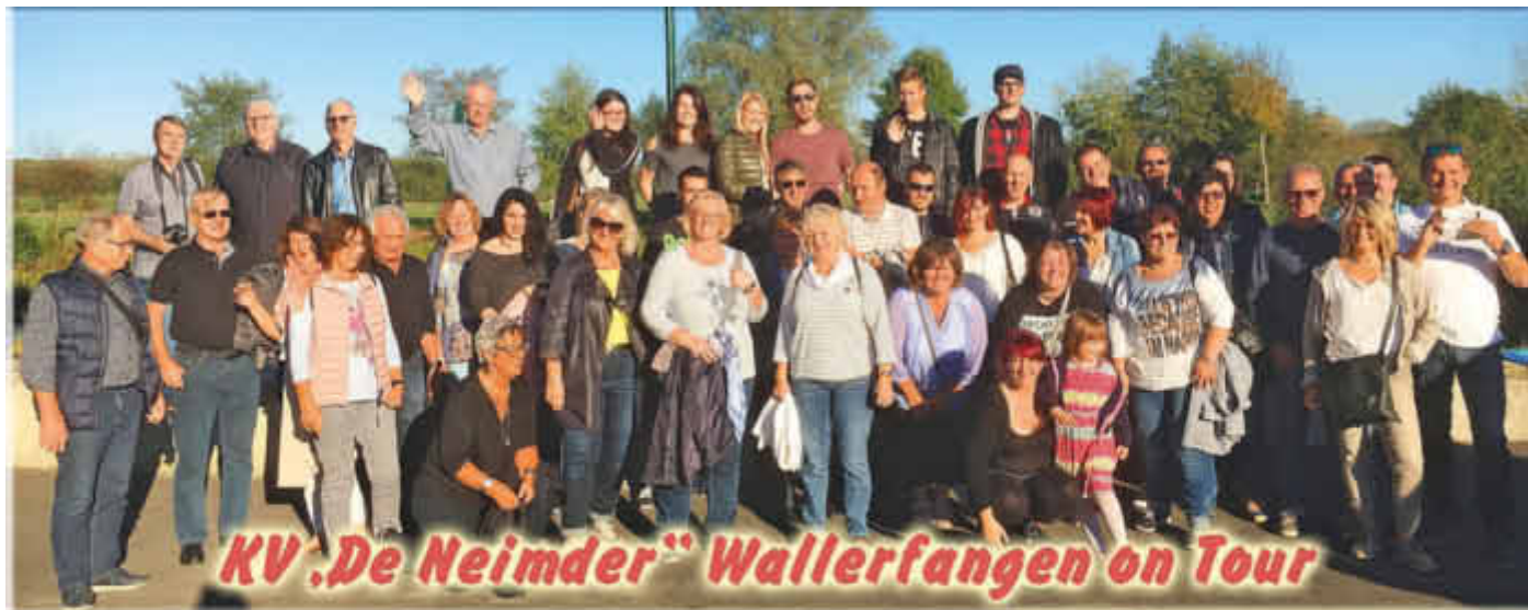
KV „De Neimder“ Wallerfangen on Tour