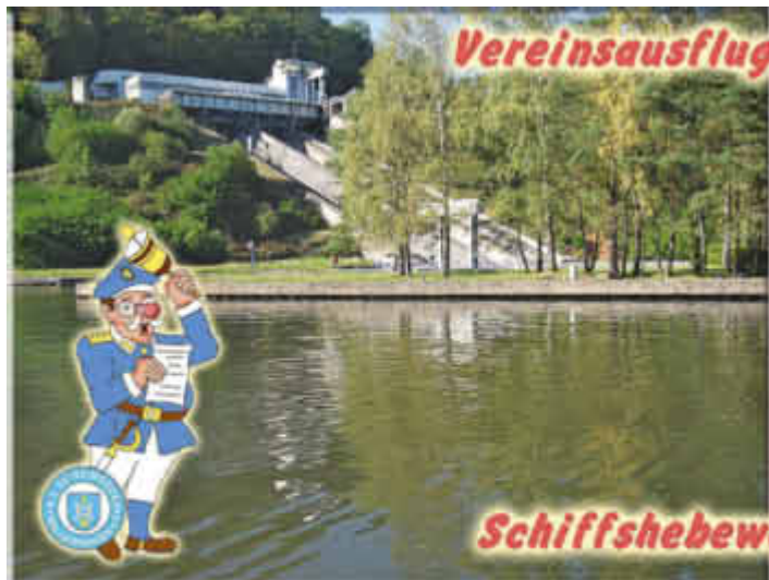
Vereinsausflug 14. Oktober 2017