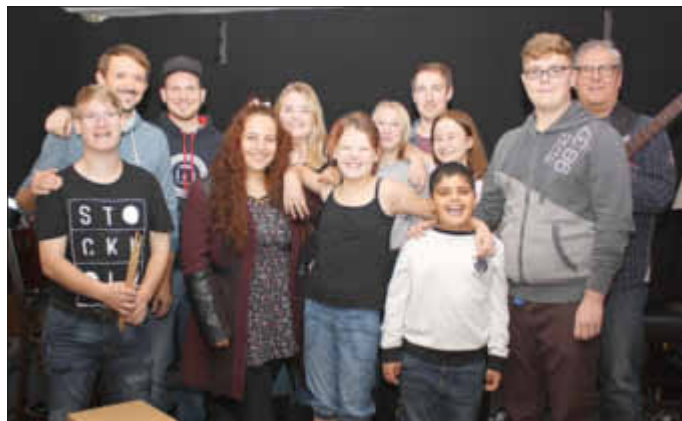
„Ein Meer aus 1000 Stimmen“ bei der ersten Probe der EINKlang-Live-Band mit dem Gesangsteam der Anne-Frank-Schule aus Saarlouis.