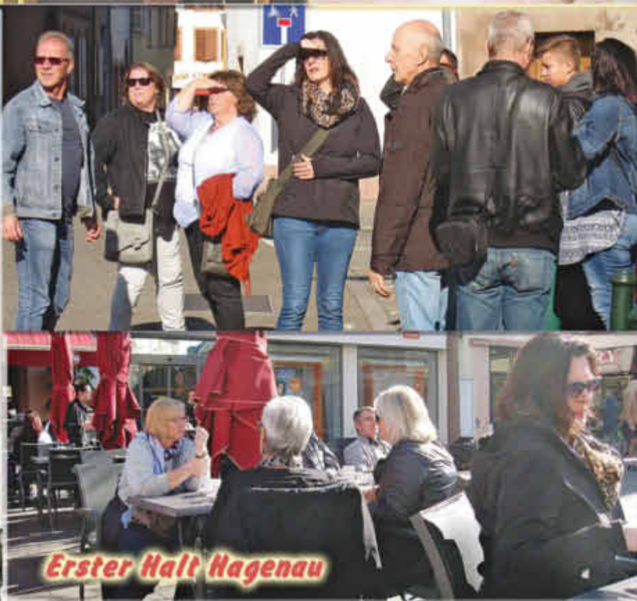
Erster Halt Hagenau