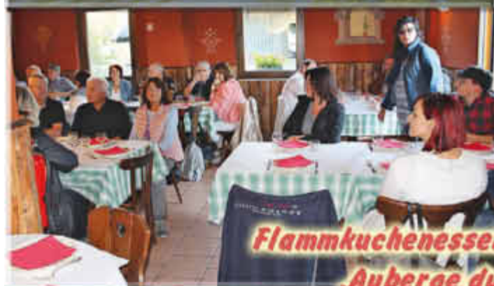
Flammkuchenessen in Harskirchen „Auberge du Moulin!“