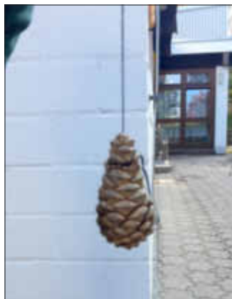
Zapfen, Zapfen an der Wand, wie wird das Wetter? Gib es bekannt !