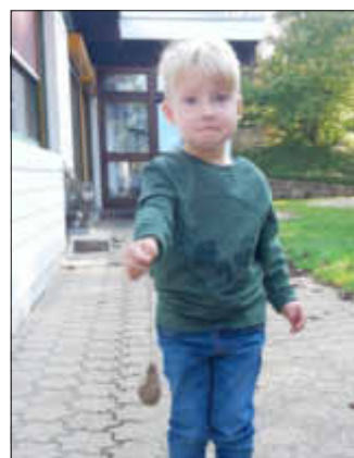
Das Wetter ist schön. Heute wird es nicht so schön.