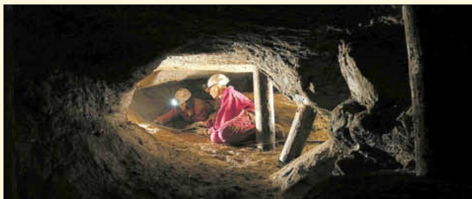
Forschungsthema Dt. Bergbaumuseum Bochum: Römischer Azuritbergbau Wallerfangen

Zu den „Lieblingsprojekten“ des Deutschen Bergbau-Museums Bochum zählt schon seit Jahren die Erforschung des römischen und mittelalterlichen Bergbaus in Wallerfangen. Hier befand sich in den ersten Jahrhunderten n. Chr. ein römisches Revier, das in Folge auch im Mittelalter und in der Neuzeit mit großem Erfolg abgebaut wurde. Die Bergleute gewannen das blaue Kupfermineral Azurit, um daraus die hochwertige blaue Farbe herzustellen.