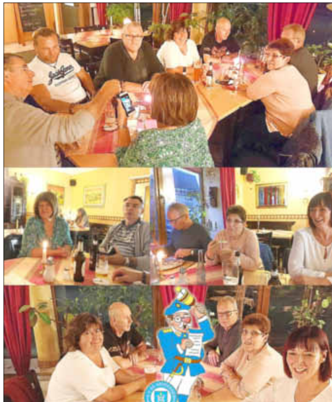
Stammtisch 11.09.17 - Bistro am Schloss