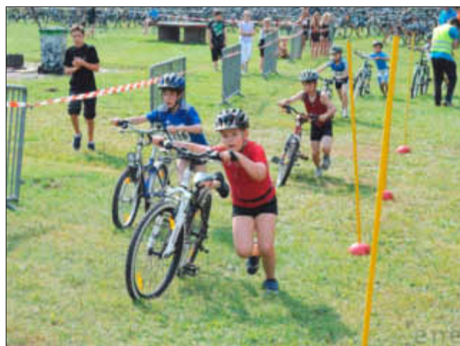
Schülertriathlon - ein gutes Beispiel für Schulsport