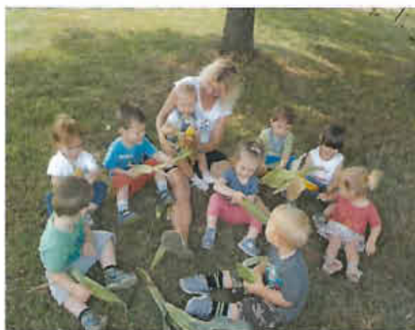
Gemeinsam schauen wir uns unsere Ernte genau an