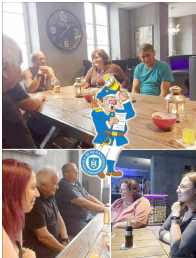
Stammtisch 11. August 2017, Rock Bar Wallerfangen