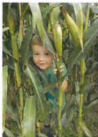
„hallo hier bin ich“