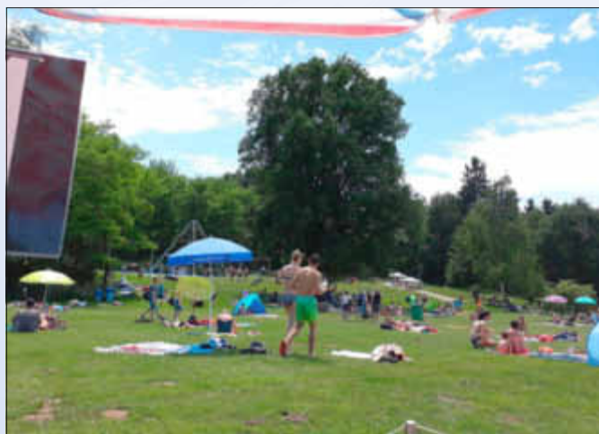
Einladende Atmosphäre im Blauloch

Das Wallerfanger Freibad bleibt in dieser Saison erfreulicherweise noch bis einschl. 17. September geöffnet. Sie haben also noch einige Tage Gelegenheit, das Freibad zu genießen.