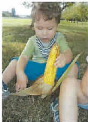
Milan untersucht genau seinen Maiskolben