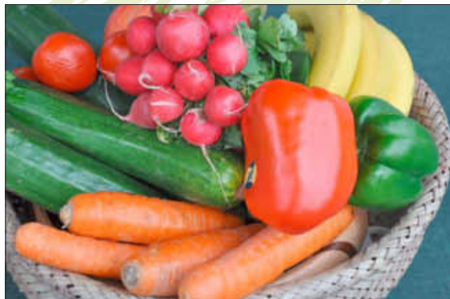
Gesunde Ernährung - ganz wichtig für Kinder

In der Kindheit wird die Grundlage gelegt für Gesundheit und Fitness im Erwachsenenalter.