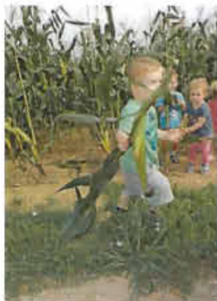
Marten erntet gleich eine ganze Maispflanze