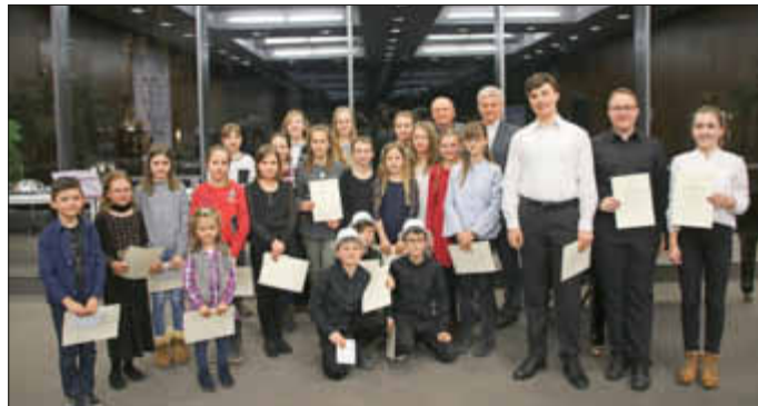
Die Preisträger des 55. Wettbewerbs von ‚Jugend musiziert‘