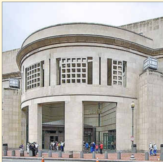
Holocaust Memorial Museum Washington D.C.

Text: Rainer Darimont, T: 06831-62849