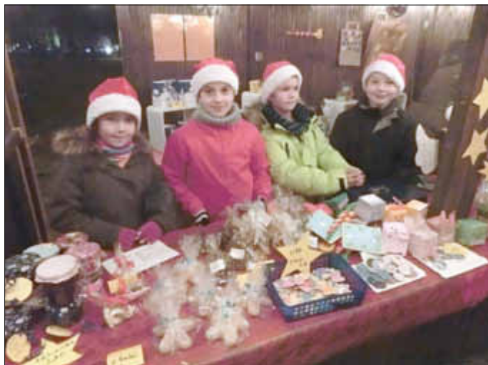
Über 50 Schüler, aufgeteilt in 9 Verkaufsteams, sorgten dafür, dass alle Gäste prompt und fachkundig bedient und beraten wurden.