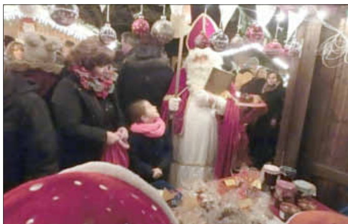
Ja mei, do kann i nua sagen: Toll geschmückter Stand, tolle Angebote, tolle Verkäufer