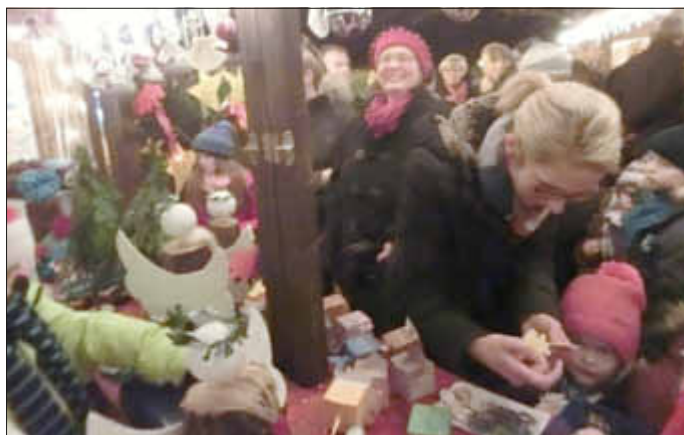
Das wünscht sich jeder Verkäufer: Riesenandrang und -nachfrage