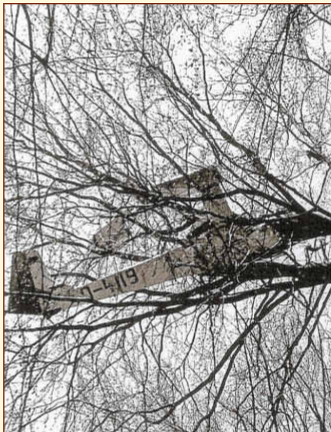
Das Ende von Flug Schleicher K-8-B

Es gab viele Augenzeugen des Vorfalles. Auch das mehrmalige kräftige Gasgeben des Amerikaners erregte Aufmerksamkeit. Die Gelegenheit auf den Anblick eines an niedere Instinkte rührenden Geschehens ließ viele Menschen in der Nähe des Friedhofs zusammenlaufen. Die Trümmer der zerstörten Maschinen wurden nach der Untersuchung durch die Bundesstelle für Flugunfalluntersuchung (BFU), Braunschweig, ab dem 23.4.92 restlos entfernt. Heute erinnert in der Natur nichts mehr an das tragische Unglück.