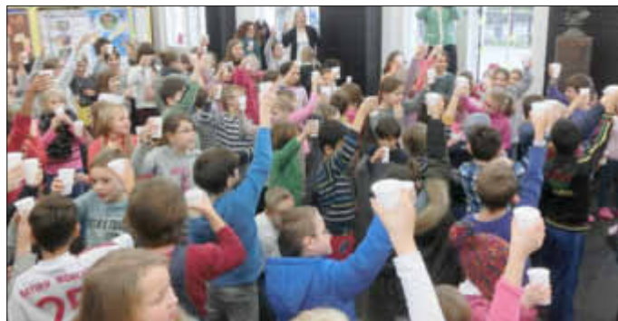
Dass auch Kinder feiern können, bewiesen die 144 Schüler, als sie sich mit Kindersekt auf den gemeinsam errungenen Erfolg zugprosteten.