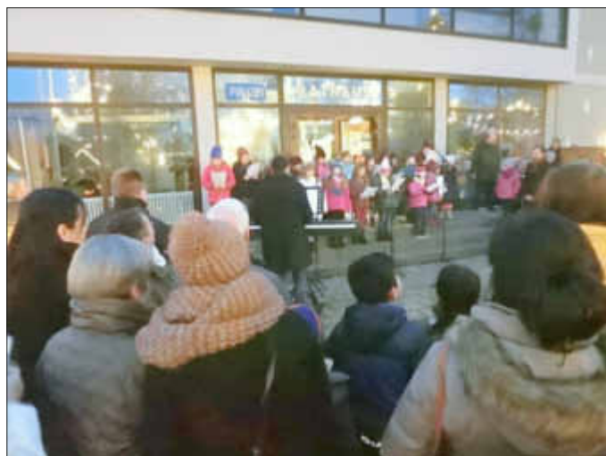
Ein stimmungsvoller Auftakt des Weihnachtsmarktes durch den Schulchor der Grundschule

Am Stand des Fördervereins der Grundschule kam es mehrfach zu Engpässen bei den Glühweinbechern und mehrfach musste Nachschub sowohl beim selbst hergestellten Glühwein als auch beim Waffelteig geordert werden.