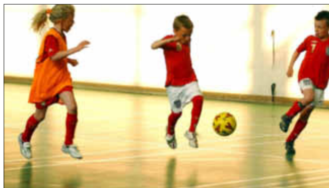
Kinder braucehn Möglichkeiten zum Toben

Dehnübungen steigern den Bewegungsumfang, stärken die Gelenkfunktion und erhöhen die Flexibilität der Sehnen sowie die Muskelleistung - außerdem wirkt das „Stretching“ als Prophylaxe für Verletzungen des Bewegungsapparats.