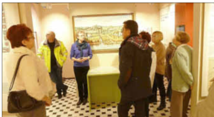
Im „Historischen Museum Wallerfangen“

1. Am Freitag, den 4. Dezember 2015, zeigten 14 Senioren Interesse für das neue „Historische Museum Wallerfangen“. Dank fachkundiger Führung konnte man wieder einiges über Wallerfangen erfahren, was man vorher nicht wusste.