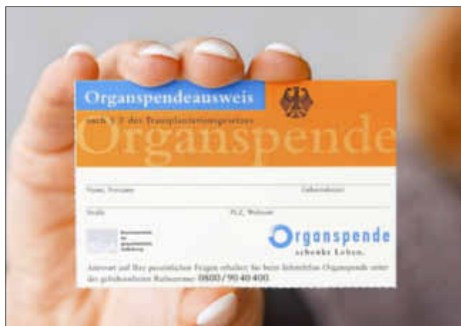
Organspendeausweis - Ein Segen für alle, die auf ein neues Organ warten

Organspendeausweise erhalten Sie unter organspende-info.de Besitzen Sie bereits einen Ausweis zur Organspende?