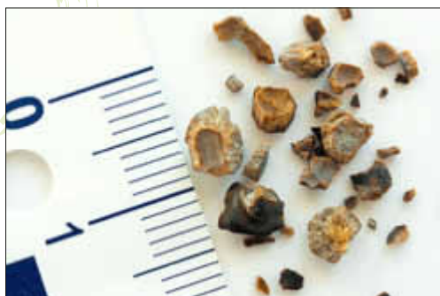
Nierensteine – winzig klein aber Auslöser stärkster Koliken

Im Gegensatz dazu sind die relativ selten vorkommenden „Zystennieren“ eine schwerwiegende Erkrankung, bei der das Nierengewebe durch eine zunehmende Zahl von Zysten zerstört wird.