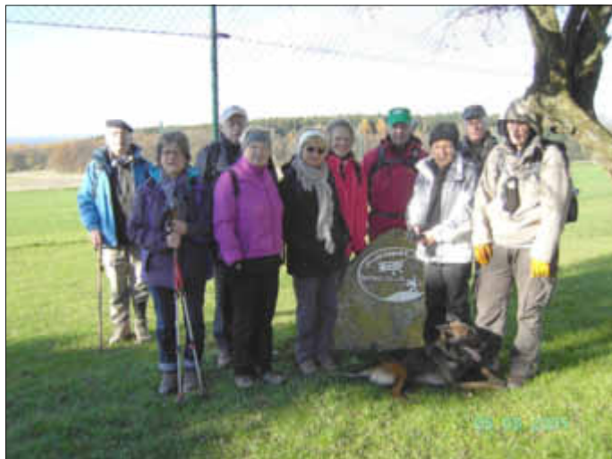
Zwischenrast am Modellflugplatz in Rammelfangen