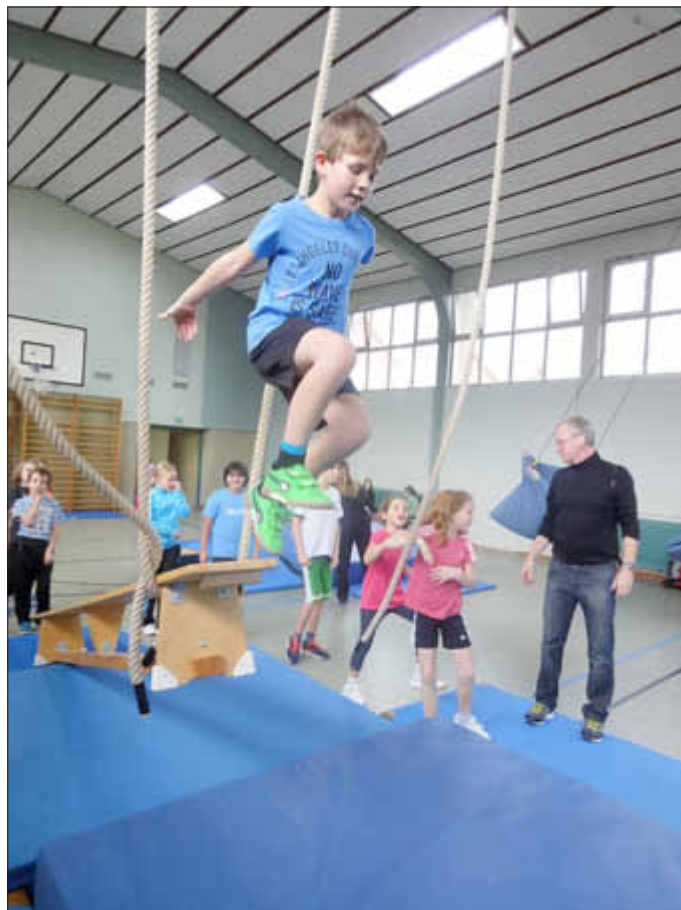
Sprung von der Wackelbrücke