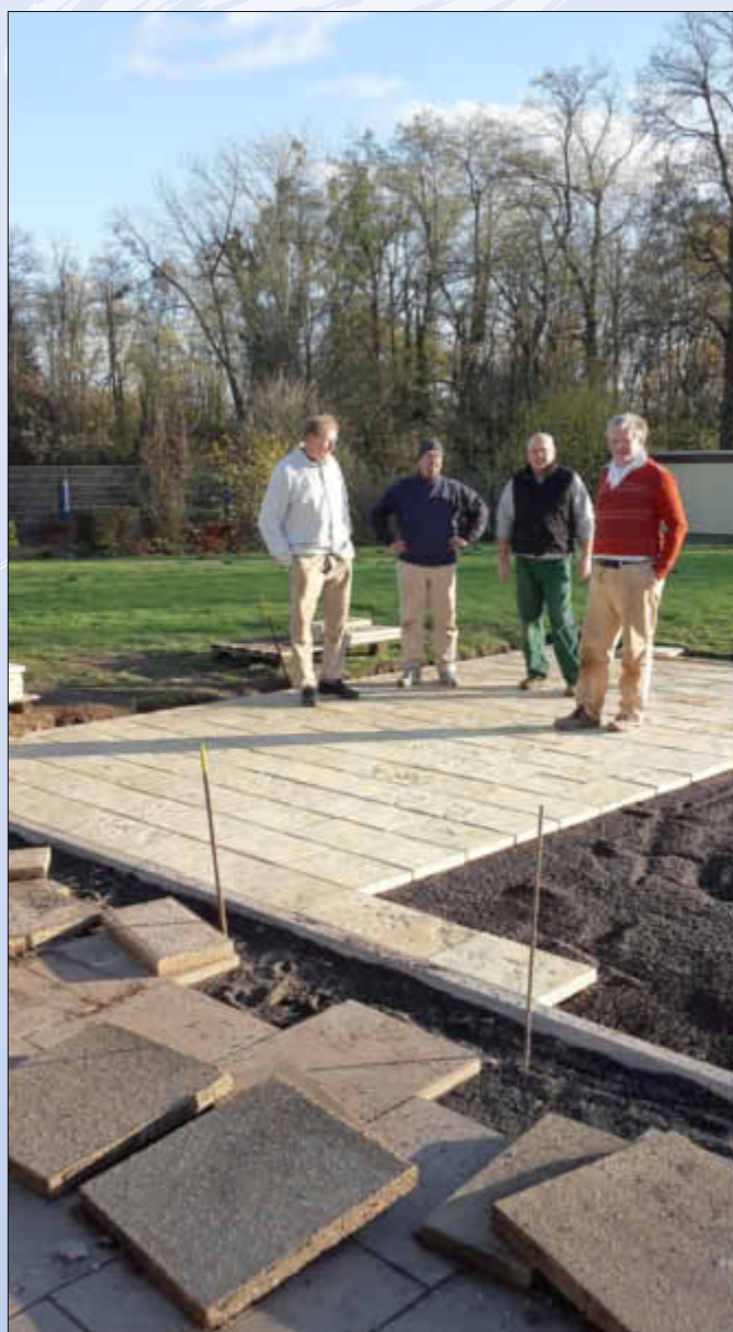
Es sieht gut aus!

Nachdem das herbstliche Schmuddelwetter eine Pause eingelegt hat und die Temperaturen wieder angestiegen sind haben sich die fleißigen Helfer daran gemacht, die Platten für die Terrasse zu verlegen.