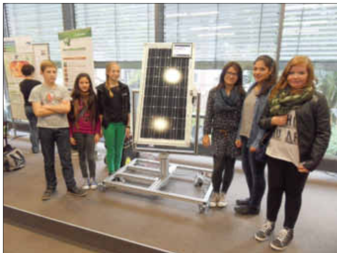
Schüler der Schule am Limberg vor einer Solarzelle