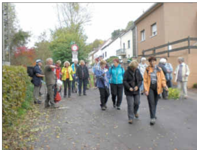
Auf dem Weg zur Schlussrast