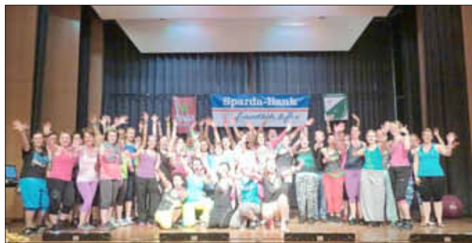
Zumba-Party - die 1.

Nach einer erfolgreichen ersten Zumba Party geht der Spaß weiter. Der TV Steinrausch richtet am 02.11.2013 seine 2. Zumba-Party im Vereinshaus Fraulautern aus. Beginn der Party ist 17:00 Uhr, Ende gegen 20:00 Uhr, Einlass 16:00 Uhr. Mitzubringen sind gute Laune, Handtuch und bequeme Trainingskleidung. Der offizielle Zumba-Shop wird ebenfalls anwesend sein. ZUMBA Teilnehmer sind HAPPY, da ZUMBA Tanz mit Fitness kombiniert. ZUMBA ist kein herkömmlicher Tanzkurs, ein Dance-Fitness Programm - Brasilianische Leidenschaft, Kolumbianischer Hüftschwung und Europäischen Fitnessübungen - das ist Zumba! Lassen Sie sich diesen Event also nicht entgehen. Die Teilnehmerzahl ist begrenzt. Karten gibt es in den Kurseinheiten Zumba des TV Steinrausch montags, 19:00 Uhr bis 21:15 oder freitags von 19:15 bis 20:15 Uhr in der Sporthalle in Neuforweiler oder direkt beim TV Steinrausch unter Telefon 06831/9020140 oder per E-Mail: 1.vorsitzender@tv-steinrausch.de. Für nur 10 Euro kann der Spaß beginnen oder weitergehen.