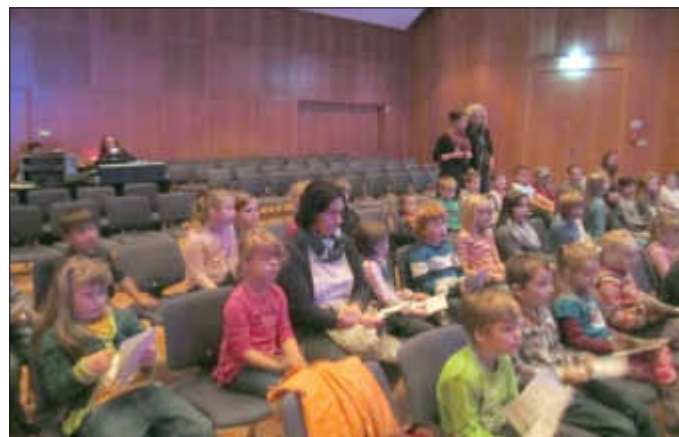
Blick auf die Zuschauerseite - während der Vorführung, die im absolut Dunklen lief, durften leider keine Bilder gemacht werden.

Besonders gut gefiel den Kindern die Geschichte von den Außerirdischen. Insgesamt lässt sich ein gutes Fazit ziehen. Die Kinder verfolgten das Stück teils fasziniert, teils amüsiert und werden den Tag sicher in guter Erinnerung behalten. dn