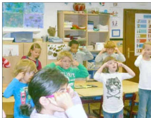
So bereitet man sich optimal auf den Unterricht vor