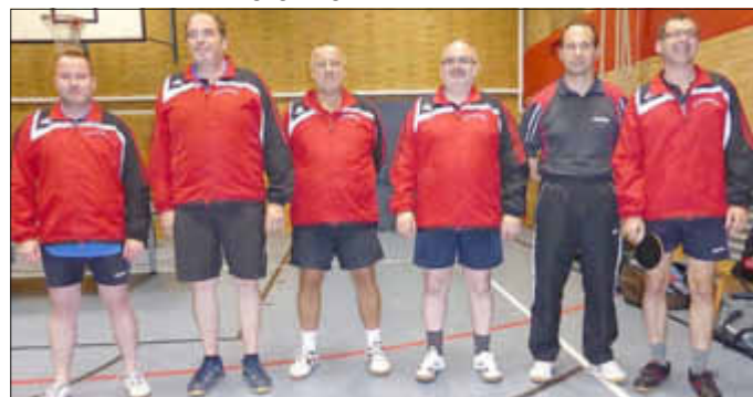
1. Senioren des TTC Wallerfangen