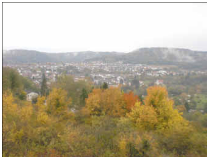
Blick auf Büren und Itzbach