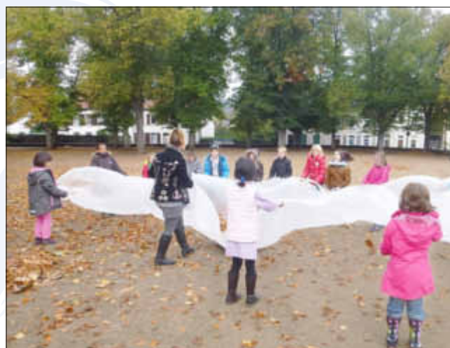
Die Schüler erzeugen Wind

Als Highlight durften die Kinder auf dem Schulhof einen Blättersturm erzeugen. dn