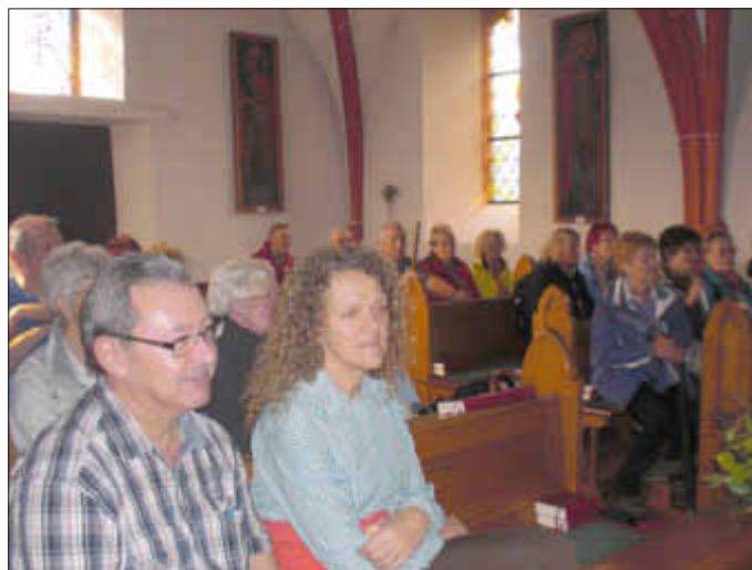
In der Kapelle „St. Willibrordus“