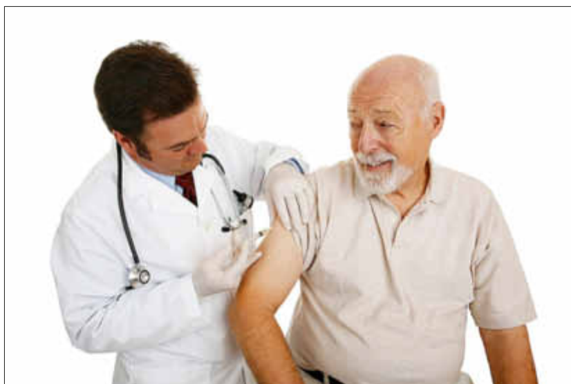
Empfehlenswert für alle Senioren-die Impfung gegen Lungenentzündung

Außerdem wird diese Impfung von der STIKO (Ständige Impfkommission) empfohlen für alle chronisch Kranken und alle Menschen über 60 Jahre, die durch eine solche Infektion vermehrt gefährdet sind.