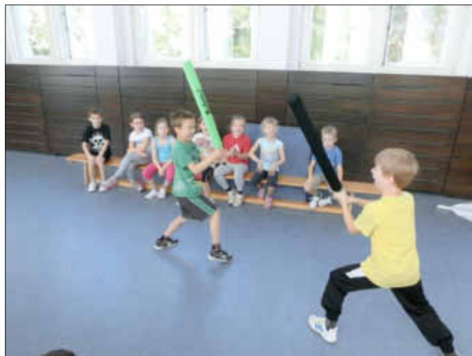
Beim „Mashongakampf“ Eins gegen Eins gelten strenge Regeln