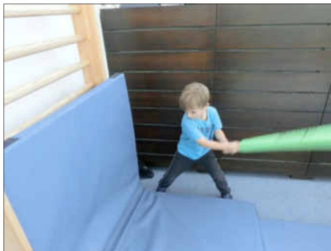
Die Wand muss „herhalten“ -Mashongaeinsatz zum Aggressionsabbau