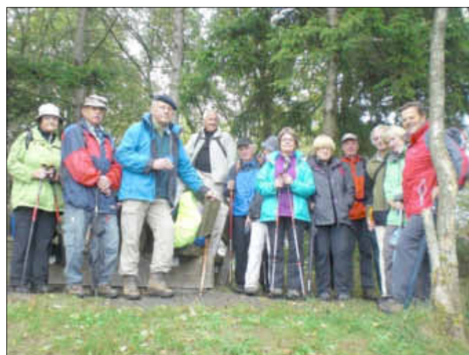
Zwischenrast auf dem Weg nach Waxweiler

3. Am 13. Oktober findet anstatt der Wanderung zum Stromberg bei Schengen, die Weinwanderung 2013 statt. Wir wandern zum Weingut Boesen in Palzem. Für die Senioren ist ein Kontrastprogramm geplant, sie können also auch mitfahren. Die Zahlung der 10,00 Euro gilt als Anmeldung. Wir fahren mit dem Bus um 10.00 Uhr vom Rathaus in Wallerfangen (Hospitalstraße).