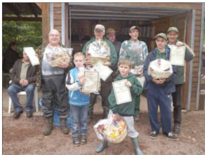
Unsere Sieger des Herbstfischens