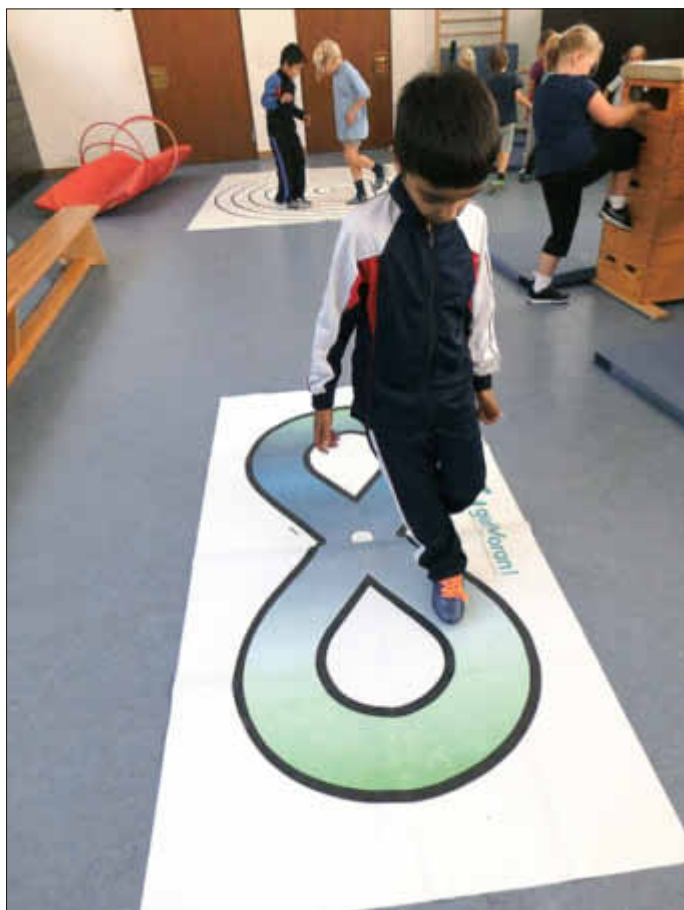
So sieht die liegende Acht aus