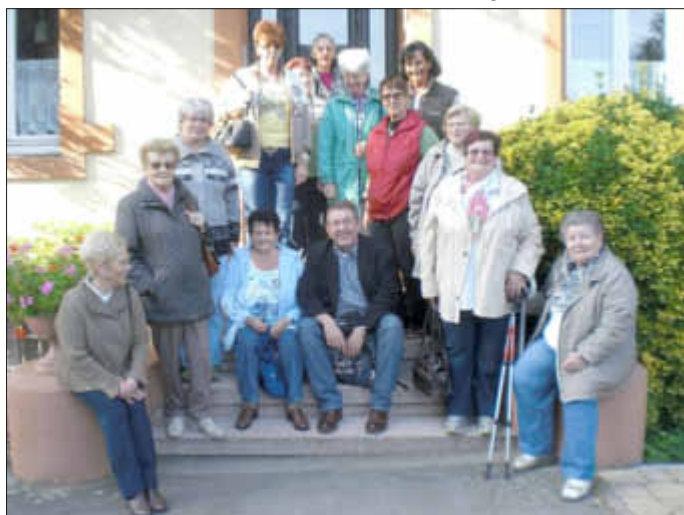
Senioren bei der Schlussrast im Pfarrgarten