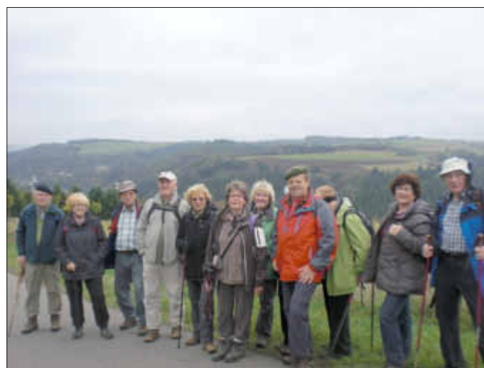
Blick in die Eifel, toll!