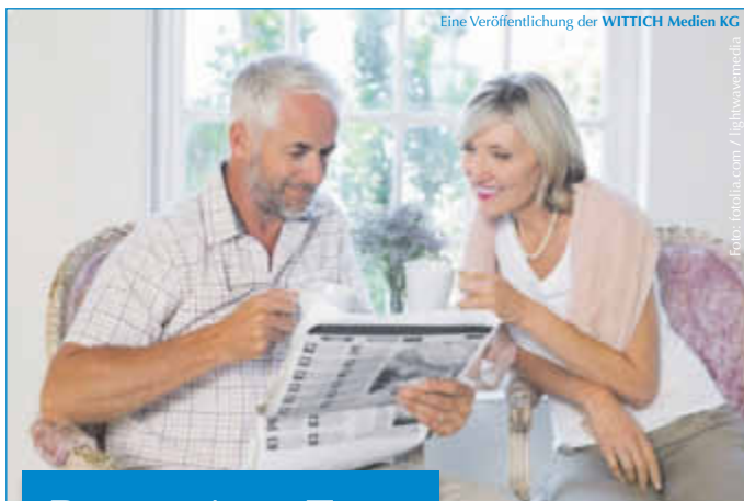
Eine Veröffentlichung der WITTICH Medien KG