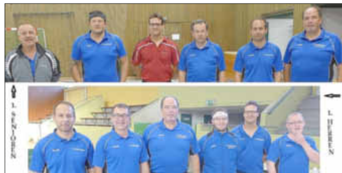
TTC Wallerfangen: 1. Senioren und 1. Herren

Mehr über den Verein und seinen Aktivitäten erfahren Sie unter: www.ttc-wallerfangen.de