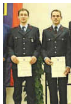
Oberfeuerwehrmann (A. Jost fehlt)