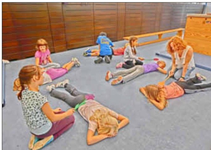
Wohlfühl erlebnis: Massage mit Fliegenklatschen