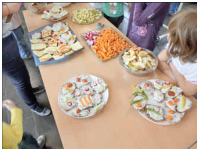
Ein weiteres Highlight des Buffets: Gesunde Quark- und Käsebröte