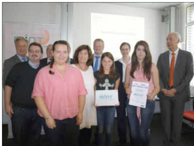
Die Delegation der Schule am Limberg bei der MINT-Auszeichnung

Die Schulleitung, das Kollegium, Elternschaft und Schüler/innen freuen sich über diese Auszeichnung und die Schule wird auch künftig die notwendigen Voraussetzungen schaffen, damit die MINT-Auszeichnung dauerhaft Bestandteil des schulischen Profils bleibt.