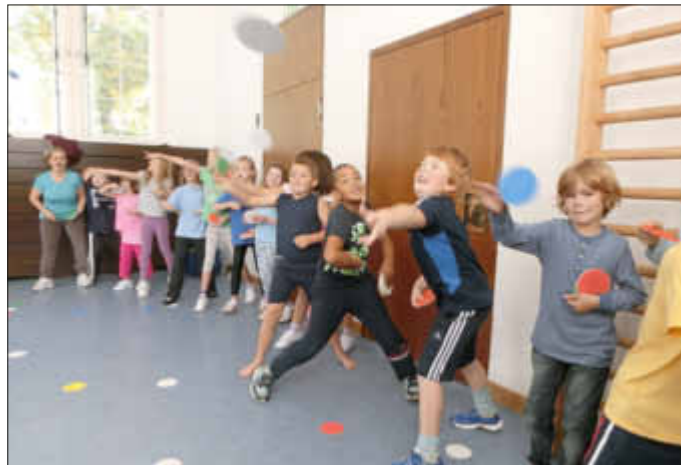
„Feuerwerk“ mit Bierdeckeln