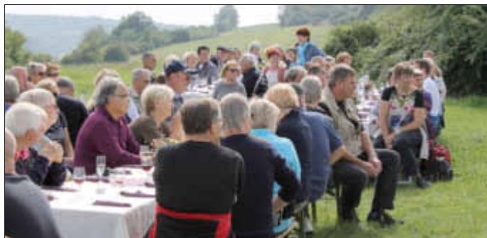
Gourmetwanderung auf dem Gisinger