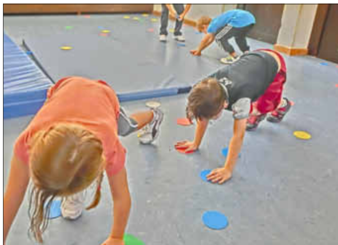
Eine von vielen Übungen mit „Alltagsmaterialien“