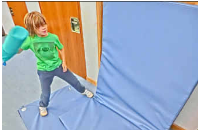
Aggressionsabbau mal anders