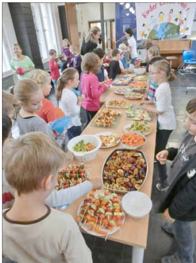
Jedes Restaurant würde sich über einen solchen Ansturm freuen