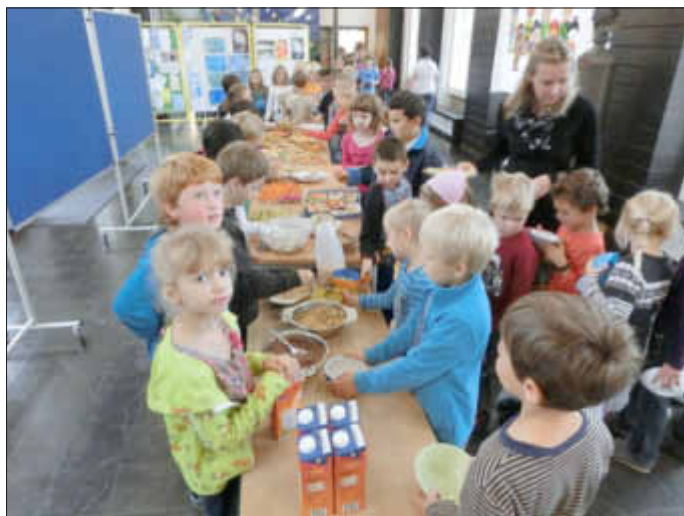
Schon kurze Zeit nach der Buffeteröffnung große Warteschlange bei der „Müslibar“ (Bild vorne)

Das EU-Schulobstprogramm erfreut sich im Saarland wachsender Beliebtheit: Im aktuellen Schuljahr 2013/2014 nehmen über 150 Grund- und Förderschulen an der kostenlosen Verteilung von Obst und Gemüse teil, so viele Anmeldungen gab es noch nie. Der Obsthändler Josef Ochs aus St. Ingbert liefert dreimal wöchentlich knackige Früchte frei Haus.