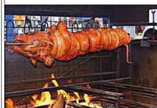
Das Spanferkel wird natürlich frisch vom Grill im Ganzen serviert und fachmännisch zerteilt