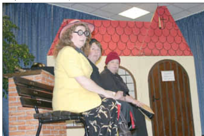
Szenenfoto aus »Wallfahrt zum hl. Antonius«