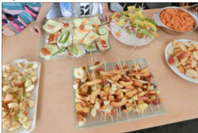
Sehr beliebt und hoch im Kurs: die Obstspieße

Der Kommentar eines Erstklässlers: »Machen wir das morgen noch einmal« und leergefegte Platten zeigten, wie erfolgreich man mit entsprechender Präsentation gesunde Dinge an den Schüler oder die Schülerin bringen kann. hs