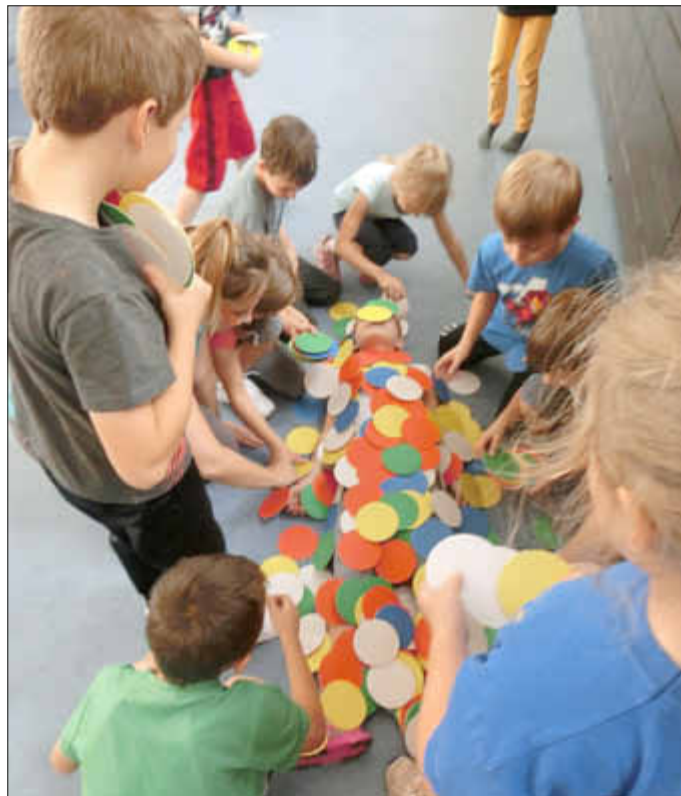
„Bierdeckelmumie“ - ein neues Wahrnehmungserlebnis

Probier'n Sie es aus, allein oder mit ihren Kindern.