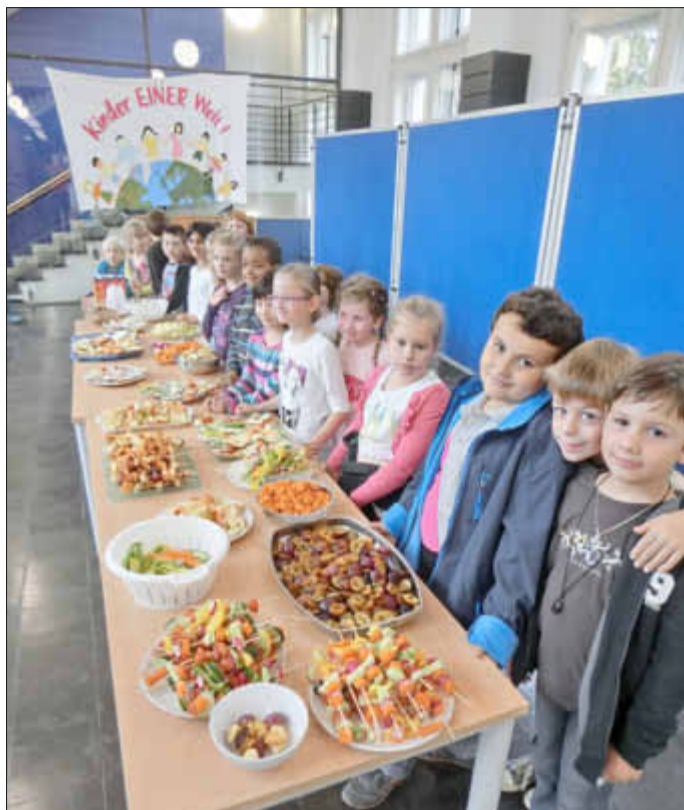
Die Zweitklässler, die dieses Mal für das „Gesunde Frühstück“ verantwortlich waren vor dem Ansturm