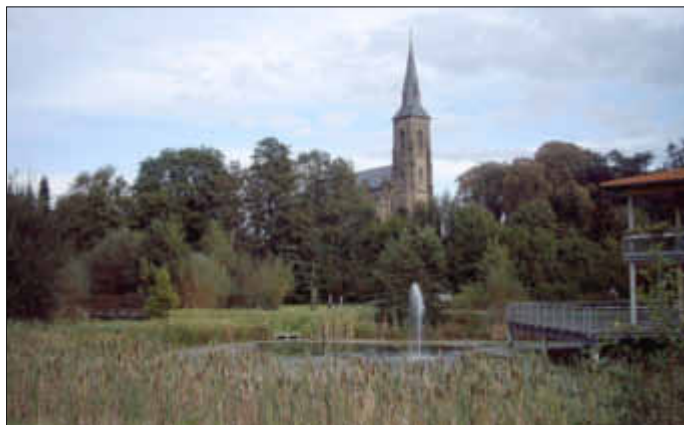
Pfarrkirche St. Katharina