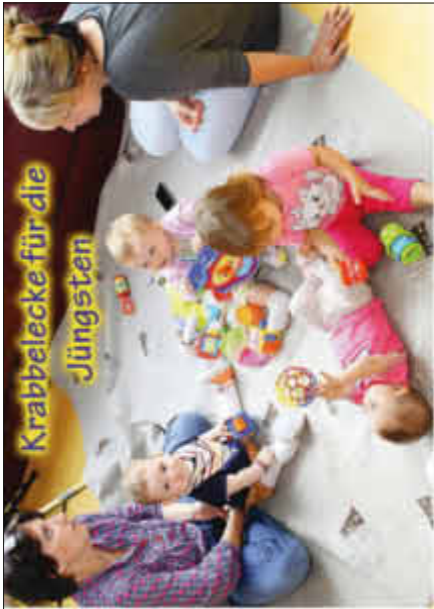
Krabbecke für die Jüngsten