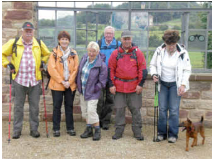
Vor dem Freundschaftsfenster in Leidingen

3. Die nächste Seniorenwanderung mit Wanderführer geht am Mittwoch, den 18. September 2013, auf die Bergehalde in Ensdorf. Wir fahren mit den PKW's bis Ensdorf an die Sporthalle. Von dort bringt uns ein Shuttlebus hoch auf die Bergehalde. Der Shuttle-Bus fährt von 12.00 bis 17.00 Uhr. Treffpunkt ist um 14.30 Uhr am Rathaus in Wallerfangen.