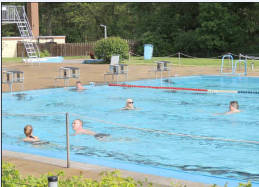
Das Wallerfanger Freibad - optimal für jung und alt

Die ältesten (Dauer-)Badegäste im Wallerfanger Freibad sind deutlich über 80 Jahre alt und zeigen eindrucksvoll die positiven Gesundheits-Effekte des Schwimmens.