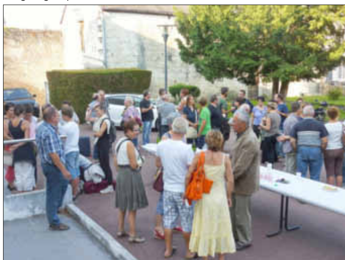
Empfang in Bléré

Nachdem vor zwei Jahren unsere Musikfreunde aus Bléré mit uns in Wallerfangen 40 Jahre musikalische Partnerschaft gefeiert haben, stand Ende August unser Gegenbesuch an. Die Busfahrt ins schöne Loiretal verlief ruhig, sodass wir am Freitagnachmittag am Centre Culturel in Bléré ankamen, wo wir von unseren französischen Gästen mit einer Auswahl regionaler Getränke empfangen wurden. Am nächsten Tag stand dann zunächst die gemeinsame Probe an, die wieder einmal bewies, wie universell die Sprache der Musik darstellt. Es wurde ein attraktives Programm auf die Beine gestellt, und wir freuen uns jetzt schon auf den Tag, an dem wir einige der einstudierten Stücke auch in Wallerfangen auf die Bühne bringen werden. Natürlich gab es auch genügend Zeit um die Region und ihre weltbekannten Schlösser zu erkunden, wie zum Beispiel das Königsschloss in Amboise oder Chenonceau. Gemeinsam wurde am Sonntagmorgen eine Weinwanderung unternommen, in deren Anschluss wir die Gelegenheit hatten die entsprechenden Endprodukte ausgiebig zu probieren.