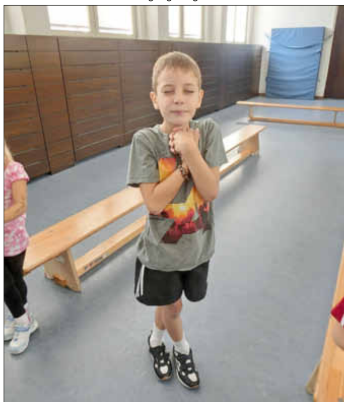
Eine der Gleichgewichts- und Konzentrationsübungen

dernd sind, dienen dazu, einen möglichen Zusammenhang zwischen der Motorik und dem Lernen zu erkennen.