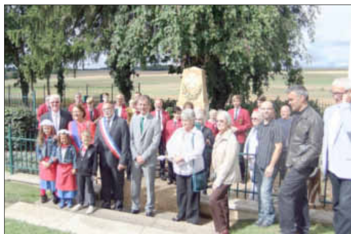
Gedenkfeier in Mey

Am Sonntag, 08. September 2013 hat eine Gruppe Gisinger Bürger in Begleitung der Orchestergemeinschaft St. Barbara-Gisingen in Mey an der diesjährigen Gedenkfeier zu Ehren der deutsch-französischen Schlacht von 1870 teilgenommen.