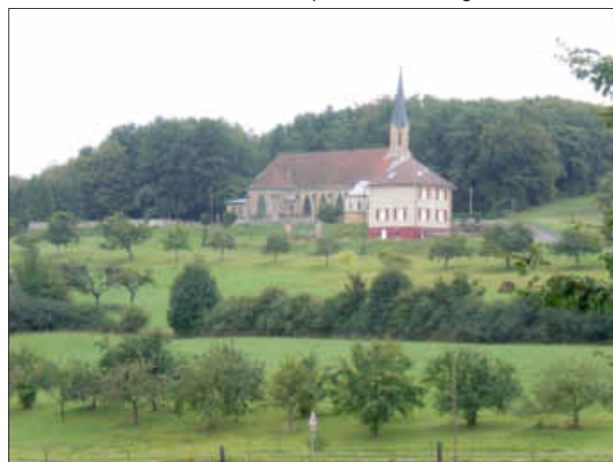
Blick auf die französische Kirche St. Jeanne d'arc in Leiding