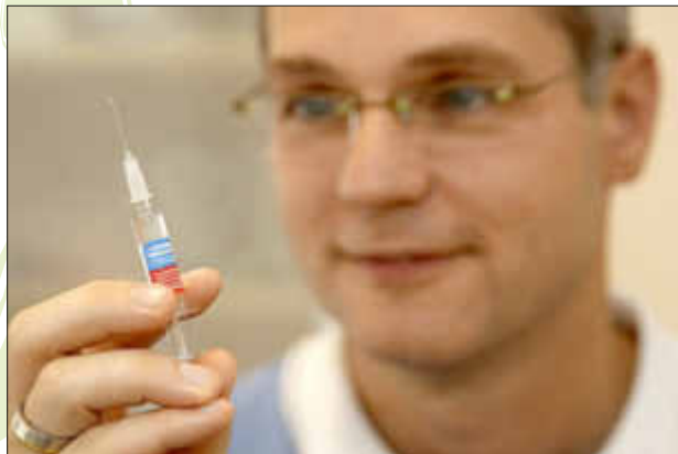
Ein kleiner Pieks kann schützen

Der Herbst naht unübersehbar und damit auch die Erkältungszeit.