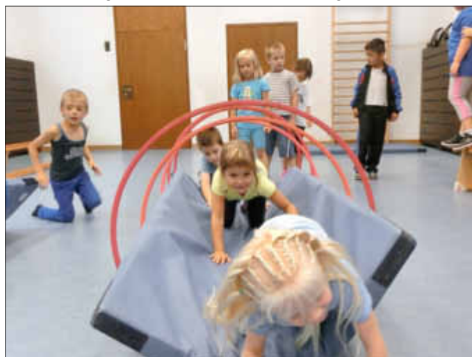
Kriechen über einen wackligen Untergrund

Aber der Sinn liegt nicht nur im Beobachten, ob beide Gehirnhälften entsprechend vernetzt sind, sondern durch sie werden auch Lernprozesse in Gang gesetzt, die separiertes Lernen in Gang setzen. Separiertes Lernen ist eine Fähigkeit, die vor allem bei der Einführung neuer Sachverhalte oder Stoffgebiete (Grundrechenarten, Einführung eines neuen Buchstabens,..) benötigt wird.