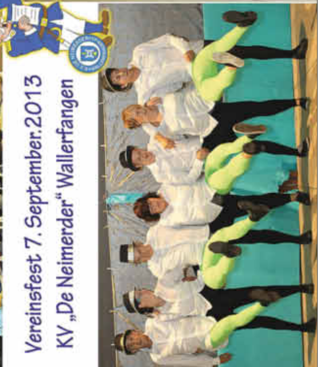
Vereinsfest 7. September.2013 KV „De Neimerder“ Wallerfangen