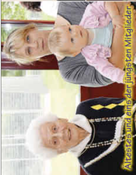
Altestes und eins der jüngsten Mitglieder