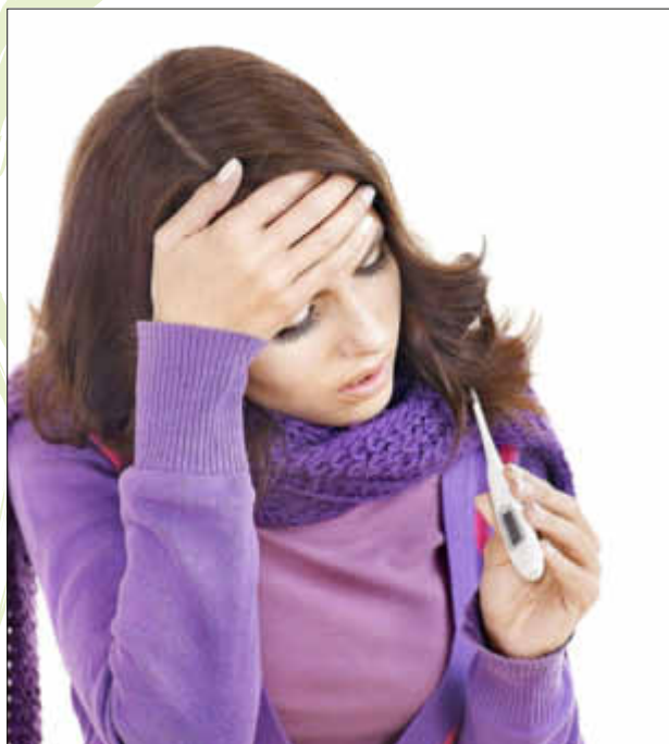
Bei einer Grippe ist das Allgemeinbefinden stark in Mitleidenschaft gezogen

Der Grippeimpfstoff wird jedes Jahr nach den Empfehlungen der WHO (Weltgesundheitsorganisation) neu zusammengesetzt aus den für die jeweilige Saison zu erwartenden Virusstämmen. Grippevirus ist nicht gleich Grippevirus; man unterscheidet verschiedene Stämme, die unterschiedlich virulent (=krankmachend) sind.