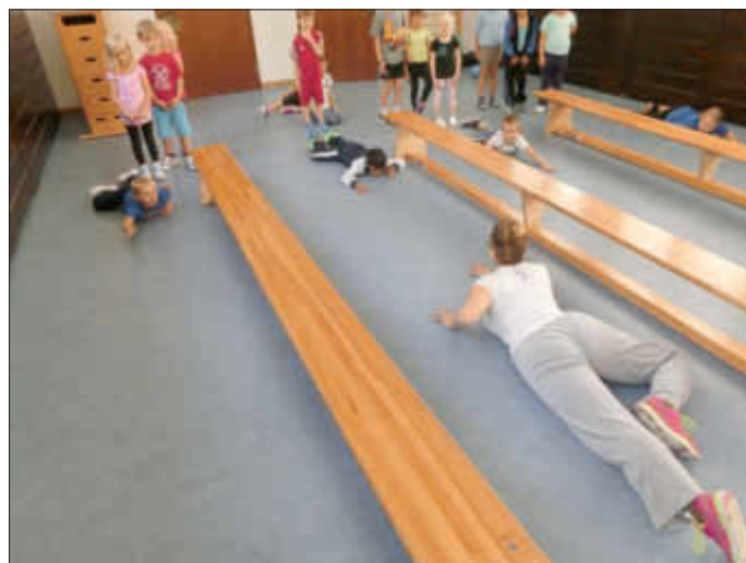
Demonstration der Technik des richtigen Überkreuzkriechens

Aber der Sinn liegt nicht nur im Beobachten, ob beide Gehirnhälften entsprechend vernetzt sind, sondern durch sie werden auch Lernprozesse in Gang gesetzt, die separiertes Lernen in Gang setzen. Separiertes Lernen ist eine Fähigkeit, die vor allem bei der Einführung neuer Sachverhalte oder Stoffgebiete (Grundrechenarten, Einführung eines neuen Buchstabens,..) benötigt wird.