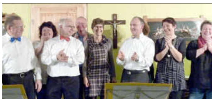
Die Gisinger Theatergruppe geht wieder auf Tournee

Der für diesen Herbst geplante Dreiaakter »Der schroo Onkel« wurde aus Termin- und Zeitgründen zunächst verschoben und wird wahrscheinlich im Frühjahr 2014 aufgeführt.