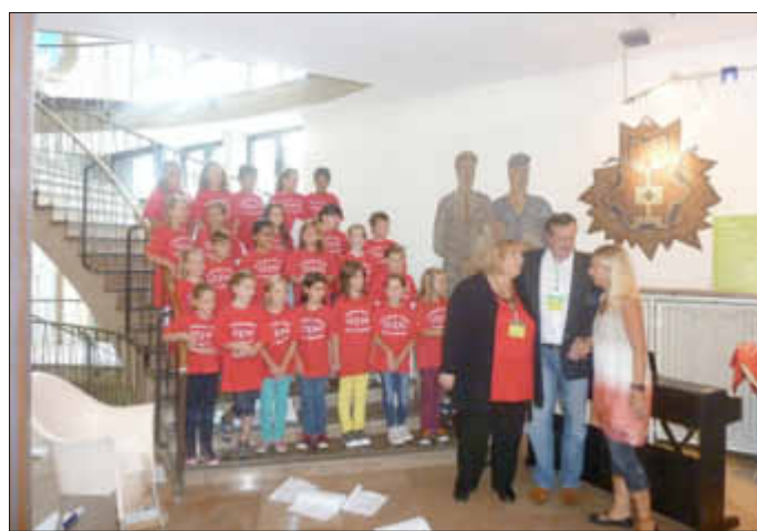
Die Musik-AG der Grundschule Gisingen - Auf dem Muschelkalk

In den ersten beiden Sport-Stunden standen nach einigen Kennenlernspielen, in denen mit Reaktionsanforderungen auch gleich die ersten gehirnanregenden Übungen absolviert wurden, hauptsächlich Übungen zur Stärkung des »Urvertrauens« auf dem Plan. Bewegungsaufgaben zur Vernetzung der beiden Gehirnhälften, Schulung von Raumwahrnehmung und -orientierung, Schulung der Konzentrationsfähigkeit waren Schwerpunkte weiterer Übungen. In der ersten Bewegungsbaustelle ging es hauptsächlich um die Schulung des Gleichgewichts. hs