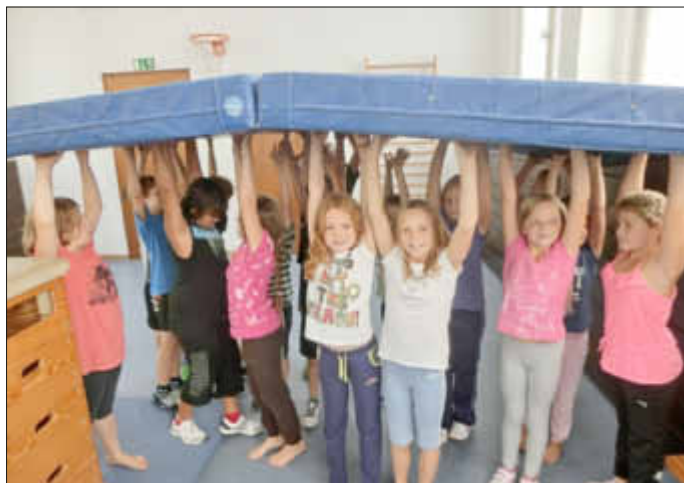
Gemeinsam packt man auch Unmögliches