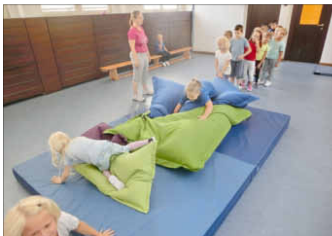
„Krabbeln“ auf und über einen wackeligen Untergrund