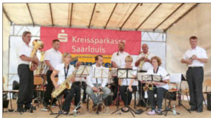
MV Ihn in Aktion

Verlag + Druck Linus Wittich GmbH -Redaktion-