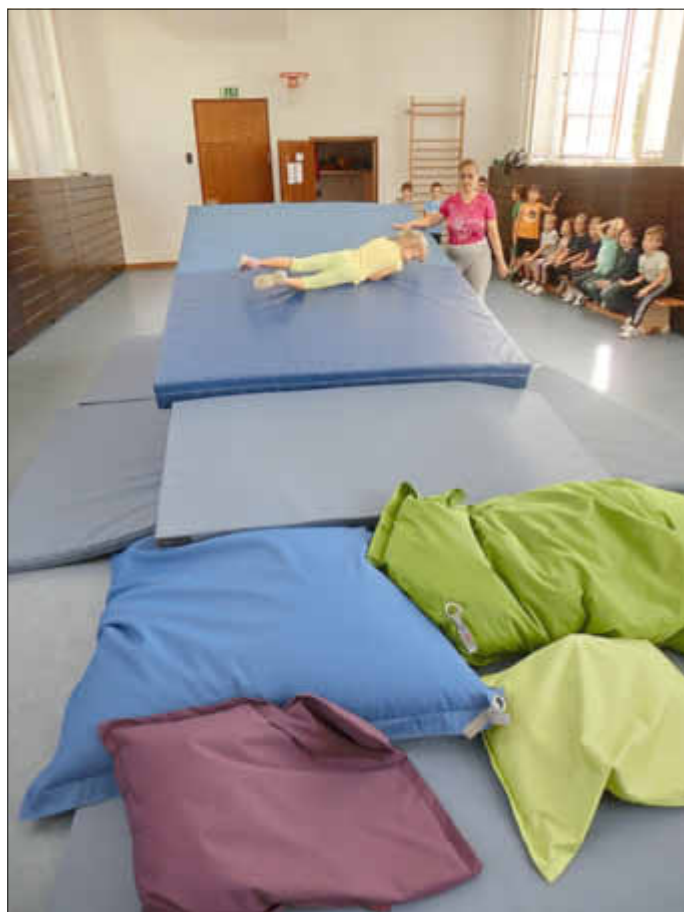
Variation: Die Längsrolle