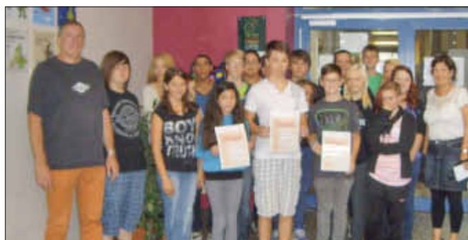
die Umweltdetektive mit den Siegern

Auch in dem neuen Schuljahr werden die Aktionen der Umweltdetektive an der Schule am Limberg fortgesetzt.