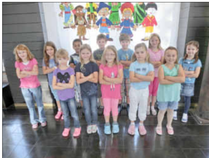
Stolz präsentieren sich die Vertreter der Schülerschaft beim ersten „Pressetermin“