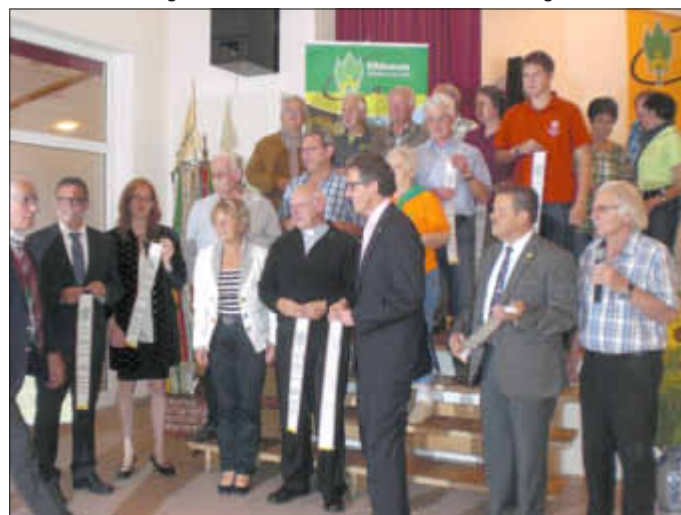
Überreichung der Wimpelbänder

2. Am 14. September fahren über 20 Wanderer nach Enzklosterle im Schwarzwald. Die Daheimgebliebenen wünschen viel Vergnügen, schöne Wanderungen und eine schöne Zeit im Schwarzwald.