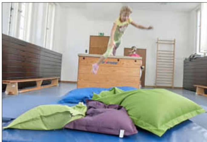
Fast so schön wie fliegen