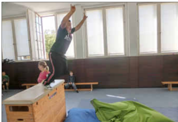
Vom Kasten springen verlangt viel Mut