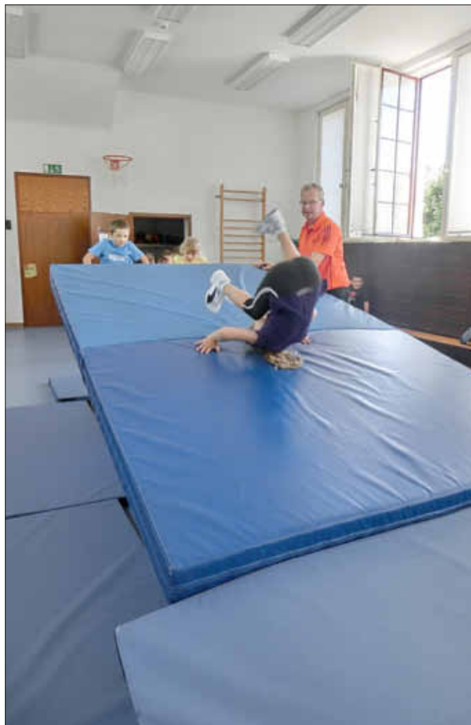
Die Aufgabe der ersten Bewegungsbaustelle: Rollen von einer steilen schiefen Ebene