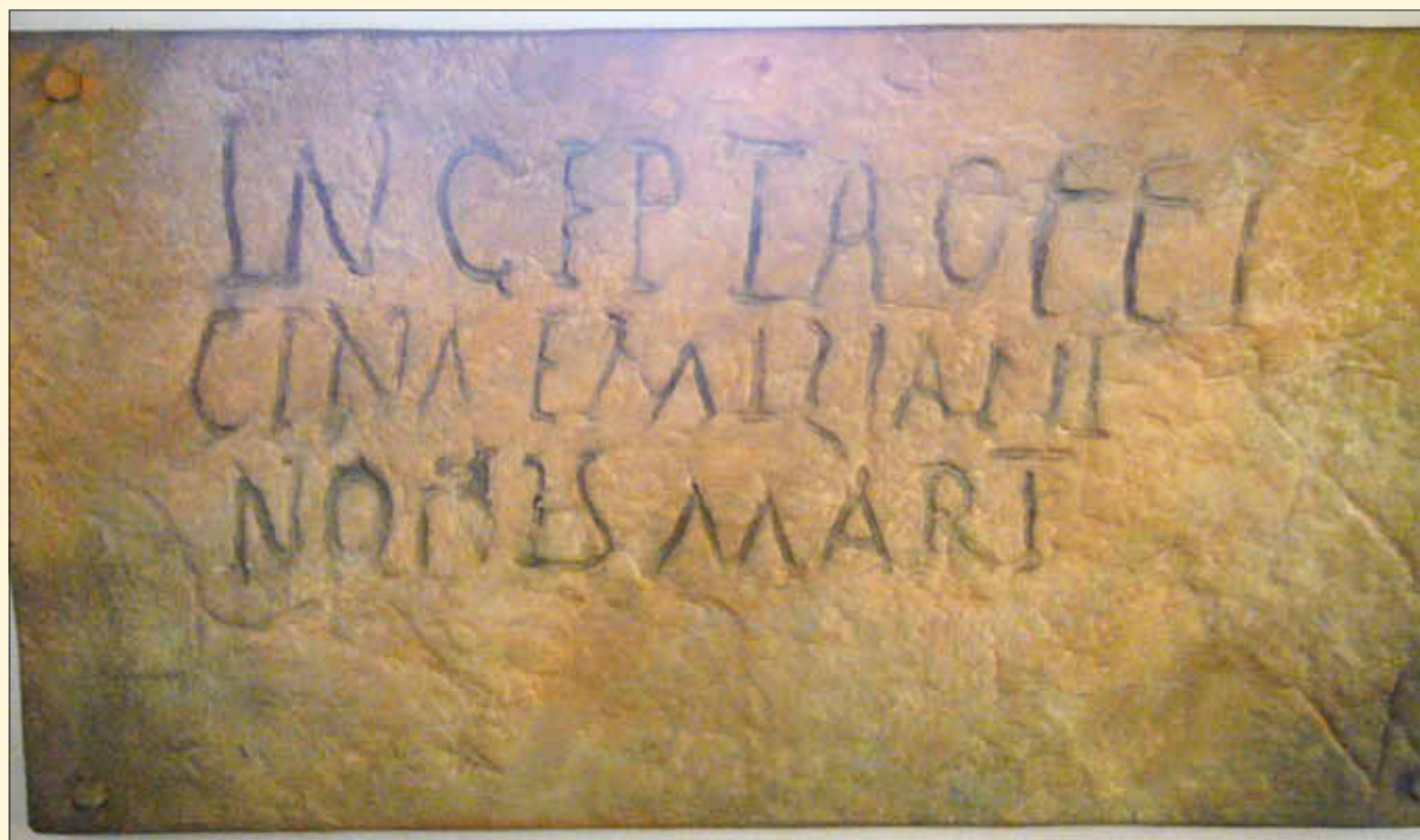
Inschrift am Emilianusstollen in St. Barbara. Hier: Kopie im Museum Wallerfangen