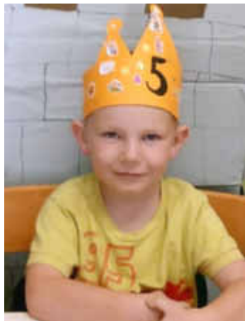
Die beliebte Krone...

Jedes Kind freut sich natürlich auf seinen bevorstehenden Geburtstag und die Tage davor können gar nicht schnell genug vorbeigehen. Schließlich ist dies ein ganz besonderer Tag, egal wie alt das Kind ist. Deshalb wird nicht nur zu Hause, sondern auch in der Kita gefeiert! Wir feiern den Geburtstag jedes Kindes und zeigen ihm damit auch, dass wir froh sind, dass es bei uns ist. Das Kind steht an seinem großen Tag im Mittelpunkt. Bereits beim Eintreffen in den Kindergarten wird es von den Erzieherinnen begrüßt und natürlich gratuliert man ihm.