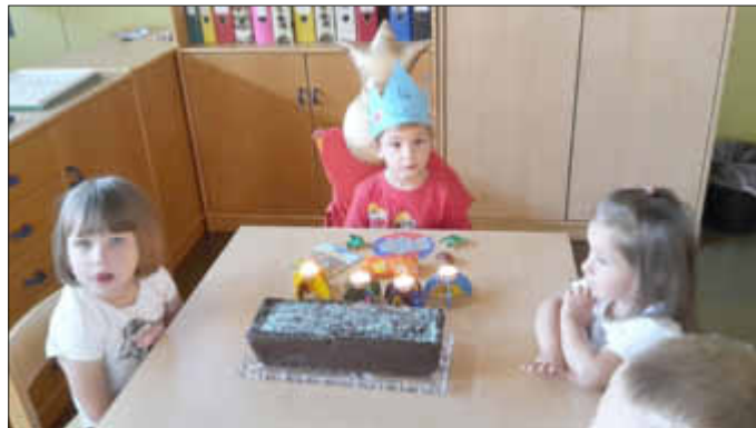
Der Kuchen wartet schon...

Es ist üblich, dass ein Kuchen für die Kinder aus der gleichen Gruppe mitgebracht wird. Dieser wird an alle aufgeteilt und verspeist und ist selbstverständlich seeeehr beliebt.