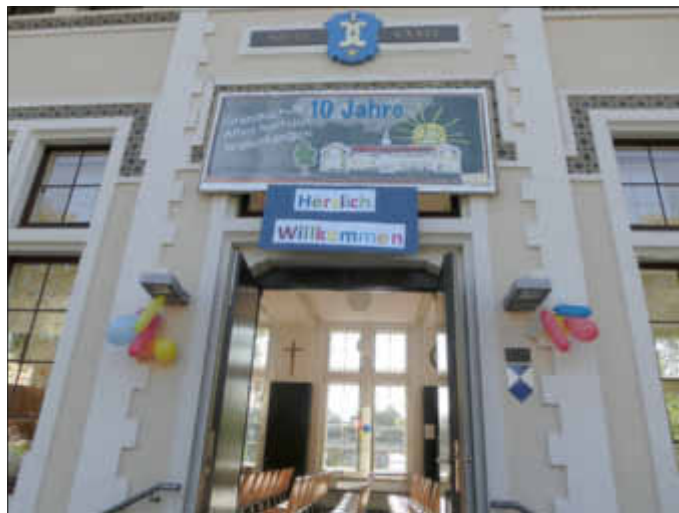
Die Schule hatte sich zur Begrüßung ihrer neuen Schüler festlich herausgeputzt

Wir wünschen unseren neuen ABC Schützen eine wunderschöne und erfolgreiche Grundschulzeit! hs