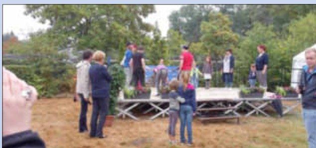
Unter den Augen der Ministerin und des Bürgermeisters eröffnet die Tanzgruppe des Gisinger Kindergartens das Fest