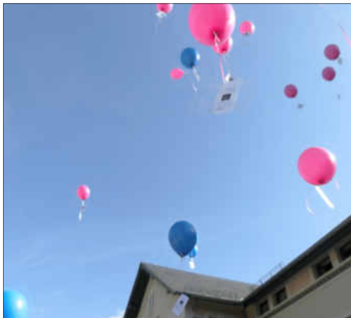
Als die 42 Luftballons, beladen mit den besten Wünschen für die ABC Schützen in den Himmel stiegen, symbolisierte dies für die Eltern auch den Prozess des Loslassens ihrer Kinder für einen neuen Lebensabschnitt. Während es manche Luftballons nur gerade bis in die Nachbargärten schafften, kam die weiteste Rückmeldung bisher aus Zweibrücken, immerhin ein Flug über 60 Kilometer.