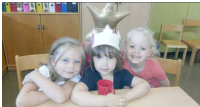
Geburtstagskind und Freundinnen

Dann darf es die (gebastelte) Geburtstagskrone aufsetzen, die stets gerne und mit Stolz getragen wird. Spätestens jetzt ist für jeden ersichtlich, dass das Kind Geburtstag hat und wieviel Jahre alt es geworden ist!