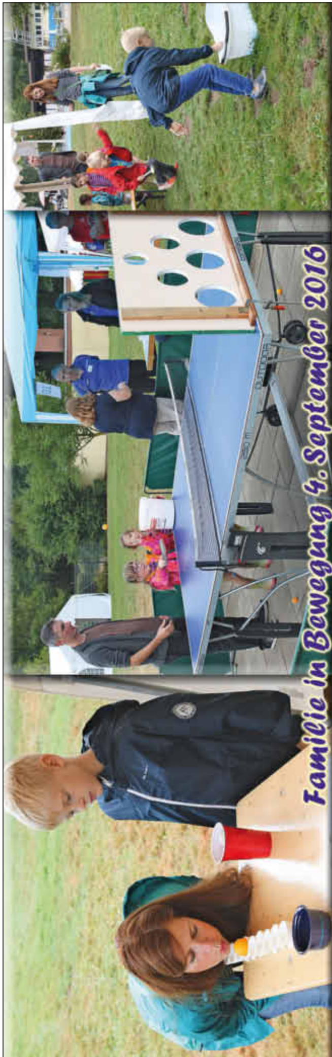
Familie in Bewegung 4. September 2016