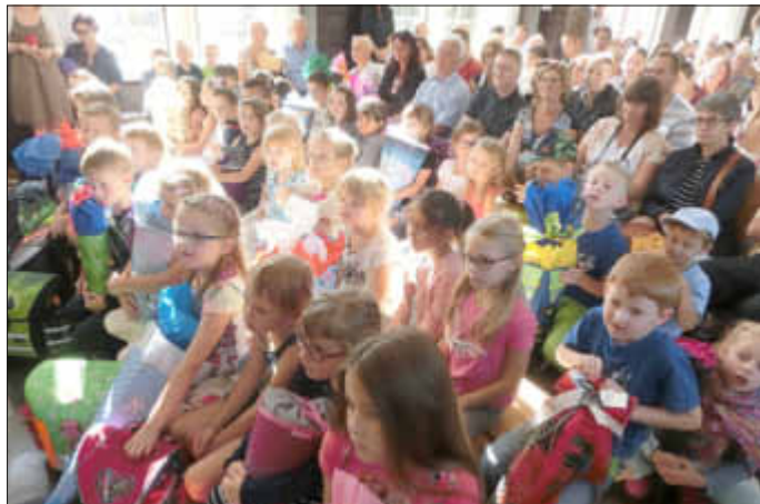
Wie auf glühenden Kohlen sitzend konnten die ABC Schüler ihren Start in das Schulleben kaum erwarten