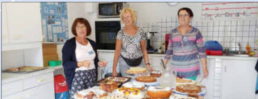
Das bewährte Kuchenteam präsentiert eine Auswahl der leckeren Kuchen