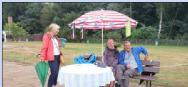
Gute Laune trotz Regenschauern