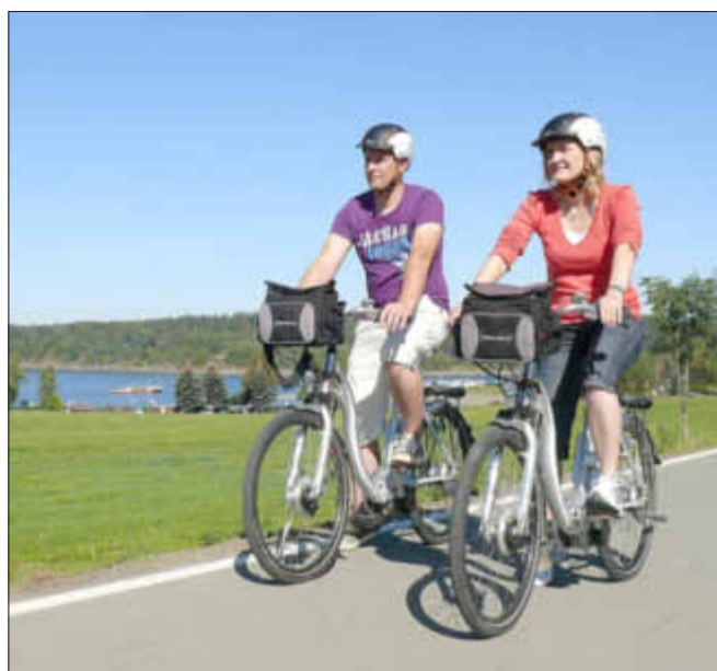
Radfahren ist auch ein gutes Gleichgewichtstraining

Es reicht eine moderate Intensität; wichtig ist allerdings das regelmäßige Training. Auch bei älteren Menschen wirkt körperliche Aktivität sich günstig auf Fitness und Wohlbefinden aus!