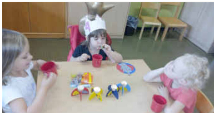
Geschenke sind ja soooo schön...

Anschließend bläst das Kind seine Kerzen aus und packt die Geschenke aus. Neben einem „Hauptgeschenk“ gibt es noch einige Kleinigkeiten dazu, wie z.B. Luftballon, eine kleine Spielfigur, eine Pfeife oder Ähnliches.