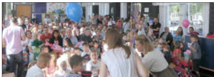
Von ihrer ersten Klassenlehrerin erhielten die Schulanfänger einen mit Gas gefüllten Luftballon, an dem sie ihre persönliche Karte befestigen mussten