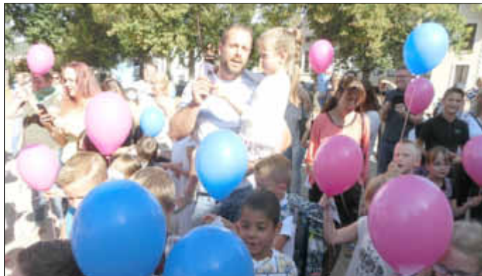
Alle warteten gespannt auf den Countdown zum gemeinsamen Start der Luftballons