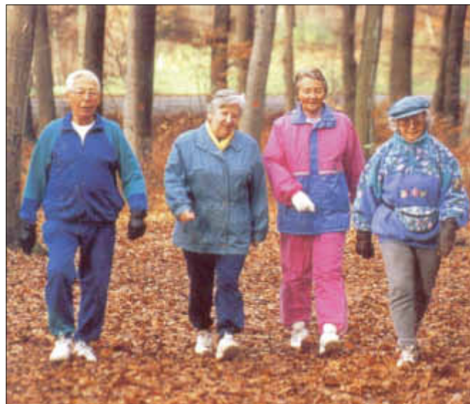
Gemeinsam macht Bewegung noch mehr Spaß

Geeignete Sportarten sind z.B. Fahrradfahren, Wandern oder Walken, Schwimmen und Ballspiele.