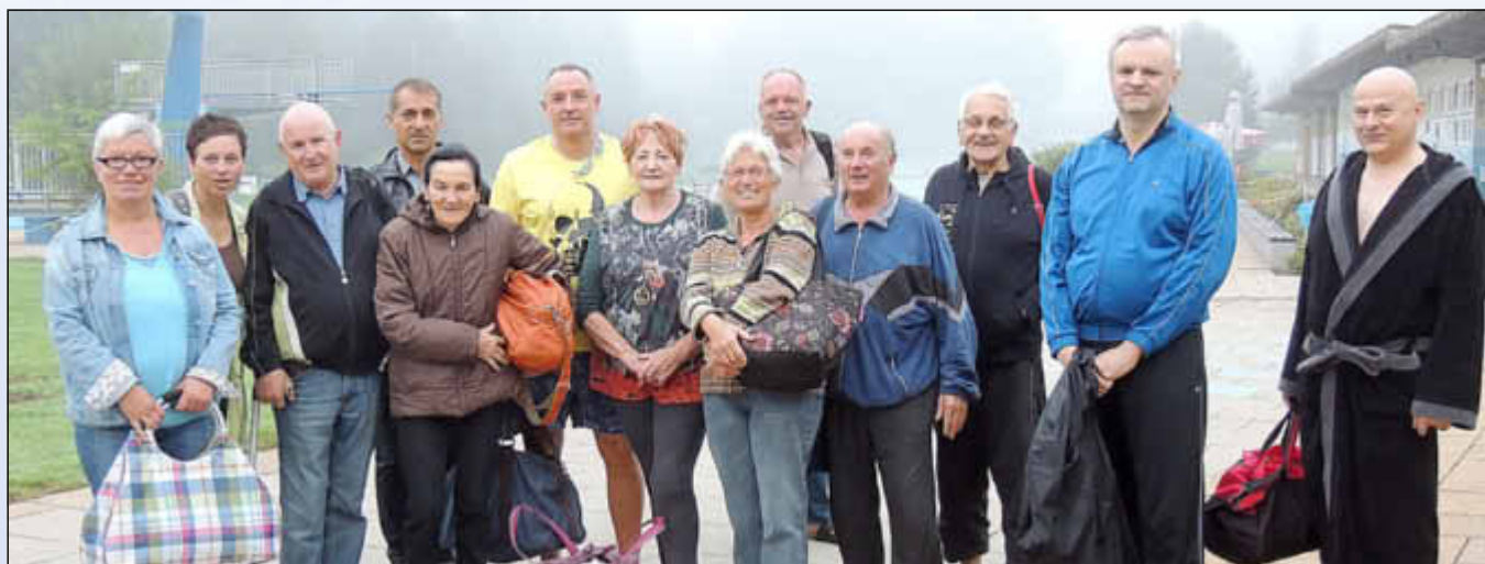
Fröhliche Gesichter auch bei schlechtem Wetter - die 7.00-Schicht

Während die Saarbrücker Zeitung kürzlich in ihrem Bericht unter der Überschrift „Nix für Warmduscher“ über die derzeitige Besucherflaute in den Freibädern berichtete, sieht man im Wallerfanger Freibad auch bei schlechtem Wetter fröhliche Gesichter.