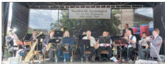
Fraulautern 24.08.2014 mit musikalischen Grüßen euer MV Nachtigallental Ihn

Nun ist der Sommer 2014 fast vorüber und der Musikverein Nachtigallental Ihn hat wieder zahlreiche Auftritte bestritten. Welcher Sommer? Wird so manch einer fragen, denn die Sonne hat die meisten Veranstalter dieses Jahr im Stich gelassen. So standen Musiker, Gäste und Veranstalter in Gisingen (01.05.), Hostenbach (06.07.) und Leidingen (10.08.) im wahrsten Sinne des Wortes im Regen. Trotzdem so hoffen wir, haben wir Musiker in altbewährter Weise gute Stimmung verbreiten. Unsere Freunde in Fraulautern hatten da etwas mehr Glück. Bei allen 3 Terminen in Saarlouis-Fraulautern (Kirmes 16.6.; Bergmannsfest 29.6.; Pfarrfest 24.8.) lachte die Sonne vom Himmel. Und natürlich sollen auch die Auftritte in Gerlfangen (06.07.) und Niedaltdorf (30.08.) noch kurz Erwähnung finden. An dieser Stelle nochmal ein ganz großes Dankeschön an unser Publikum, das egal wann, wo und unter welchen Bedingungen wir aufspielen uns jedesmal mit seinem Applaus so herzlich willkommen heißt. Wir freuen uns, Euch auch im Herbst weiter unterhalten zu dürfen und laden ganz herzlich zur Ihner Kirmes am 20.-21.09.2014 nach Ihn ein.