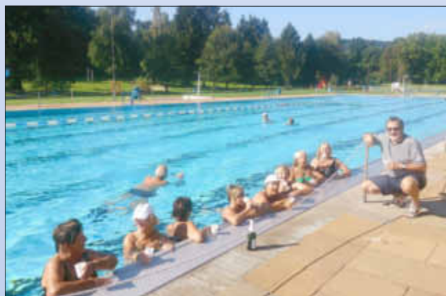
So lässt sich ein Freibadbesuch in Wallerfangen genießen!