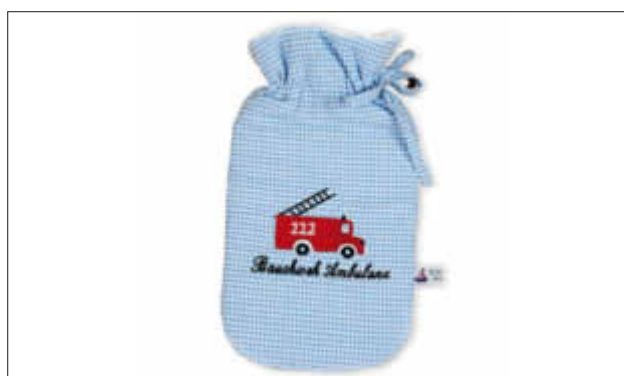
Manchmal hilft eine solche Bauchwehambulanz