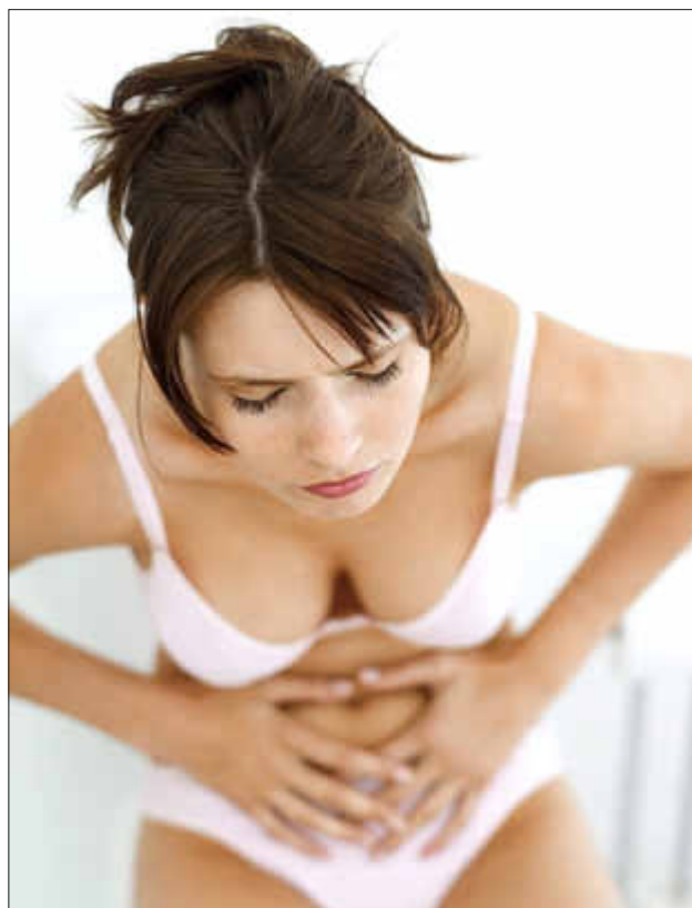
Bauchschmerzen können sehr quälend sein

Nahrungsmittelunverträglichkeiten sind ein sehr komplexes Thema und sollen in einem späteren Artikel abgehandelt werden.