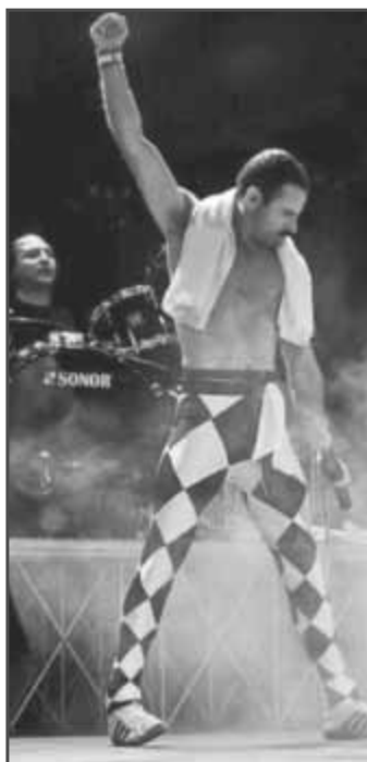
Hier wird ein Stück Musikgeschichte wieder lebendig

D as sensationelle Tribute an die Adligen des Rock!