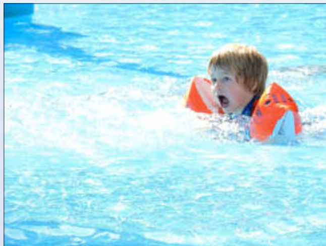
Mit Schwimmflügeln ist das Planschen sicher und macht Spaß

Leider kann fast ein Drittel aller Kinder unter 14 Jahre nicht schwimmen!