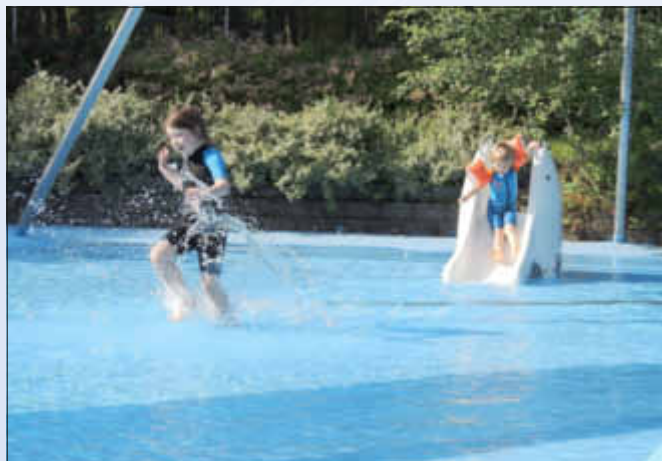
Im Planschbecken können Kinder sich gut an das Wasser gewöhnen

Schwimmen ist ein idealer Ganzkörpersport. Fast die komplette Muskulatur ist beim Schwimmen im Einsatz. Die Belastung für den Körper ist dabei äußerst gering, sodass das Schwimmen ausgesprochen gelenkschonend ist.