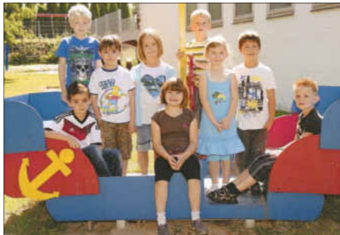
Auf dem Foto fehlt ein Junge.

Insgesamt verlassen 10 Kinder unseren Kindergarten.