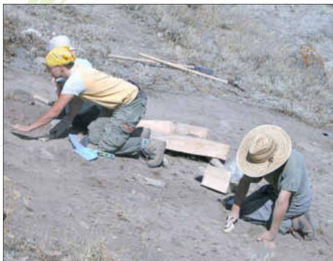
Immer sinnvoll: Kopfbedeckung bei längerem Aufenthalt in der Sonne

Aber es gibt auch noch andere gesundheitliche Probleme durch Sonne und Wärme, nämlich Sonnenstich, Hitzekollaps, Hitzeerschöpfung und Hitzschlag.