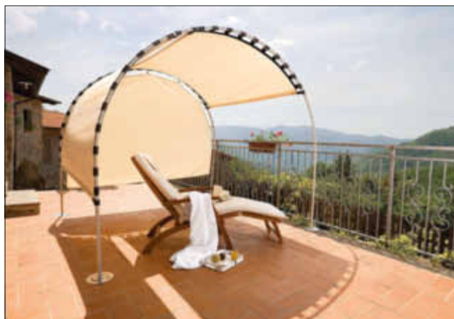
Auch im Schatten lässt sich der Sommer genießen

Bei schweren Verläufen sollte unbedingt ein Arzt hinzugezogen werden!