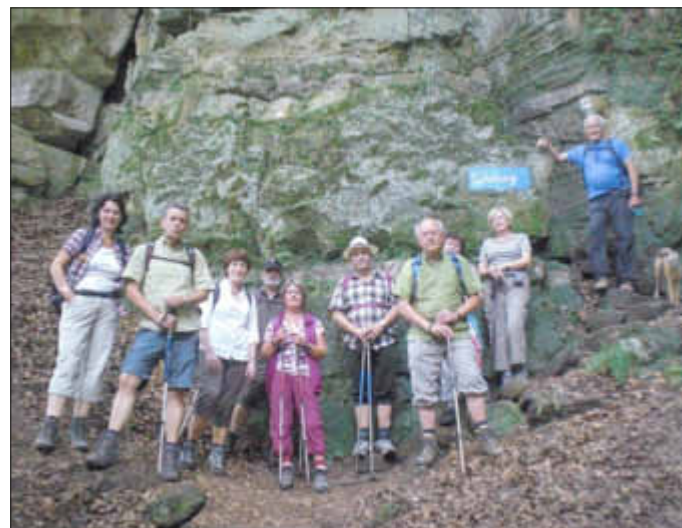
Im Müllerthal vor der Eulenburg

Keiner hat Schlapp gemacht, alle haben bis zum Ende toll durchgehalten. Im nächsten Jahr werden wir den Wanderweg E1 gehen, der nach Aussagen der Touristik-Information Luxemburg, der schönste Weg in der Region sein soll.