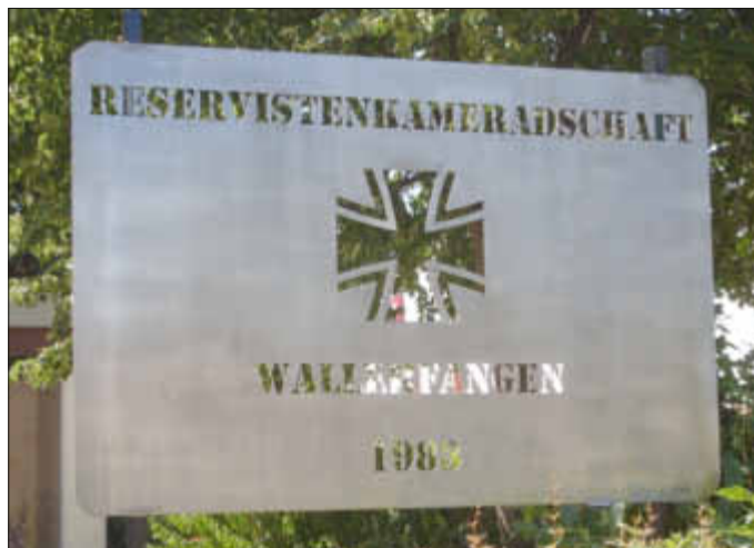
unser neues Schild am RK Heim