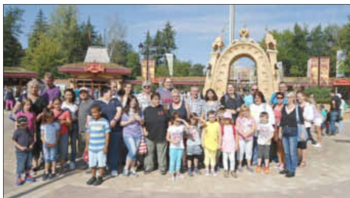
De Schnokenschießer und die Regenbogenkids im Holiday Park

Unser Tagesausflug mit den Kindern unserer Tanzgruppe war einfach super. Bei sehr schönem Wetter hatten wir einen tollen Aufenthalt im Holiday Park und viel Spaß.