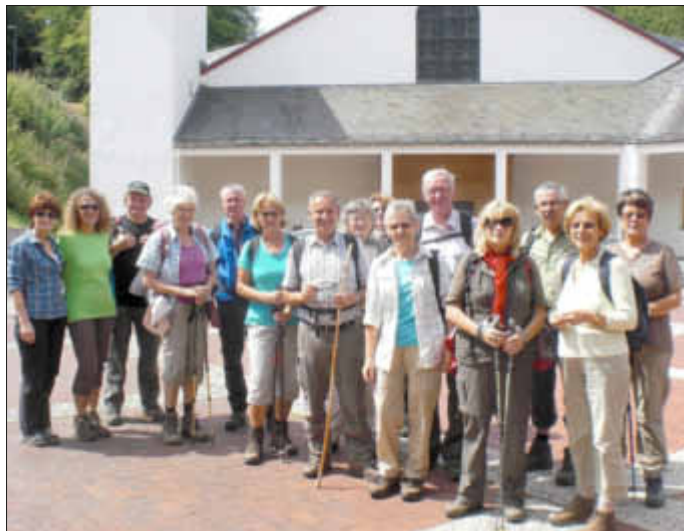
Am Kloster Maria Martaler bei Ulmen

Aber nach weiteren 4 km erreichten wir die Weißmühle, die stolz dastand und mit ebensolchen Preisen aufwartete. Bis nach Cochem waren es dann nur noch wenige Kilometer. Auf der Rückreise im Zug konnte man sich gemütlich über die sehr schöne Wanderung unterhalten.