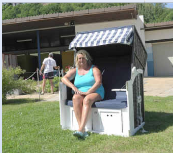
Vom Förderverein finanziert: 2 Strandkörbe