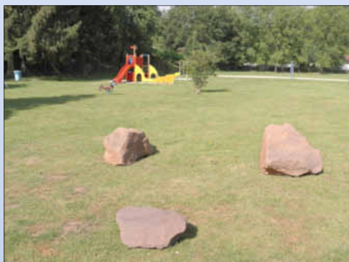
Findlinge auf der Freibadwiese