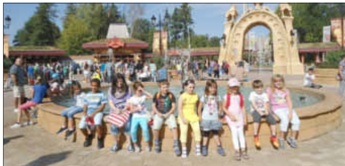
Die „Regenbogenkids“ am Brunnen im Eingangsbereich vor dem Holiday Park