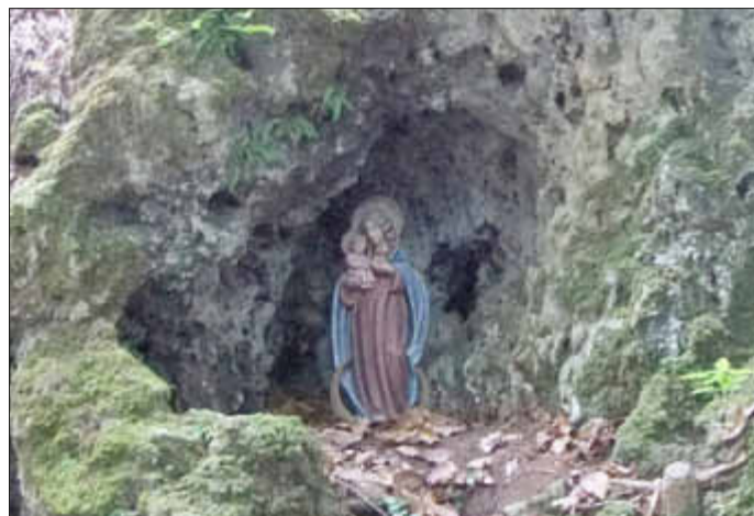
Muttergottes-Statue in der „Grott“