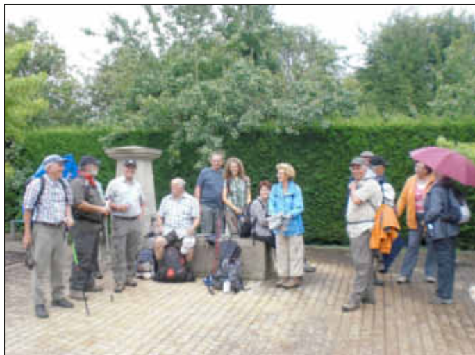
Am Brunnen in Brettnach