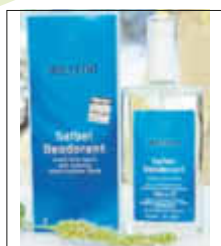
Salbeideo - pflanzliche Alternative

Für leichte bis mittelschwere Ausprägung erhält man in der Apotheke Desodorantien mit desinfizierenden Eigenschaften (z. B. Widmer Deo ohne Aluminiumsalze mit Octenidin und Silber) oder auch schweißstoppende Mittel mit Aluminiumchlorid , sogenannte Antitranspirantien, die aufgrund ihrer adstringierenden Wirkung die Schweißdrüsen verengen. Letztere dürfen nur auf vollkommen intakter Haut angewandt werden. (z.B. Odaban, Yerka).