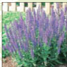
Salbei - in verschiedenen Formen wirksam gegen Schwitzen

Nach pharmazeutischen Gesichtspunkten kann man dem Schwitzen auf verschiedene Arten begegnen. Grundsätzlich richtet sich die Behandlung nach der Grunderkrankung, dem Schweregrad der Schweißabsonderung und danach, wie sehr sie den Alltag belastet.