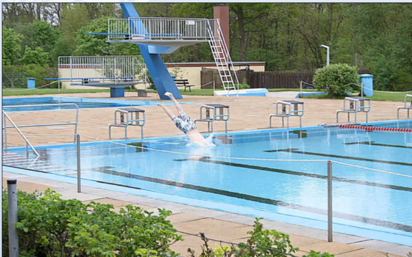
Optimale Bedingungen für alle Schwimmsportler

ligkeit und Koordination. Im Bereich Ausdauer kann man alternativ zu beispielsweise 20 km Radfahren oder einem 3000-Meter-Lauf eine längere Strecke schwimmen (je nach Alter 200, 400 oder 800m). Im Bereich Schnelligkeit gibt es neben einem Kurzstreckenlauf oder einem Radsprint auch die Möglichkeit, 25 m zu schwimmen.