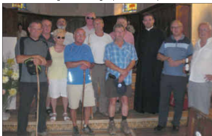
In der Kirche in Remélfang 2012

2. Die 61. Pilgerwanderung von Wallerfangen nach Rémelfang ist am Sonntag, dem 18. August 2013. Die Wanderer treffen sich um 8.00 Uhr am Friedhof Wallerfangen, Kirchhofstraße. Die Strecke hat eine Länge von 24 km. Mittagsrast aus dem Rucksack ist wie immer in Oberdorff. Die Rückkehr erfolgt mit Fahrzeugen (Bus oder PKW).