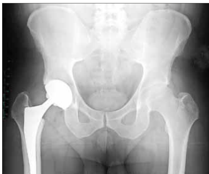
Behandlung der Hüftarthrose mit Prothese