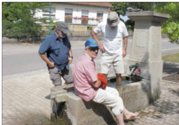
Pilgerwanderung nach Remélfang 2012