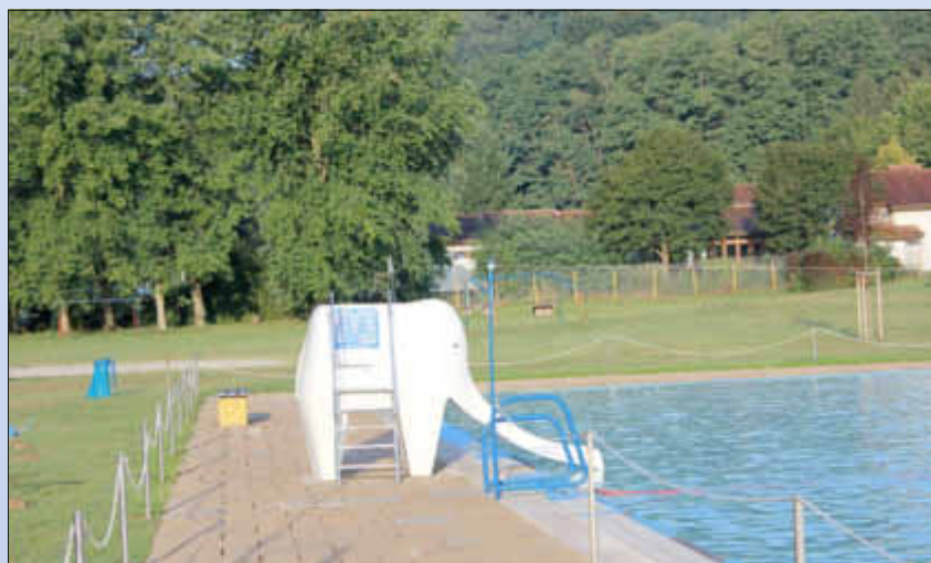
.. und die Elefantenrutsche

In diesem Jahr hat der Förderverein u.a. 2 Strandkörbe für das Freibad angeschafft.