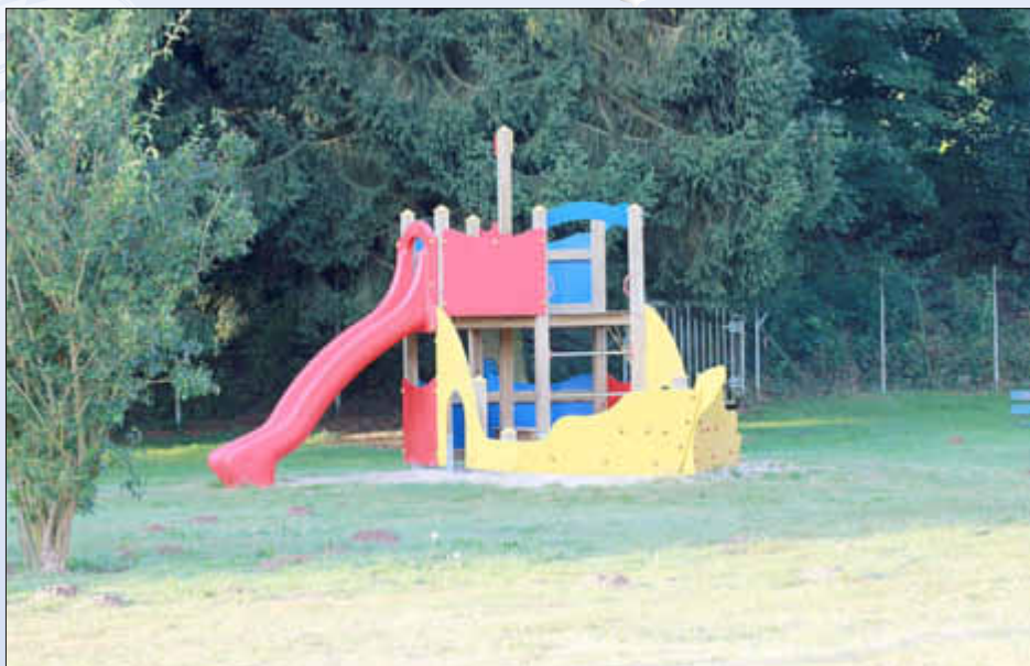
Mit Unterstützung des Förderverein angeschafft: das Piratenschiff

Außerdem beteiligt der Förderverein sich an den Unterhaltungskosten der Dampfsauna.