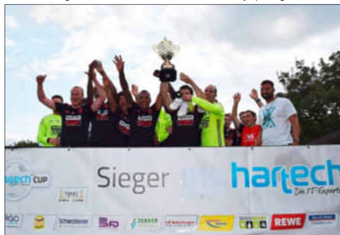
Die Siegermannschaft Hamm Benfica