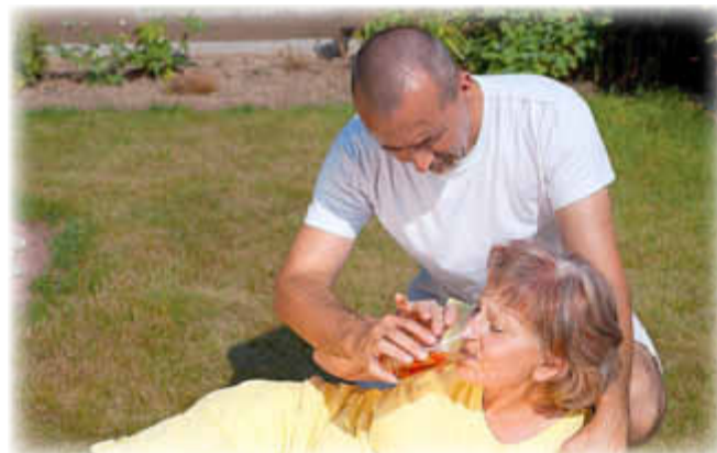
Wichtig beim Hitzschlag: kühle Getränke

Die Symptome einer Hitzeerschöpfung sind Kopfschmerzen, Schwindel, Übelkeit, Bewusstseinsstörungen bis hin zur Bewusstlosigkeit. Die Haut ist zuerst gerötet, dann blass und feucht. Der Puls ist schnell, der Blutdruck niedrig, die Atmung schnell und flach.