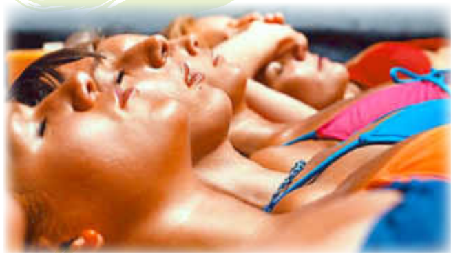
Den Damen droht ein Sonnenstich

Aber es gibt auch noch andere gesundheitliche Probleme durch Sonne und Wärme, nämlich Sonnenstich, Hitzekollaps, Hitzeerschöpfung und Hitzschlag.