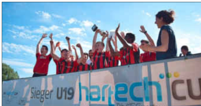
Die Siegermannschaft VfR Mannheim U19