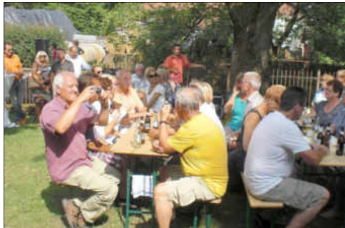
Einweihung der Wanderhütte