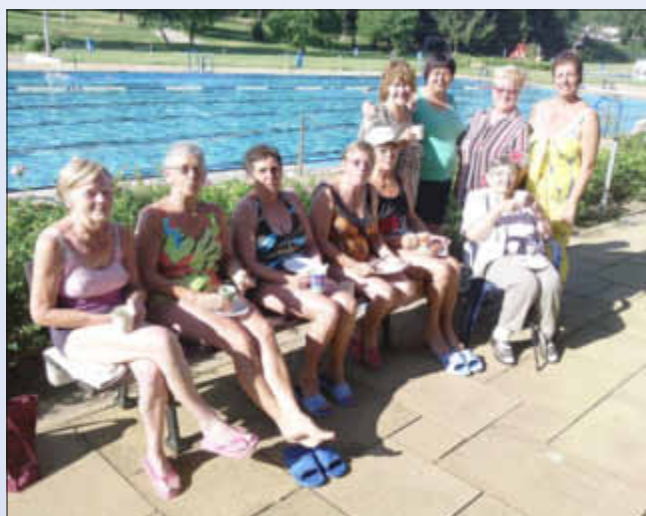
Fröhliche Gesichter nach dem Schwimmen oder Aqua-Jogging

Seit Saisonbeginn zieht das Wallerfanger Freibad täglich zahlreiche Besucher an. Egal ob die Sonne vom Himmel lacht oder ob es regnet: das Wallerfanger Freibad kann täglich etliche Badegäste verzeichnen.