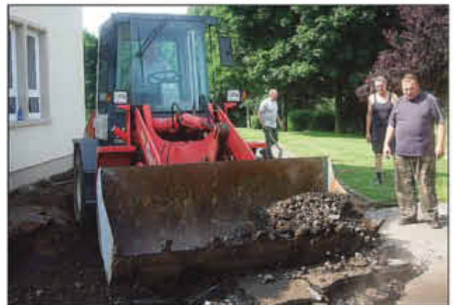
Bilder unten: Maurerarbeiten bei hohen Temperaturen (Samstag 27. Juli 2013)