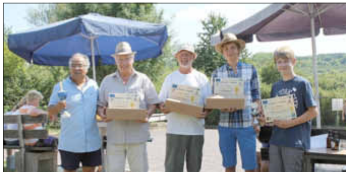
Siegerehrung Bouleturnier Gisingen

am Sonntag, 21.07.2013 fand im Rahmen des Interreg-Mikroprojekts „10 Jahre Dorffreundschaft Gisingen-Mey“ ein gemeinsames Bouleturnier statt. Trotz sengender Hitze fanden sich etliche enthusiastische Boulespieler aus Gisingen, Mey und Umgebung ein. Für das leibliche Wohl sorgten der Bouleclub und der Förderverein Bewahren und Erneuern Gisingen. An dieser Stelle auch ein herzliches Dankeschön an alle Kuchenspender, die damit den Förderverein sowohl an der Kirmes als auch am Bouleturnier unterstützt haben. Die Preise, die am Ende des Turniers an die Sieger überreicht wurden (Saargau Kisten), konnten durch das Interreg-Mikroprojekt finanziert werden. Alles in allem ein gelungener Tag. Mehr Fotos von dem Turnier finden Sie auf unserer Internetseite www.gisingen.de .