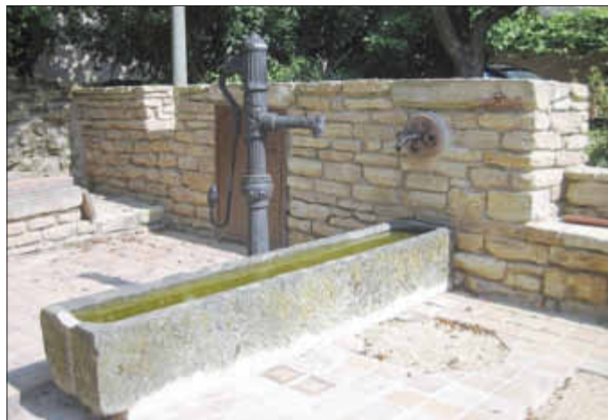
Am 17./18.08.2013 wird wieder am Brunnen gefeiert.

Am 17./18. August 2013 veranstaltet die AH Scheidberg das traditionelle »Kerlinger Brunnenfest« am Brunnenplatz im Bereich der unteren Jakobusstraße. Weitere Informationen im nächsten Amtsblatt.