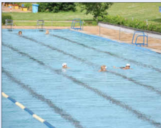
Im Wasser geht es einem richtig gut