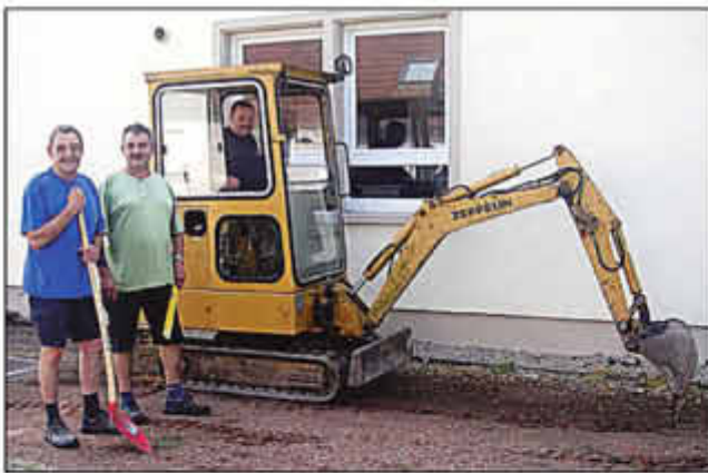
Der "Erste Spatenstich" am 13 Juli 2013