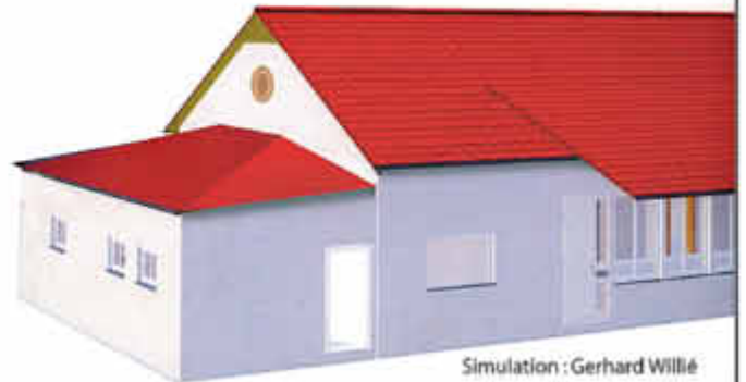
Simulation : Gerhard Willié

Nach dem Ortsratsbeschluss und der Zustimmung durch den Gemeinderat nimmt die Erweiterung des DGH Ihn jetzt konkrete Formen an. Wichtiges Ziel ist die kostengünstige Fertigung in Eigenleistung durch die Ihner Vereine. Die Toilettenanlage ist zur Zeit im Bau. Unter der kompetenten Bauleitung von Gerd Colbus, unterstützt von eifrigen Helfern, wurde am Samstag, nach den Fundamentarbeiten, die ersten Lagen Steine vermauert. Vielen Dank an alle Helfer und für die „moralische“ Förderung dieses Bauvorhabens durch die Ihner Bevölkerung.