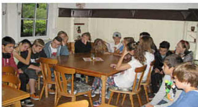
Tränen beim Abschied