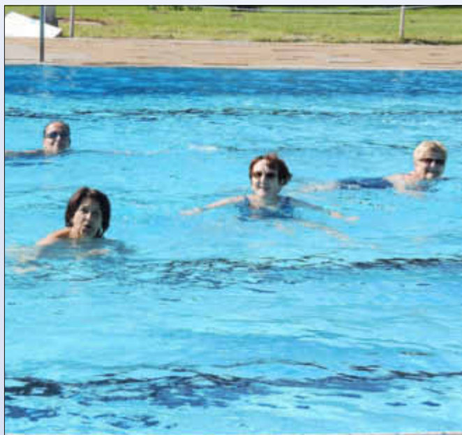
Erfahrene Aquajogger im Freibad Wallerfangen