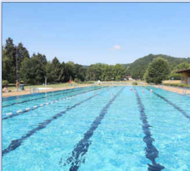
Das Wallerfanger Freibad - für Aquafitness besens geeignet

Neben Schwimmen, Springen und Tauchen lassen sich im Schwimmbad noch diverse andere Sportarten ausüben. Besonders interessant für viele Menschen sind Bewegungsformen im Wasser, die unter dem Begriff „Aquafitness“ zusammengefasst werden können: die klassische Wassergymnastik, Aquajogging und Aquacycling.