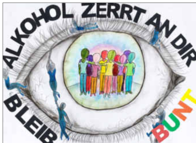
Das Siegerbild der Kampagne

Das Bild der Landessiegerinnen zeigt ein großes Auge mit der Botschaft „Alkohol zert an Dir – bleib bunt“. Die regenbogenfarbene Iris des Auges zeigt bunte Menschen die zusammenstehen. An den Wimpern hängen blaue Männchen. Sie sollen den Alkohol symbolisieren. „Wir haben das Auge als Symbol gewählt, da man den Menschen an der Mimik und den Augen ansieht wie es ihnen geht“, beschreiben die Siegerinnen ihr gelungenes Plakat. Es sei viel besser auf Alkohol zu verzichten und mit Freunden oder der Familie über seine Sorgen zu reden.