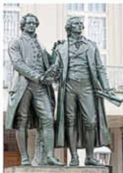
Schüler aus Bochnia in Polen