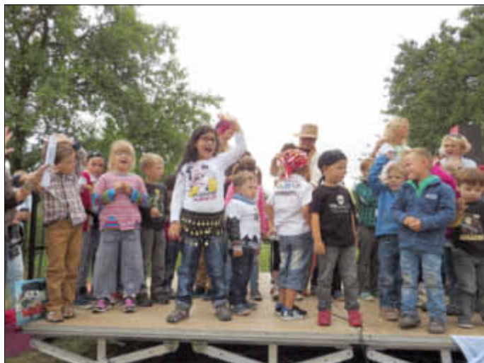
Zum Abschluss verabschiedeten sich alle Kinder auf der Bühne.