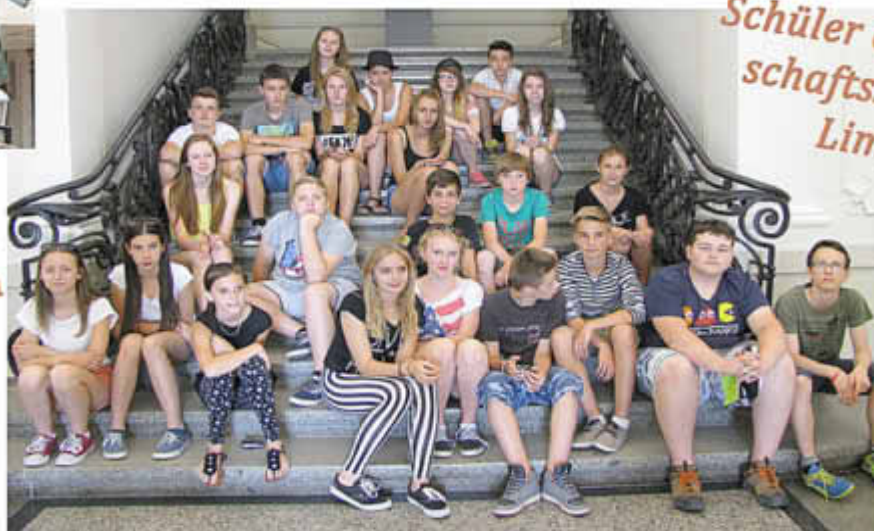
Schüler der Gemein- schaftsschule am Limberg