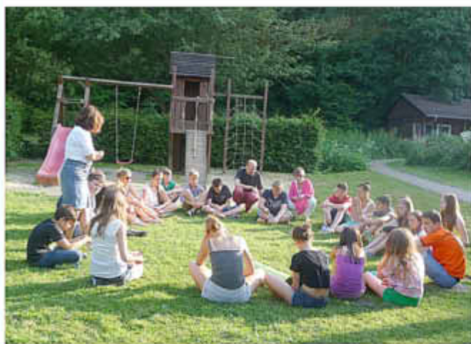
Ankommen und Kennenlernen