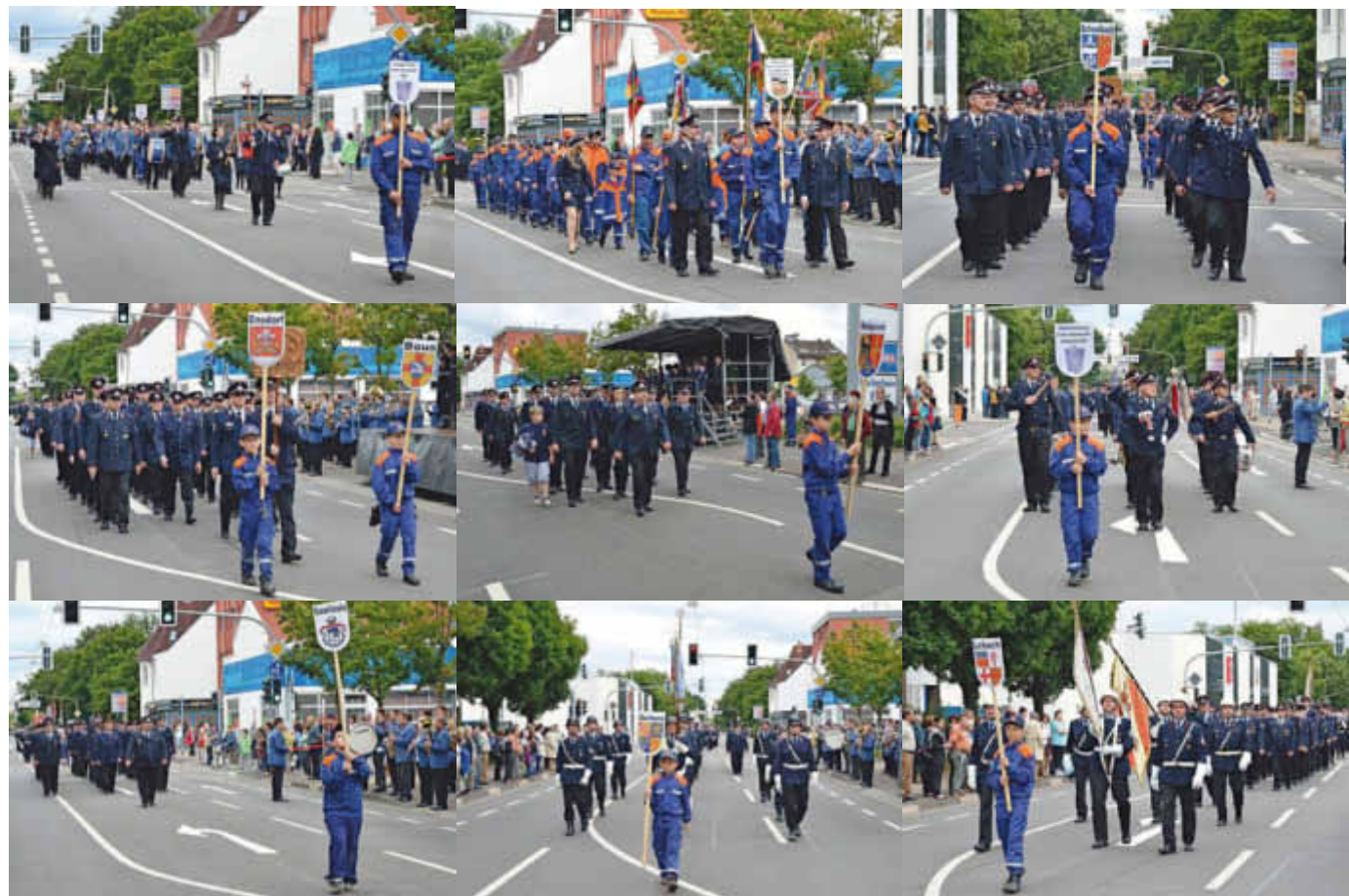
Teilnehmer des Festzuges beim Kreisfeuerwehrtag 2014 in Dillingen