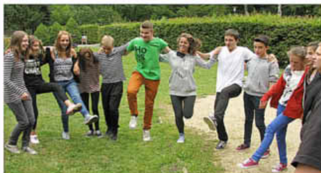
Spiel und Spaß miteinander