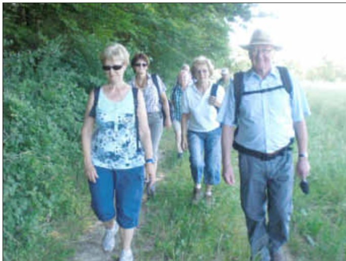
Auf dem Perler Panoramaweg

2. Trotz der sehr sommerlichen Temperaturen konnte der Perler Panoramaweg ohne Probleme erwandert werden. Die 8 sonnenhungrigen Saarwäldler konnten die schönen Aussichten des Weges, auch aufgrund des kühlenden Windes, genießen. Schlussrast war im Brauhaus in Merzig.