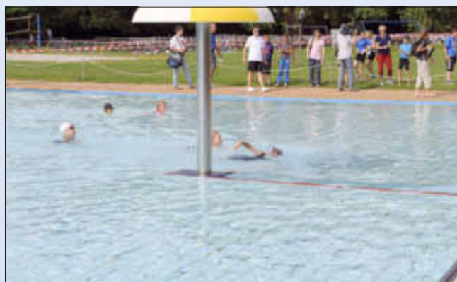
Die Schüler nutzen seit Jahren das Wallerfanger Freibad für ihren Triathlon-Wettkampf

Für das »neue« Sportabzeichen müssen vier Disziplinen absolviert werden, und zwar je 1 Disziplin aus den Bereichen Ausdauer, Kraft, Schnelligkeit und Koordination.