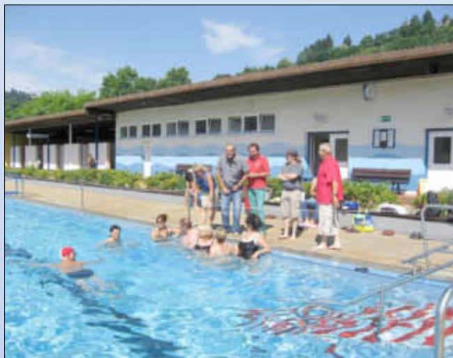
Die Wallerfanger SPD hat letztes Jahr schon mal trainiert

Immer mehr Menschen legen die Prüfungen für das Deutsche Sportabzeichen ab; viele schon zum wiederholten Male. Seit diesem Jahr sind die Bedingungen für das Sportabzeichen geändert.