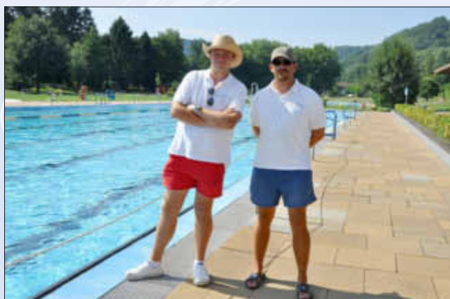
Der Schwimmmeister ist bereit, Schwimmprüfungen abzunehmen; der Azubi unterstützt dabei

Immer mehr Menschen legen die Prüfungen für das Deutsche Sportabzeichen ab; viele schon zum wiederholten Male. Seit diesem Jahr sind die Bedingungen für das Sportabzeichen geändert.