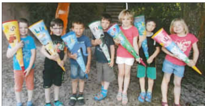
Meine eigene einzigartige Schultüte!!

So arbeiteten die Kinder fleißig an ihren Schultüten, damit sie schnell fertig waren und mit nach Hause genommen werden konnten. Und dort wurden sie natürlich stolz und voller Freude den Eltern präsentiert!