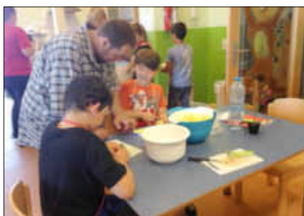
Auch Väter helfen mit bei der Vorbereitung