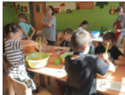
An allen Tischen wird eifrig gearbeitet