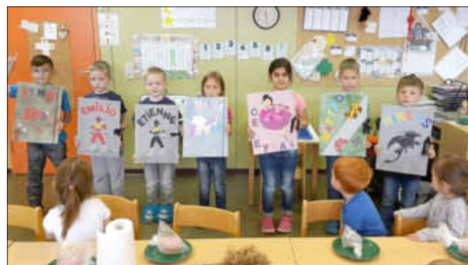
Diese Sammelmappen werden sicher nicht verwechselt...

dort können sie diese gut gebrauchen, um Bilder und Ähnliches darin aufzubewahren.