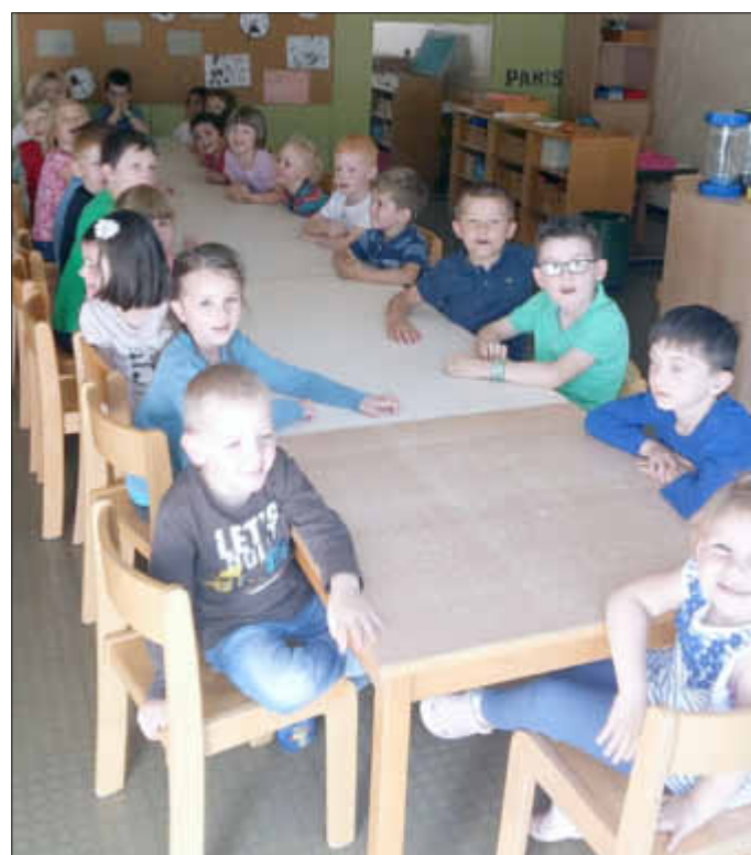
Gleich sehen wir die Musikgruppe...

Als Überraschung für die angehenden Schulkinder gestalteten die Erzieherinnen DIN A 3-Mappen mit den gleichen Motiven wie auf ihrer Schultüte. Die Mappen erhielten sie dann als Geschenk für die Schule, denn