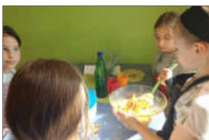
Der Nudelsalat wird gemischt