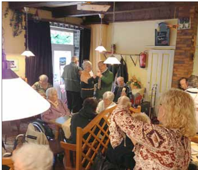
Senioren bei guter Stimmung

Die Senioren hatten viel Spaß und die Mitglieder der Templerkomturei Saarlouis - St. Oranna versprachen ihren Gästen, wie jedes Jahr auch im nächsten, wieder einen schönen Tagesausflug zu organisieren und sie dazu einzuladen.