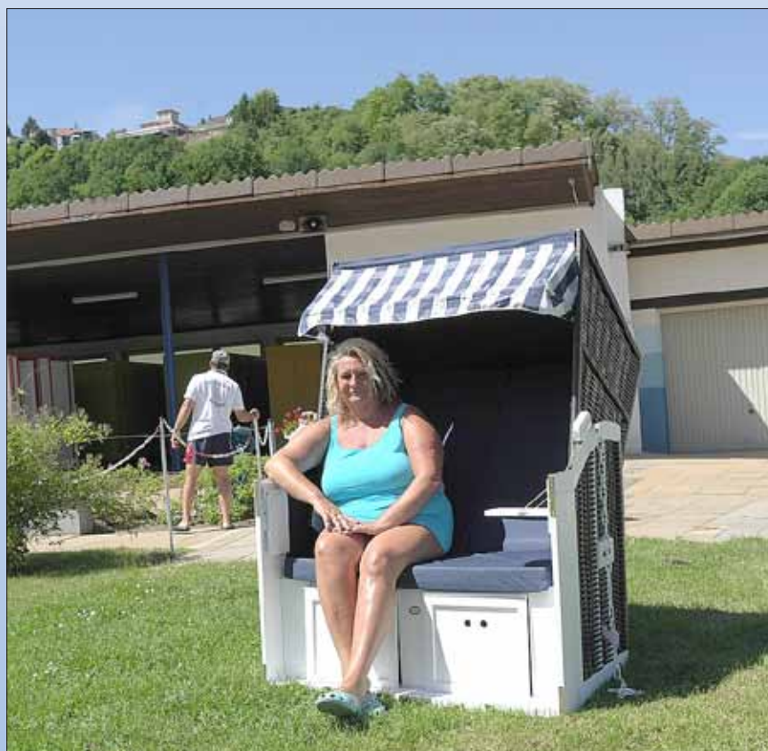
Diesjährige Anschaffung des Fördervereins: 2 Strandkörbe