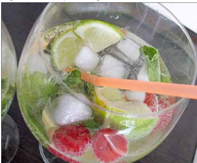
Sehr zu empfehlen: viel trinken, leichte Kost

Egal ob Arbeit, z.B. im Garten, oder Sport: Sonne und Wärme tun gut, können aber auch zu erheblichen Problemen führen. Da ist zum einen der Sonnenbrand zu nennen, dem man mit Sonnenschutzmitteln und geeigneter Kleidung vorbeugen kann. Aber es gibt auch noch andere gesundheitliche Probleme durch Sonne und Wärme, nämlich Sonnenstich, Hitzekollaps, Hitzeerschöpfung und Hitzschlag. Der Sonnenstich entsteht durch lange andauernde direkte Sonneneinstrahlung auf Kopf und Nacken. Dadurch kommt es zu einer Irritation der Hirnhaut und des Hirngewebes. Der Sonnenstich äußert sich durch Schwindel, Kopfschmerzen, Übelkeit bis zum Erbrechen, Ohrgeräusche, Benommenheit, innere Unruhe, Abgeschlagenheit, erhöhten Pulsschlag, und Nackenschmerzen bis hin zu Nackensteifigkeit. Die Körpertemperatur ist fast immer normal. Bei schweren Verläufen kann es zu Bewusstlosigkeit und zu Kreislaufversagen führen. Auch Todesfälle wurden bereits beschrieben.