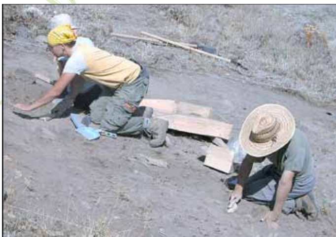
Möglichst nie ohne Kopfbedeckung in die Sonne