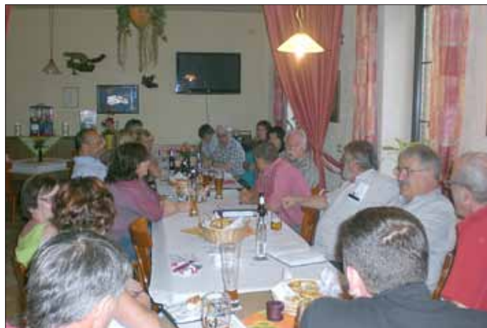
Regionalbezirks-Sitzung in St.Barbara