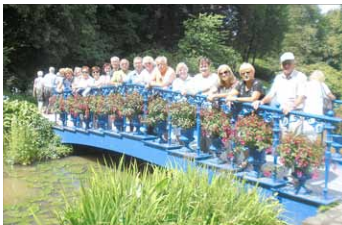
Gablenzfahrer im Bad Muskauer Park auf der Blauen Brücke

2. Die Wanderer aus dem Osten Deutschlands sind auch wieder gut gelandet. Hier ist ein Bild von der »Blauen Brücke« im Weltkulturerbe »Bad Muskauer Park« zu sehen.