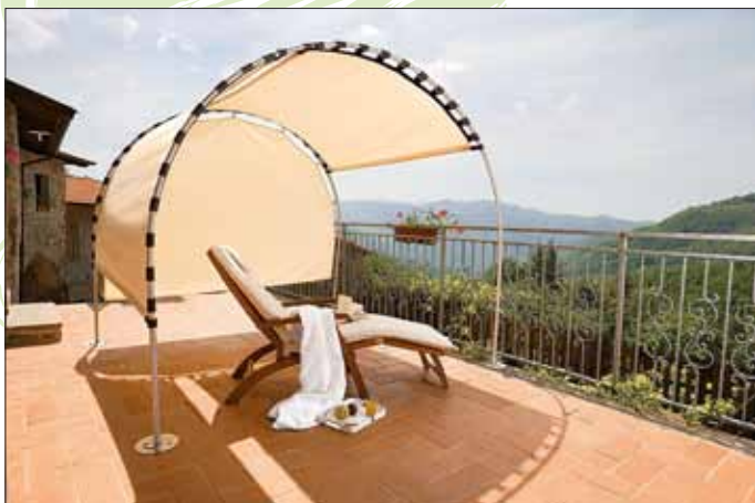
Generell zu empfehlen: Sonnenschutz