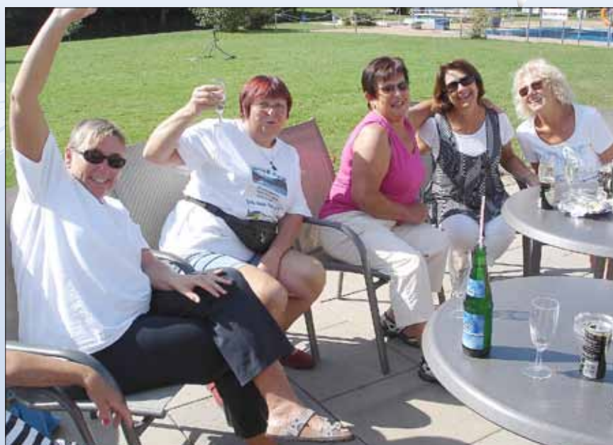
So fröhlich macht tägliches Schwimmen

Sind Sie schon Mitglied im Förderverein? Wenn nicht, finden Sie hier die Beitrittserklärung.