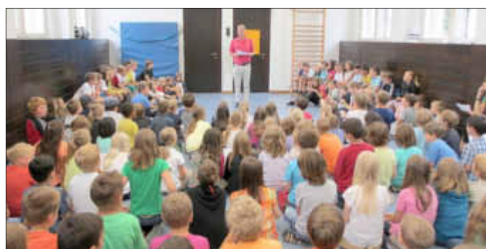
Gespannt lauschten alle Schüler der Schule, besonders aber die scheidenden Viertklässler (vorne links und rechts) den Abschiedsworten vom Schulleiter