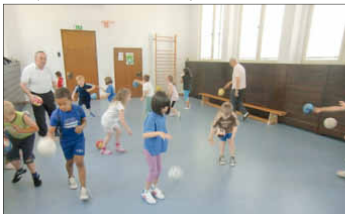
und die Umsetzung in Eigenregie