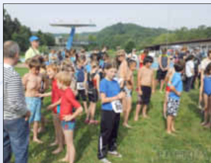
Vor dem Start