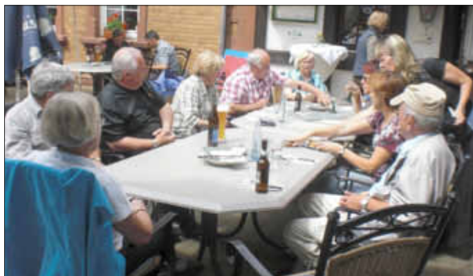
Schlussrast beim Hannejuschtweg Teil 1

2. Die nächste Seniorenwanderung mit Wanderführer findet um 14.30 Uhr am Mittwoch, dem 10. Juli 2013, statt.