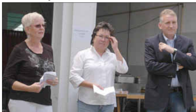
Festansprachen beim Gisinger Dorffest