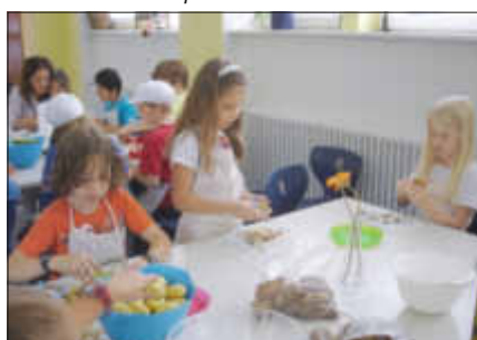
Die eifrigen Kartoffelschäler