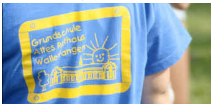
Vergesst uns nicht! „Altes Rathaus“ forever!