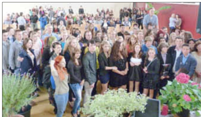
Die erfolgreichen Absolventen des Abschlussjahrgangs 2013

Mit musikalischen Glanzlichtern der Schulband fand die Abschlussfeier bei einem Umtrunk mit kleinem Imbiss einen schönen Ausklang.