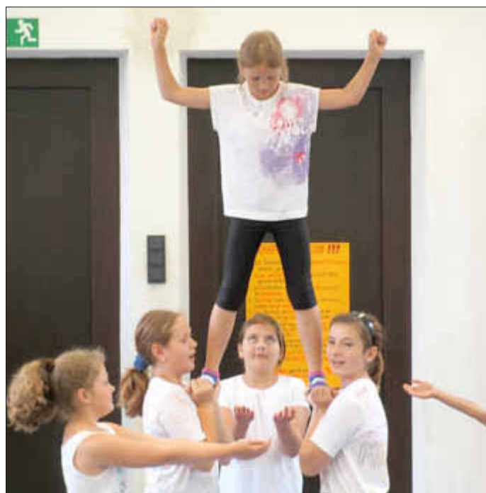
Die Tanzakrobatiknummer wurde eigens für diese Veranstaltung von den Schülerinnen selbst eingeübt- einfach spitze!