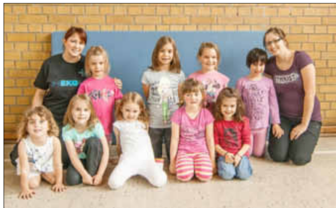
die Hansenberger Tanzbeerchen