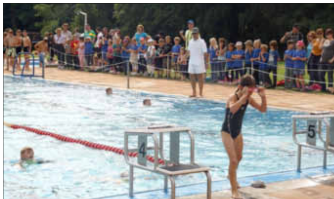
Die ganze Schule (siehe Beckenrand) war zur stimmungsgewaltigen Unterstützung „angereist“