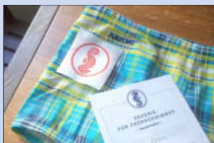
Bei Kindern sehr begehrt: das Seepferdchen-Abzeichen