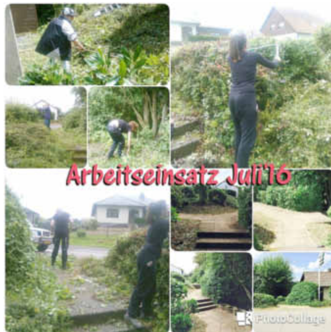
Arbeitseinsatz am Clubhaus