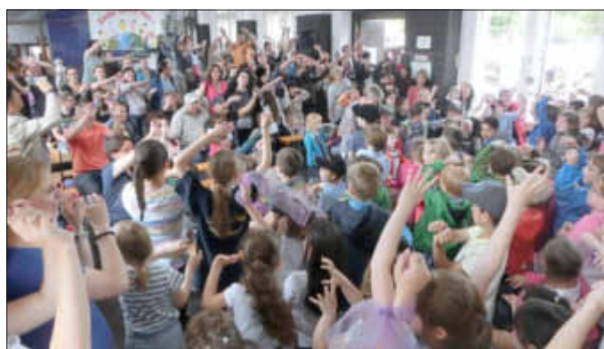
Der Flashmob (Soleil, soleil) in der Aula riss alle mit