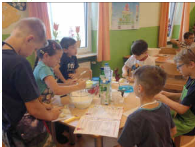
Echte Teamarbeit: ein Teil der Gruppe bereitet das Obst vor, andere rühren den Quark cremig