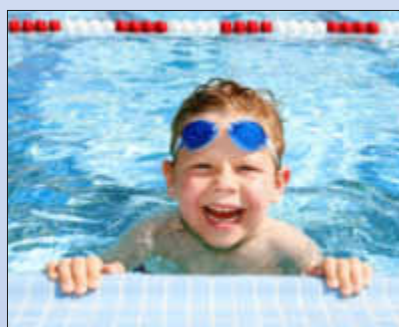
Schwimmen macht Spaß

Das Wallerfanger Freibad erwartet Sie! Und wenn es mal nicht so warm ist können Sie sich in der Dampfsauna aufwärmen und entspannen.