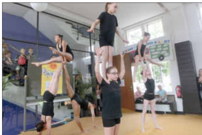
Zugabe: Die durch Krankheit reduzierte Gruppe der Rodener Sportakrobaten musste ihren begeisterten Auftritt gleich zwei Mal zeigen