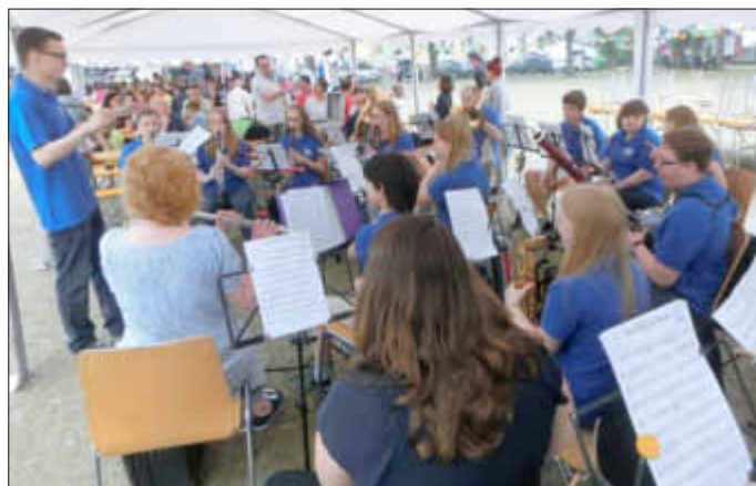
Ließen sich auch vom Dauerregen die gute Laune nicht verderben, sondern begeisterten die zahlreichen Gäste mit ihren darbietungen: die „Nachwuchsmusiker“ der Concordia Wallerfangen