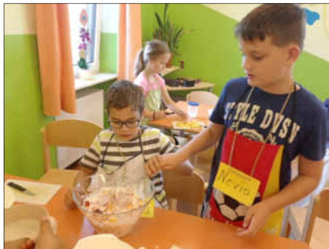
Obst und Quark werden gemischt - das sieht richtig lecker aus!