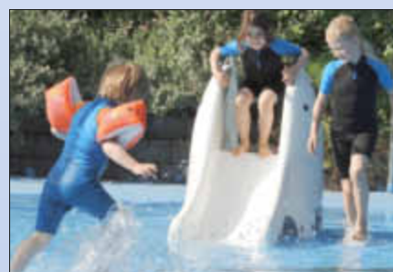
Auf der Elefantenrutsche im Wallerfanger Freibad haben Kinder besonders viel Spaß