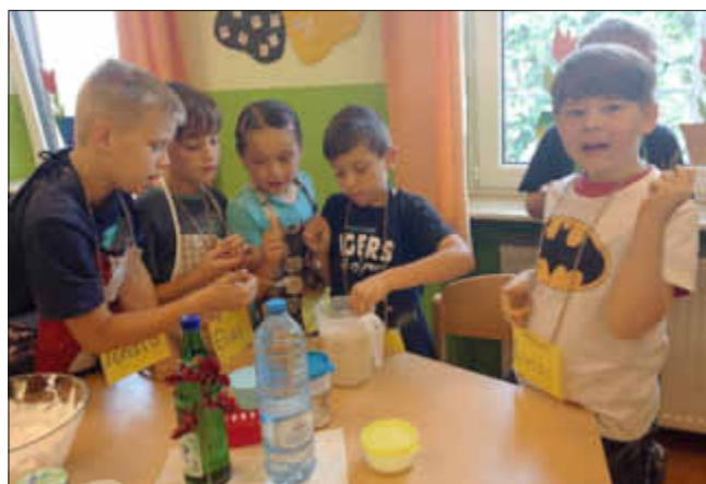
Mit der Chefkochprobe wird getestet, ob die Bananenmilch süß genug ist