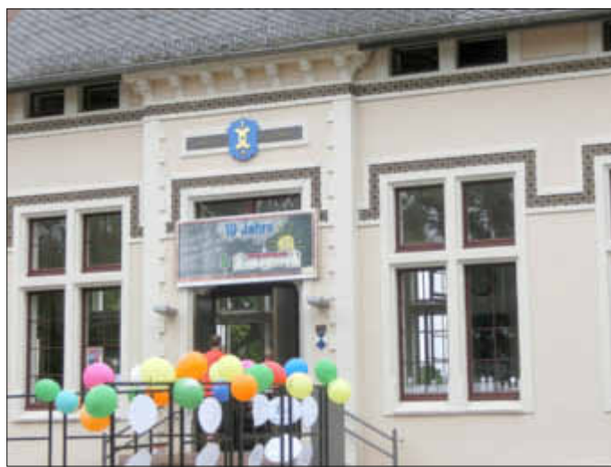
Fein herausgeputzt und mit Hunderten von Luftballons dekoriert erwartete die Schule ihre Geburtstagsgäste

Der einzige Totalausfall war der INNU Ausstellungstruck, der leider kurzfristig abgesagt worden war. hs