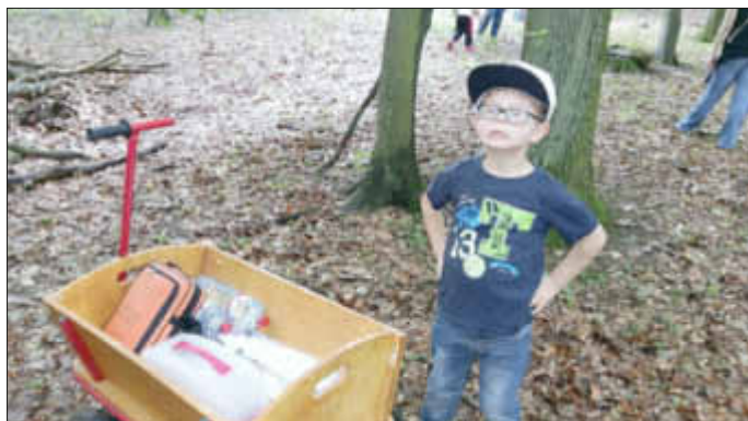
Wann geht das Picknick endlich los...?

Aber auch den Geschwisterkindern war anzusehen, dass sie große Freude daran hatten, mit der großen Schwester oder dem großen Bruder unterwegs und bei einer Unternehmung der Kita-Kinder dabei zu sein. Käfer und Regenwürmer wurden beobachtet, herumgetragen, aber auch „Unterkünfte“ für sie gebaut. Da zahlreiche Nacktschnecken unterwegs waren, wurden diese zu einem großen Thema am dem Nachmittag. Einige der Kinder fanden sie sehr aufregend und total interessant, andere wiederum fanden sie eklig und hatten sogar ein bisschen Angst vor ihnen.