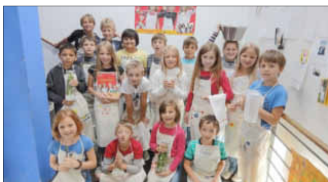
Die stolzen Köche