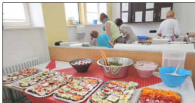
Alles sehr einladend: das Buffet