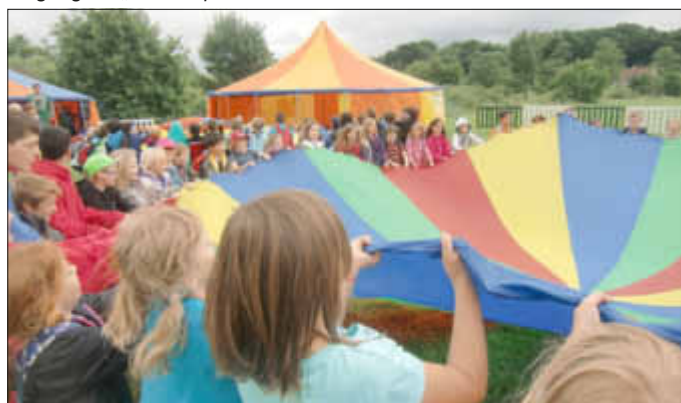
Hui, Bewegung macht warm

Dann erwartete uns im großen Zelt das Theaterstück » Henrietta in Fructonia «. Lustige Figuren und fröhliche Lieder vermittelten uns in ganz besonderer Weise, wie wichtig gesundes Essen und Bewegung für unser Wachstum, unsere mentale Fitness und allgemeine Entwicklung sind. Aber das war noch längst nicht alles: In den kleineren Zirkus-Workshop-Zelten konnten wir in verschiedenen Workshopangeboten unter Anleitung einige Grundregeln der Akrobatik oder Jonglage lernen. Spaßige Lauf-, Balancier-, Quiz- und Tanzspiele und sogar die Möglichkeit, gemeinsam die Ernährungspyramide nachzubauen ergänzten das vielfältige Angebot. Im Service-Zelt konnten unsere Lehrer Wissenswertes zu verschiedenen Themen der kindlichen Gesundheitsförderung erfahren: Die Palette reichte von gesunder Ernährung über Fragen zur Zahnpflege bis hin zu neuen Erkenntnissen über den Umgang mit chronischen Erkrankungen von Kindern. Es war ein schöner Wandertag, in dem wir alle eine Menge dazulernen konnten. hs