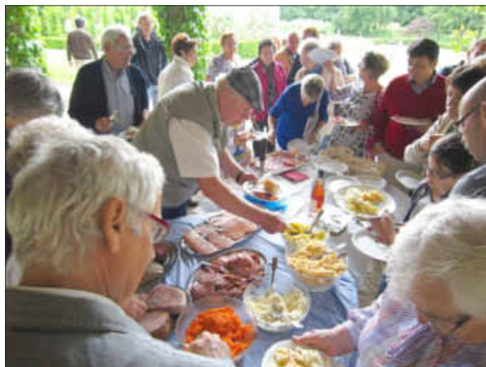
Picknick in Pange

der Großregion SaarLorLux« die erste Veranstaltung statt: Gemeinsam wurde eine Besichtigungstour durch die Gärten ohne Grenzen Lothringens durchgeführt: zunächst ging es zum maison Robert Schuman mit Garten, anschließend wurden wir vom Marquis persönlich durch das Château de Pange geführt und genossen dann ein reichhaltiges, französisches Picknick. Zum Schluss besichtigten wir dann noch den jardin de fruits de Laquenexy, wo der Tag seinen krönenden Abschluss fand.