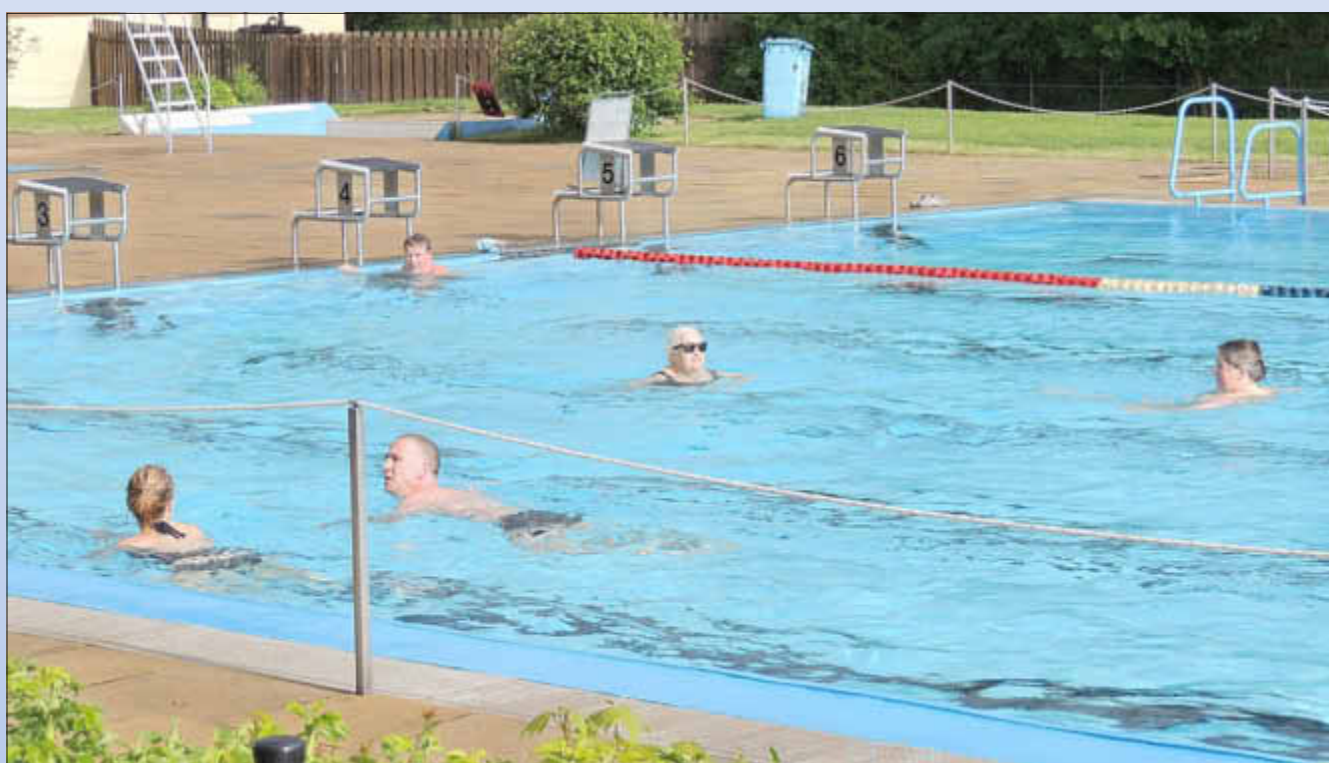
Hier ist noch Platz für Sie!