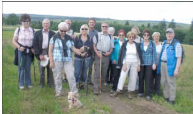
Am Ende der Wanderung vor dem Hochwald-Panorama