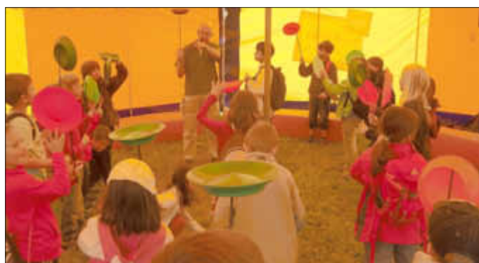
„Teller jonglieren“, eines von vielen Mitmachangeboten