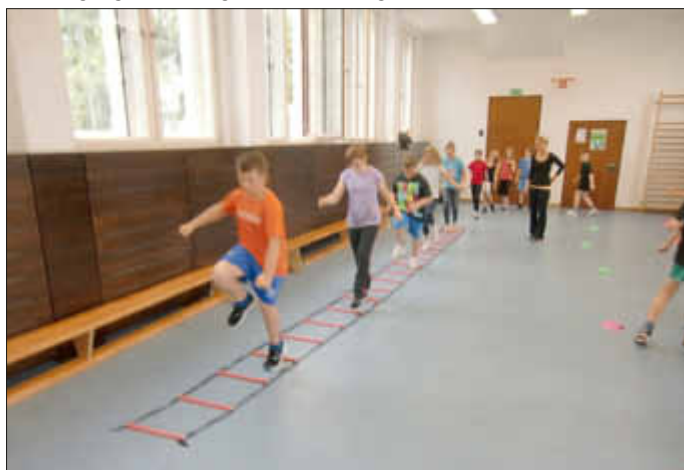
Ein guter Tennisspieler muss auch an seinen körperlichen Voraussetzungen arbeiten