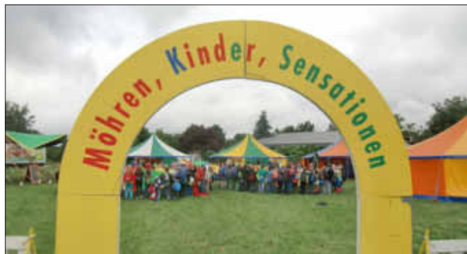
Eingang ins „Möhrenparadies“

Wir wurden sofort von einem Ansager empfangen und durften uns mit vielen lustigen Aufgaben an einem Schwungtuch warm spielen.