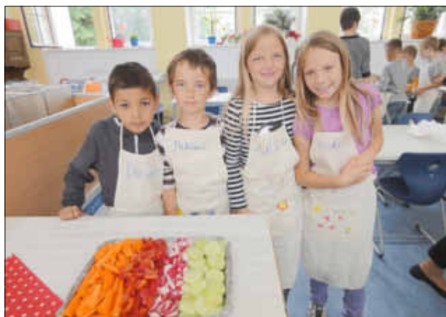
Appetitlich angerichtetes Knabbergemüse