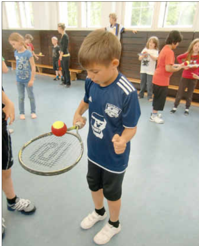
Der Umgang mit Schläger und Ball will gelernt sein

Wozu diese zum Teil etwas ungewöhnlichen »Sportgeräte« gut sind, erlebten sie dann in vielen, abwechslungsreichen Spielen. Und so freuten sich die Kinder zum Schluss der Stunde auch über das Angebot des Wallerfanger Tennisvereins, jederzeit eine richtige Trainingsstunde auf dem Tennisplatz besuchen zu können. hs