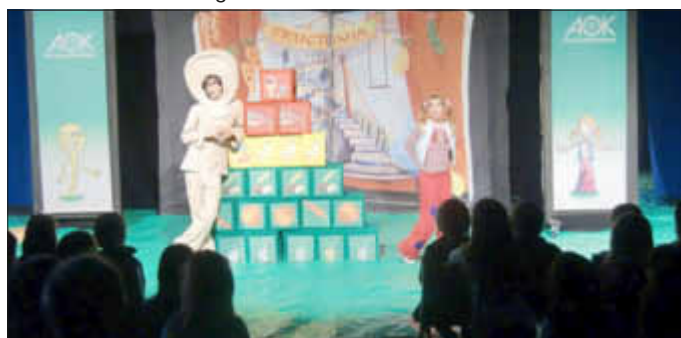
„Quassel“ klärt Henrietta über die Ernährungspyramide auf, eine Szene aus dem Theaterstück

Dann erwartete uns im großen Zelt das Theaterstück » Henrietta in Fructonia «. Lustige Figuren und fröhliche Lieder vermittelten uns in ganz besonderer Weise, wie wichtig gesundes Essen und Bewegung für unser Wachstum, unsere mentale Fitness und allgemeine Entwicklung sind. Aber das war noch längst nicht alles: In den kleineren Zirkus-Workshop-Zelten konnten wir in verschiedenen Workshopangeboten unter Anleitung einige Grundregeln der Akrobatik oder Jonglage lernen. Spaßige Lauf-, Balancier-, Quiz- und Tanzspiele und sogar die Möglichkeit, gemeinsam die Ernährungspyramide nachzubauen ergänzten das vielfältige Angebot. Im Service-Zelt konnten unsere Lehrer Wissenswertes zu verschiedenen Themen der kindlichen Gesundheitsförderung erfahren: Die Palette reichte von gesunder Ernährung über Fragen zur Zahnpflege bis hin zu neuen Erkenntnissen über den Umgang mit chronischen Erkrankungen von Kindern. Es war ein schöner Wandertag, in dem wir alle eine Menge dazulernen konnten. hs