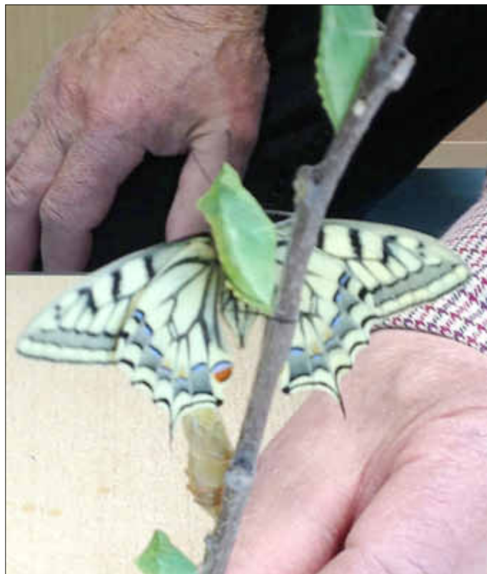
Der geschlüpfte Schwalbenschwanz