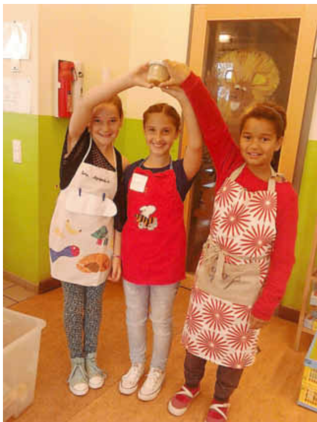
Das Schütteln der Salatsauce macht besonders viel Spaß