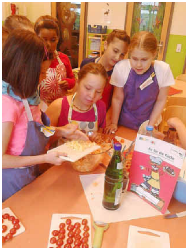
Der kleingeschnittene Käse wird untergemischt; die Tomaten sind vorbereitet