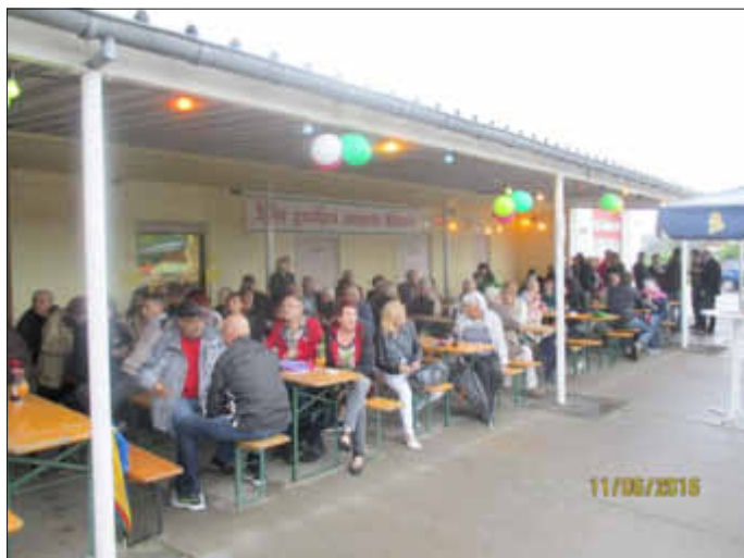
bei jedem Wetter kann man hier feiern