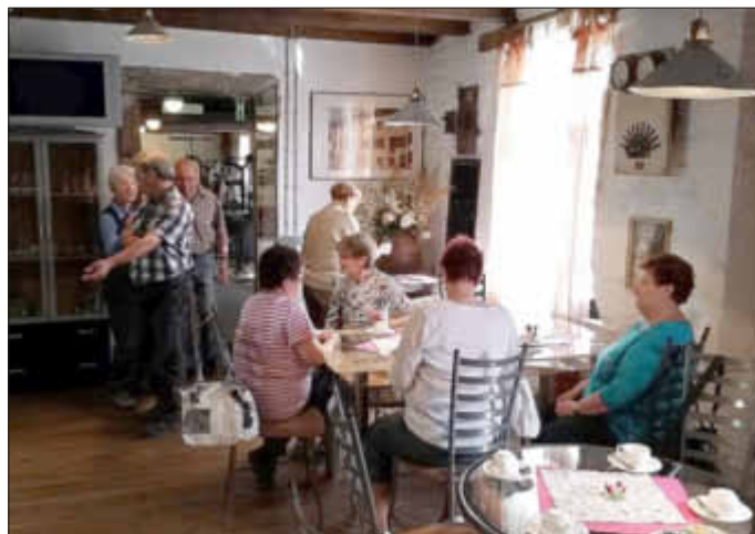
Im Bistro des Fellenbergmuseums

wickelte er die „Trauring-Graviermaschine Cardan“, die auch heute noch in wenigen Minuten die gewünschten Initialen in den Ring eingravieren kann. Die zum Antrieb der Maschinen benötigte Energie produzierte der Betrieb über eine Turbine selbst. Energielieferant ist genau wie damals der aufgestaute Seffersbach. Die fachgerechte und beispielhafte Sanierung der Fellenbergmühle wurde 1997 mit dem saarländischen Denkmalpflegepreis ausgezeichnet. Im Anschluss an die Führung konnte man sich mit Kaffee und Kuchen sowie mit kalten Getränken stärken.