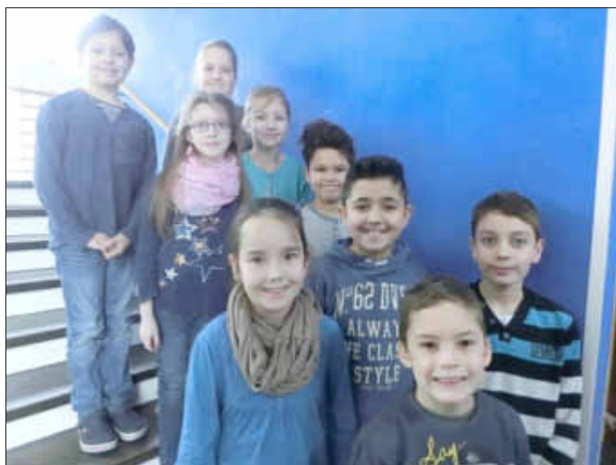
Das sind sie: Die ersten Schüler-Mediatoren der Grundschule Altes Rathaus

Alle freuen sich darauf, im neuen Schuljahr als Mediatoren zu starten und ihren Mitschülern in Streitsituationen helfen zu können. Krä-Jo