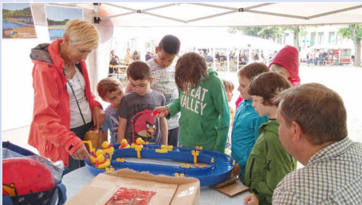
Großer Andrang beim Entchen-Angeln