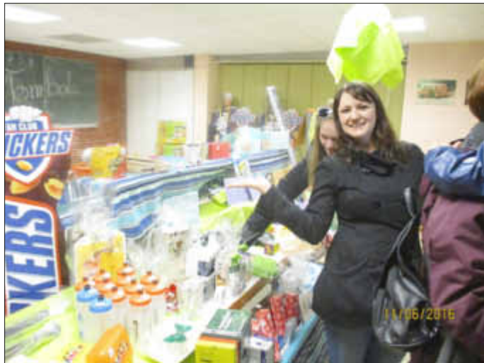
die Tobola zu Gunsten der Kindertanzgruppen