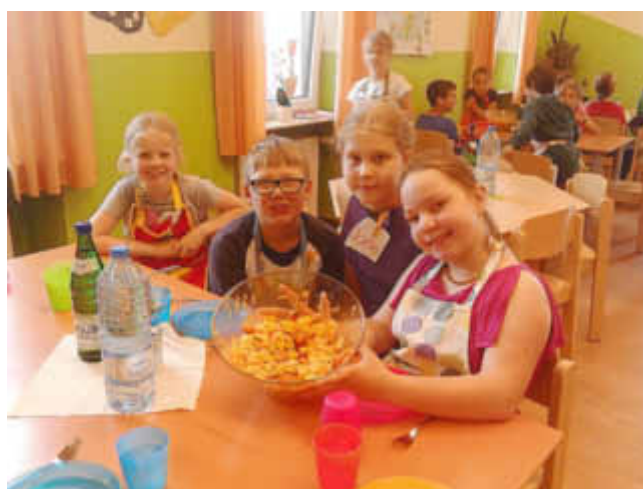
Stolz wird der fertige Nudelsalat präsentiert.