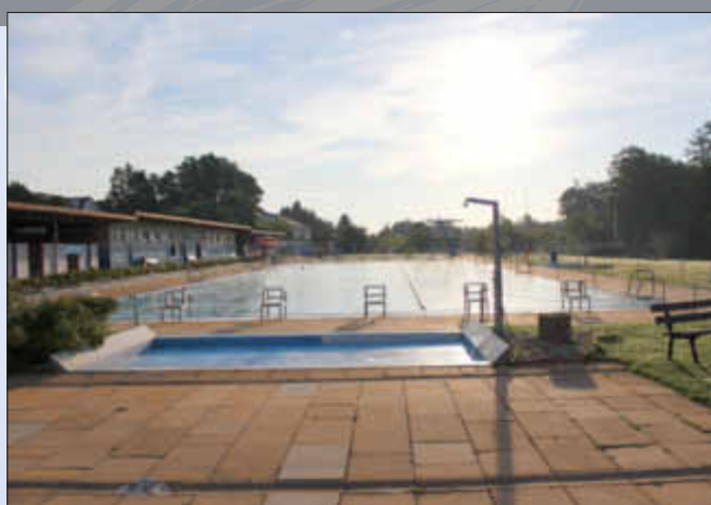
Morgens um 7 ist die Welt noch in Ordnung - vor allem im Wallerfanger Freibad