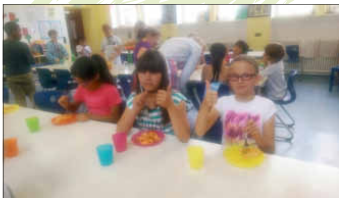
Eindeutig: der Salat schmeckt super!