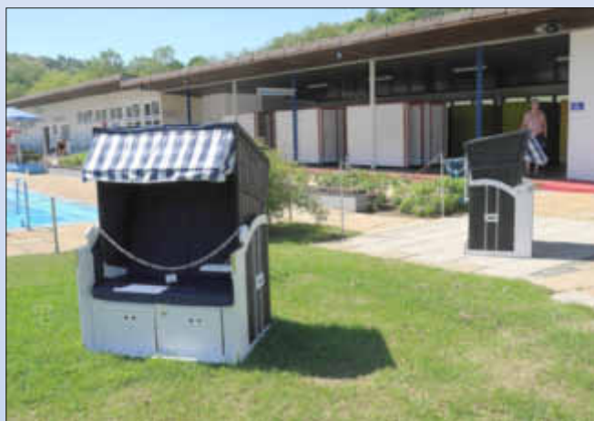
Die Strandkörbe warten auf Sonnenanbeter und Badegäste

Auch bei dem derzeitigen wechselhaften Wetter mit gemäßigten Temperaturen und häufigen Regenschauern finden täglich viele Schwimmfreunde den Weg ins Wallerfanger Freibad.