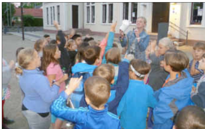
Auf geht's zur Schatzsuche...