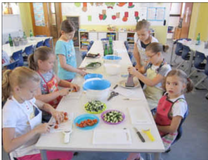
Vorbildlicher Arbeitsplatz mit den vorbereiteten Salatzutaten

Die Reibe wird von mehreren Kindern gleichzeitig genutzt