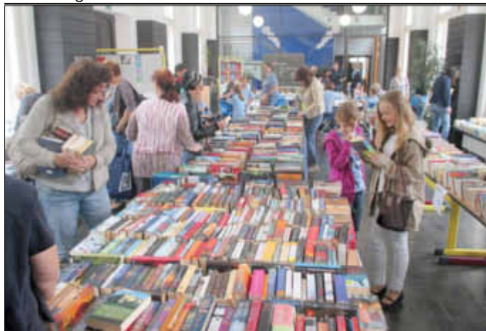
So sieht das Paradies für Leseratten aus: Bücher, Bücher, Bücher

Für das Finale wählte jede der teilnehmenden Klassen ihre besten Leser aus, die einen Abschnitt aus ihrem Lieblingsbuch vorlasen. Danach galt es, einen vorgegebenen unbekannt Text möglichst fehlerfrei und mit sinnvoller Betonung vorzutragen. Die Jury vergab in diesem Jahr die meisten Punkte an folgende Kinder: