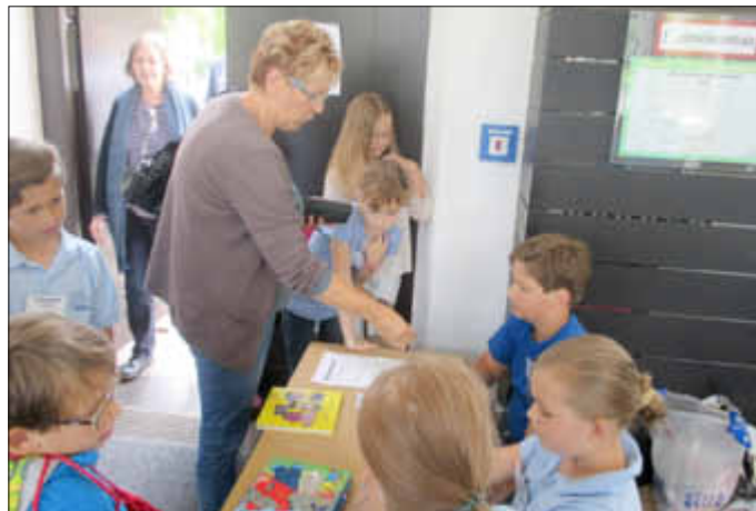
Tolle Leistung des Kinderrates, die den Verkauf souverän selbst durchführten

Der Förderverein bot wie im Vorjahr ein Lesecafe an, das von den Besuchern des Büchermarktes gut angenommen wurde.