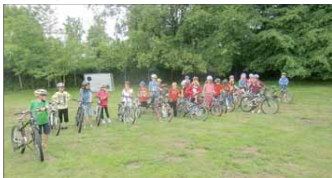
Präsentation der Gruppe vor dem Training

Beim eigentlichen Fahren der Wettkampfstrecke zeigten alle Trainingsteilnehmer großen Ehrgeiz. Auch hier wurden wichtige Erfahrungen gesammelt. Die Schüler lernten nicht nur die Strecke sondern auch das Streckenprofil kennen und konnten sich erste taktische Strategien zurechtlegen. Bis zum Wettkampf hat nun auch jeder Gelegenheit, die »Rennstrecke« privat zu üben.