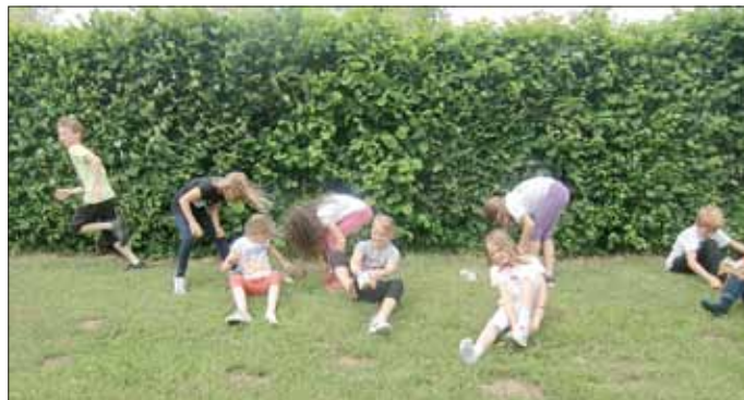
Das schnelle »Schuheanziehen« nach dem Schwimmen will gekonnt sein