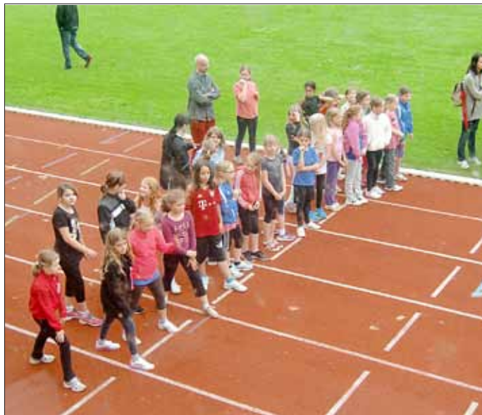
Kurz vor dem Start des 800 m Laufes der Mädchen aus den 3. und 4. Schuljahren