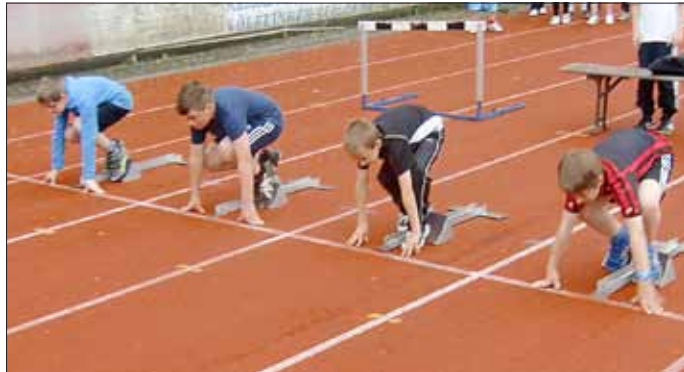
Auf die Plätze...fertig.... - Start zum 50 m Lauf