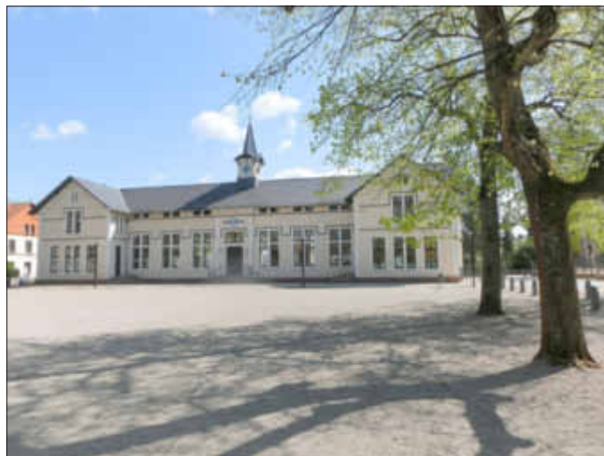
Das Geburtstagskind freut sich auch auf Ihren Besuch bei seiner Geburtstagsfeier am Samstag, 25. Juni 2016

Für eine gute Bewirtung ist selbstverständlich auch gesorgt. So werden zum Beispiel allein über 50 selbstgebackene Kuchen auf ihre Abnehmer warten. hs