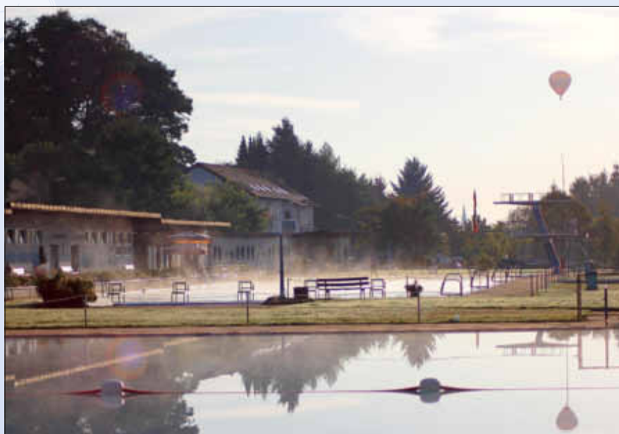
So tolle Impressionen findet man in unserem Freibad!

Das wegen des Regenwetters ausgefallen Fest „Familien in Bewegung“ soll übrigens am 4. September nachgeholt werden! Bitte vormerken!