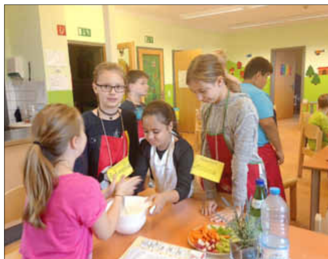
Das Rühren mit dem Schneebesen macht besonders viel Spaß