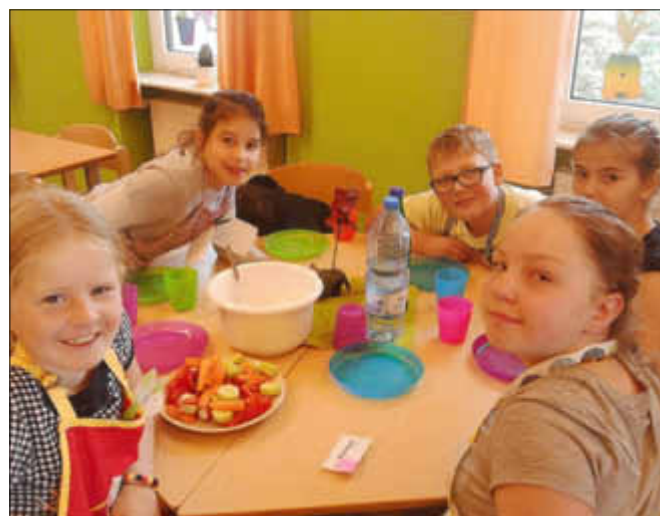
Stolz auf das Ergebnis der gemeinsamen Vorbereitung