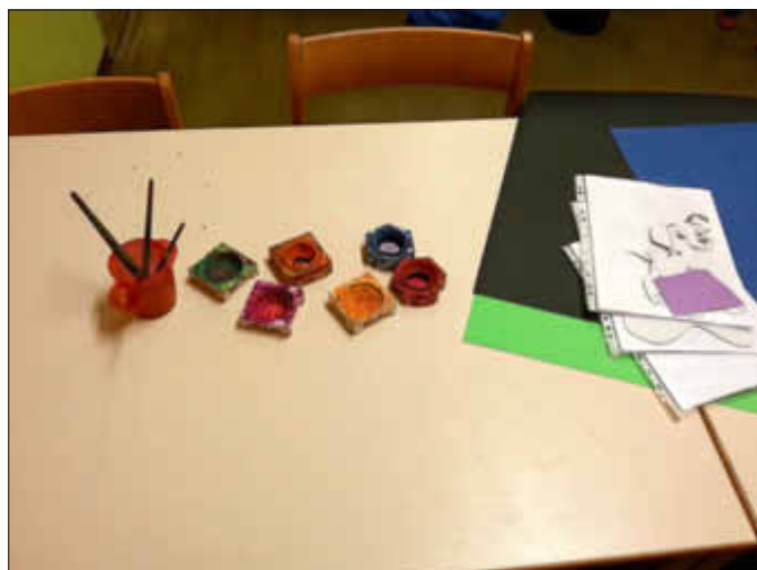
Materialien bereitstellen - alles weitere erledigt sich von selbst...