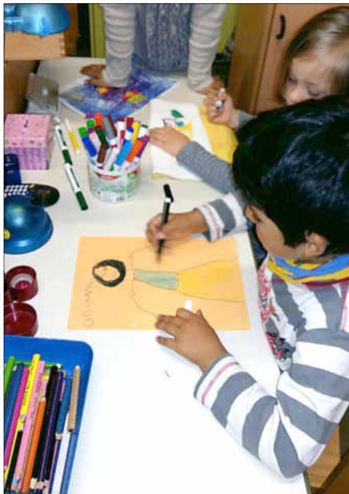
Klar und detailliert gemalt...