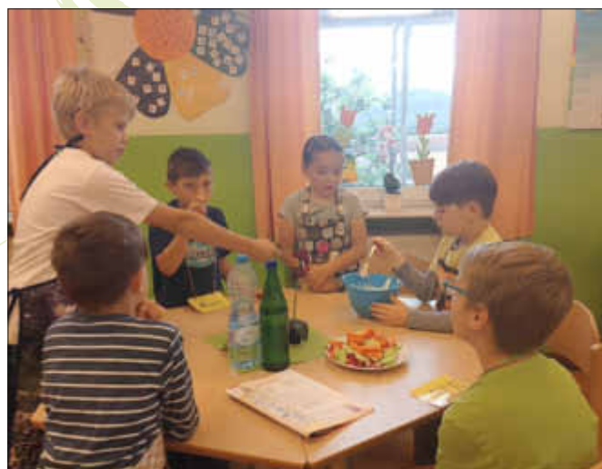
Die Chefkochprobe -genug gewürzt?