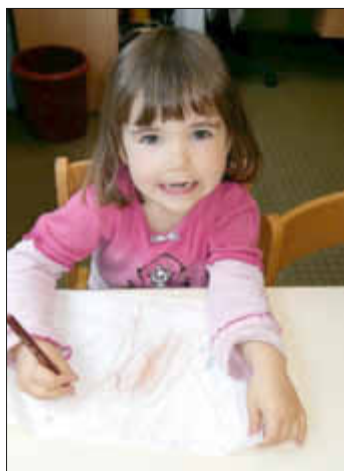
Die Freude am kreativen Tun ist ihr anzusehen!

Sie interessieren sich dabei meist weniger für verschiedene Farben, sondern bleiben bei einem Stift in einer Farbe, bis sie das Bild zu Ende gemalt haben.