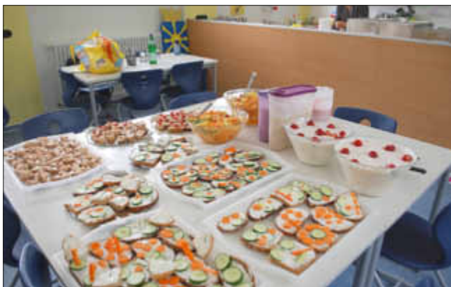
Sehr einladend: das Buffet zum Abschluss