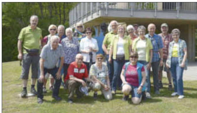
Vor dem Europadenkmal in Berus.

Den Abschluss in geselliger Runde mit Essen und Trinken machten wir beim Bauer Ehl in Altforweiler.