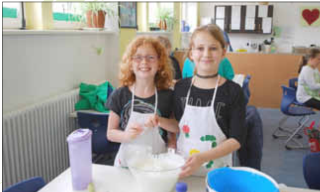
Stolz präsentieren die Mädchen ihren Früchtequark