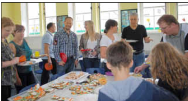
Eltern und Kinder greifen mit Appetit zu