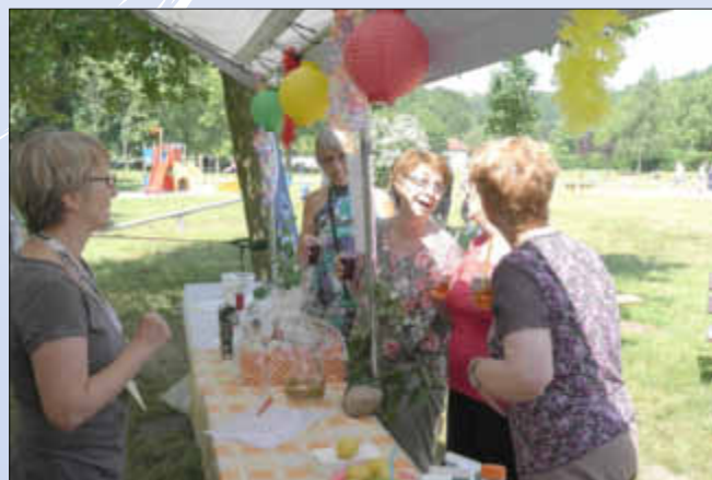
Bei sommerlichen Temperaturen sehr beliebt: Cocktails