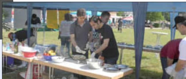
Die Grillspezialitäten der syrischen Neubürger waren schnell ausverkauft