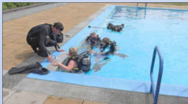
Ein Highlight - Schnuppertauchen