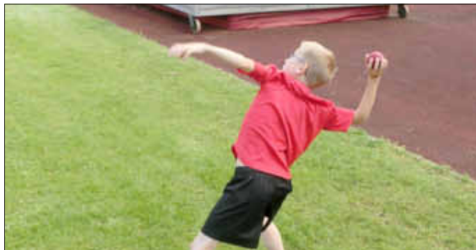
Beim Schlagballweitwurf kommt es neben dem Anlauf auch auf die richtige Wurftechnik an