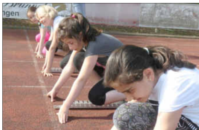
Vorbereitungen im Startblock zum 50 m Lauf