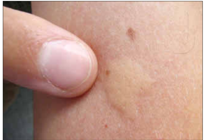
Quaddel nach Insektenstich

Entzündungsreaktionen nach Stichen werden behandelt mit Ruhigstellung, evtl. Hochlagerung und Kühlung des betroffenen Körperteils sowie mit Umschlägen mit Alkohol, Quark oder essigsaurer Tonerde. In Einzelfällen kann hier auch eine Antibiotikagabe notwendig sein.