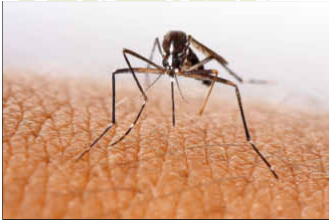
Stechmücke vor dem „Angriff“

Vor allem im Sommer sind nicht nur die Menschen aktiver sondern auch die Insekten.