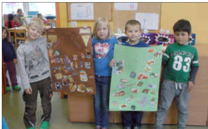
Die Kinder präsentieren stolz die Ergebnisse...

Was ist gesund für Zähne, was braucht man zur Zahnhygiene, was ist das überhaupt, wie bleiben die Zähne lange gesund und viele weitere Fragen wurden in der Kita mit den Kindern besprochen.