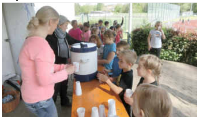
Wer sich viel bewegt, muss auch viel trinken. Der Förderverein servierte allen Schülern einen köstlichen Zitrontee.