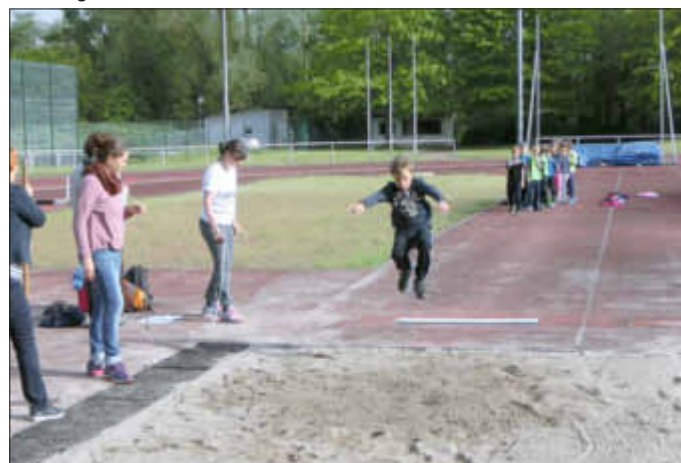
Beim Weitsprung konnten die helfenden Eltern viele gute Weiten messen