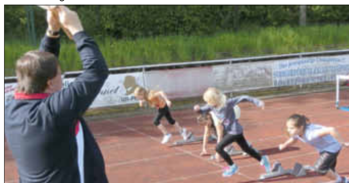
Ganz wichtig die „Startreaktion“