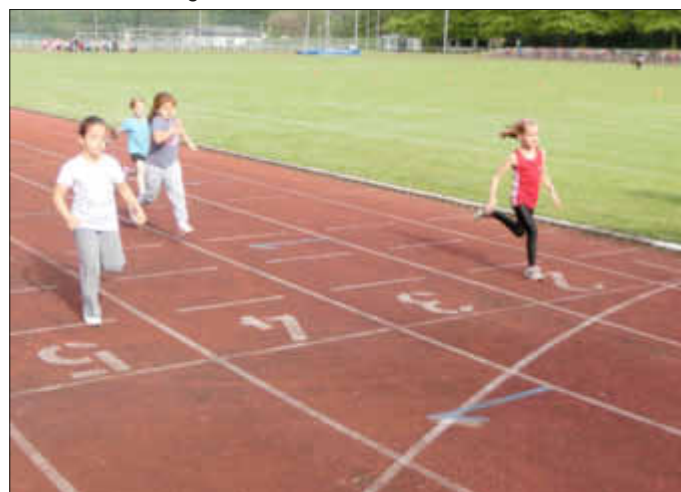
Ganz wichtig, und das wissen -wie wir hier sehen- schon die Erstklässler, ist am Ende des Laufes dann natürlich auch ein guter Schlusspurt bis zur Zielgeraden