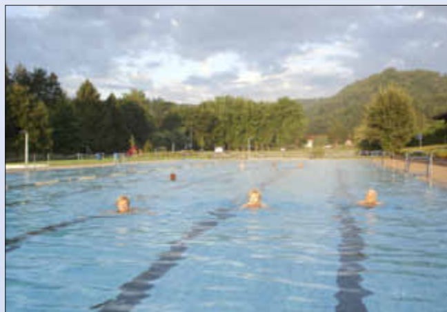
Fröhliche Gesichter auch bei Wolken am Himmel