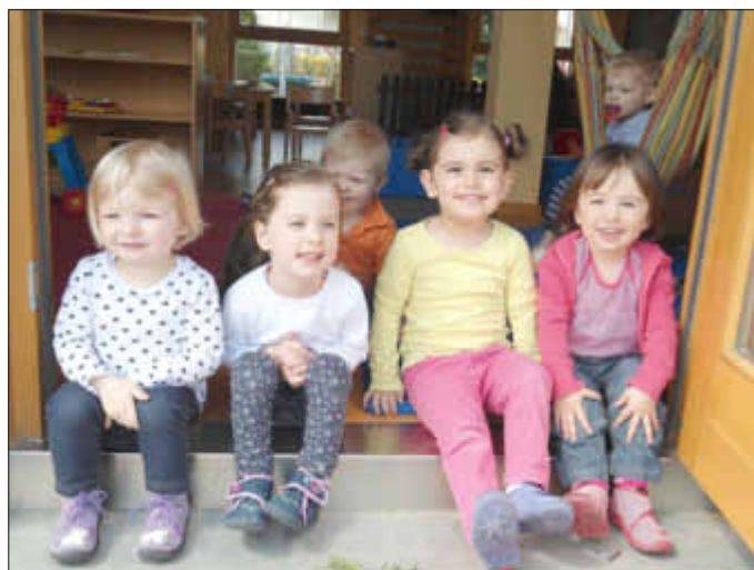
Die Kinder aus dem Wichtelzimmer beobachten die Arbeiter auch genaustens bei ihrer Arbeit.

Regelmäßig veranstalten wir in Zusammenarbeit mit dem Blutspendedienst West einen Blutspendetermin in der Walderfingia in Wallerfangen.