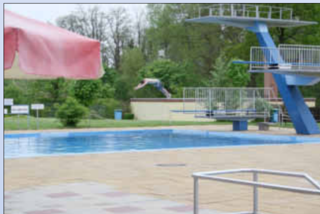
Auch bei trübem Wetter kann ein Sprung ins Wasser Spaß machen