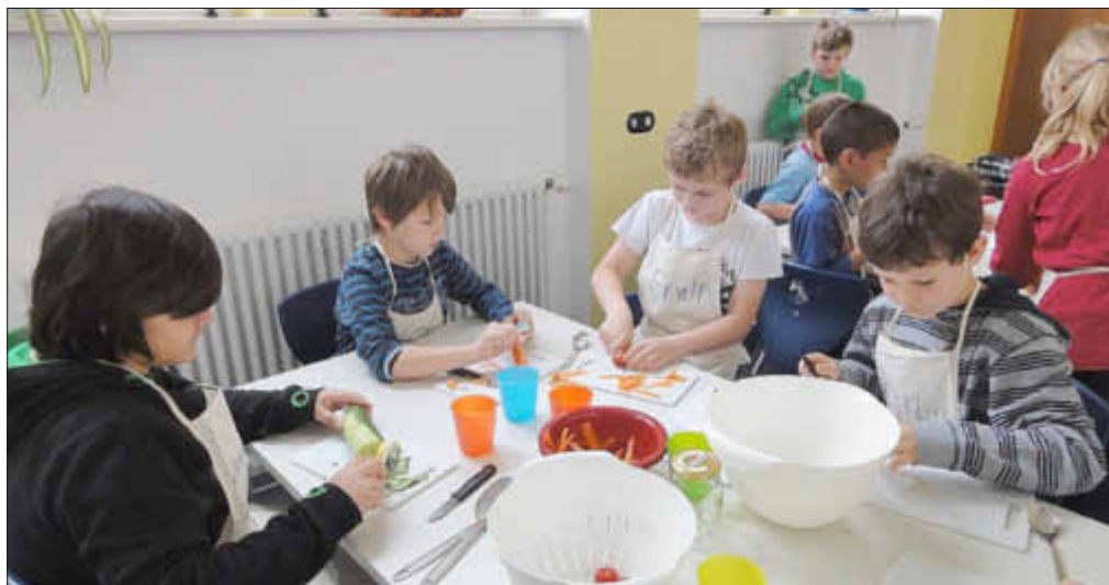
Das Schälen und schnippeln klappt schon sehr gut