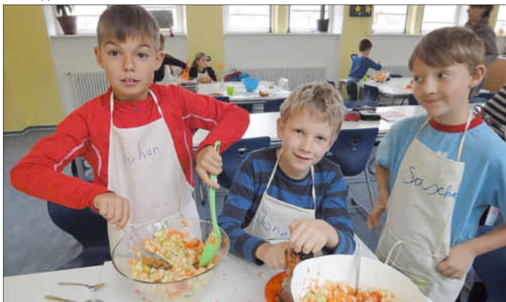
Mit geraspelter Möhre schmeckt der Nudelsalat besonders frisch