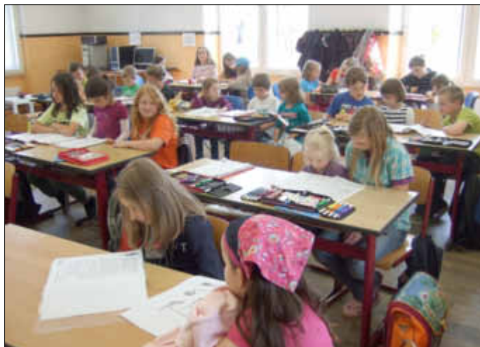
Die fleißigen Leser bei der Arbeit

Nicht mehr lange und die zukünftigen Schulkinder werden eingeschult! Um ihnen vorab schon mal einen ersten Einblick in das Schulleben zu ermöglichen und dabei Kinder und Lehrer unserer Grundschule kennenzulernen, haben sich die vierten Klassen überlegt, die zukünftigen Schulkinder an unsere Schule einzuladen.