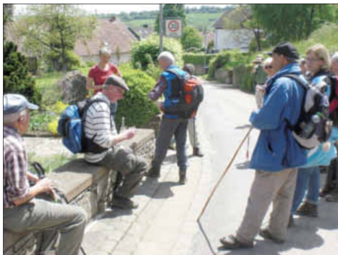
Schnapsprobe in Ihn

2. Die Pfingstfahrt 2013 führte vom Rathaus in Wallerfangen zuerst zur römischen Villa in Perl-Borg. Aufgrund der 39 Teilnehmer mussten 2 Führungen gebucht werden. Die erste Gruppe durfte leider den Film nicht sehen, aber manchmal wird der »Vordrängler« bestraft. Die beiden weiblichen Führerinnen boten sehr interessante Führungen. Ob es sich um die Geschichte oder die Architektur handelte; alle Fragen konnten perfekt von den beiden beantwortet werden. »Hier, im Dreiländereck von Frankreich, Luxemburg und Deutschland, sind allein aus der römischen Zeit über 50 Fundstellen bekannt, was auf eine hohe Besiedlungsdichte und somit ein engmaschiges Netz von kleineren und größeren Villen hindeutet. Ein weiteres bedeutendes Beispiel ist die 1852 zufällig entdeckte und in mehreren Grabungskampagnen freigelegte Villa von Nennig mit ihrem Mosaikfußboden.