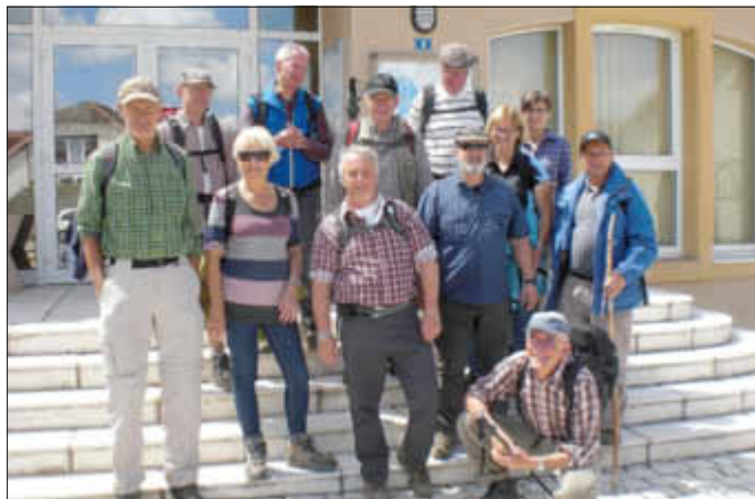
Mittagsrast in Guerstling