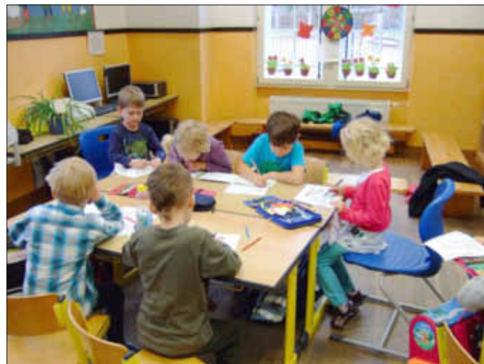
Hier arbeiten die Vorschulkinder mit unseren Erstklässlern zusammen

Die Kinder und Lehrer der Schule freuen sich schon jetzt darauf, die zukünftigen Schulkinder ab dem nächsten Schuljahr als Schüler an unserer Schule begrüßen zu dürfen.